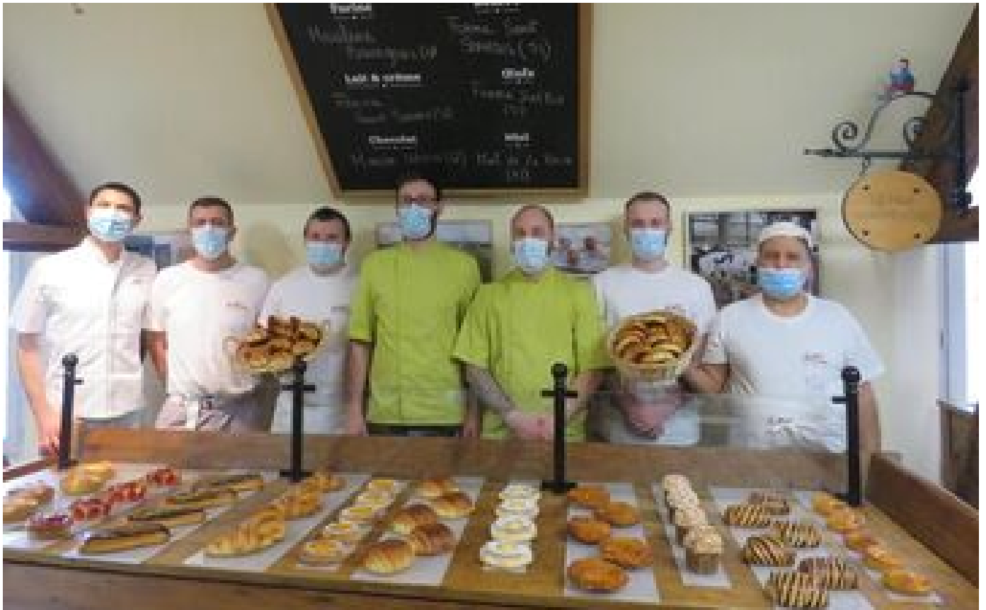
Fournisseurs de 1200 boulangeries en Ile-de-France, les Moulins Bourgeois lancent leur école P