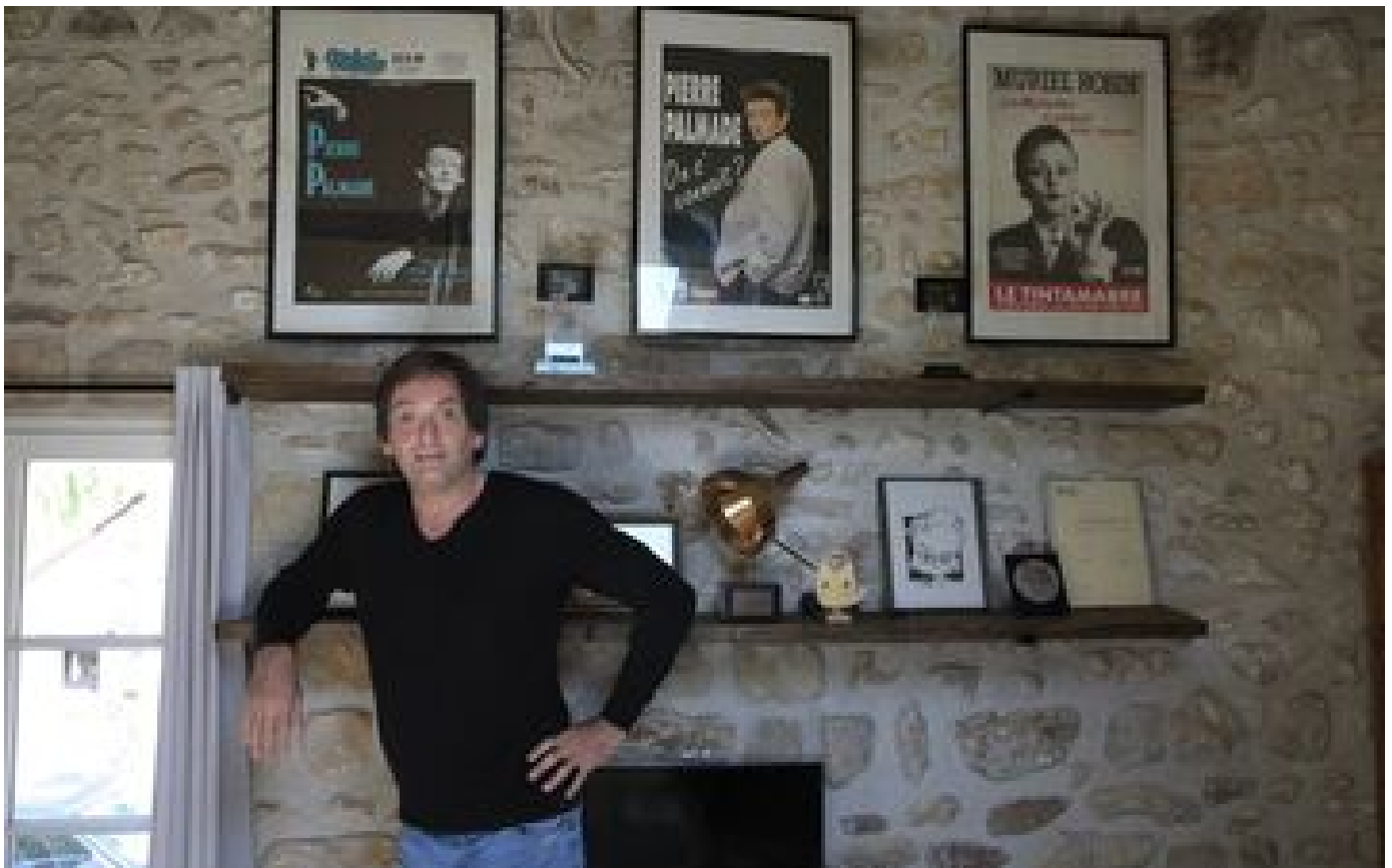
Pierre Palmade grièvement blessé dans un accident de voiture, mais « ses jours ne sont plus en danger »