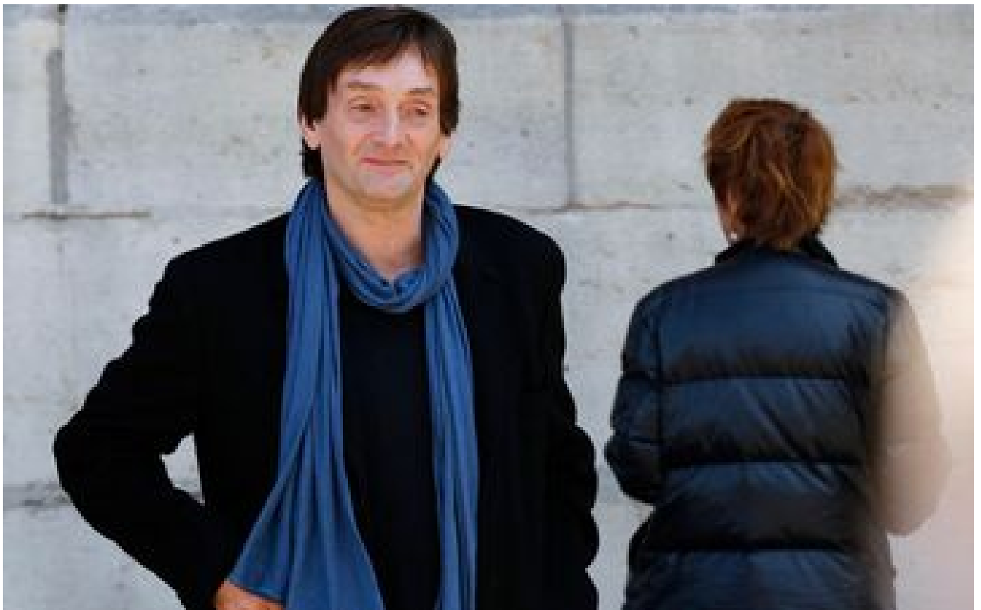
Pierre Palmade grièvement blessé : ce que l'on sait des circonstances de l'accident de la route