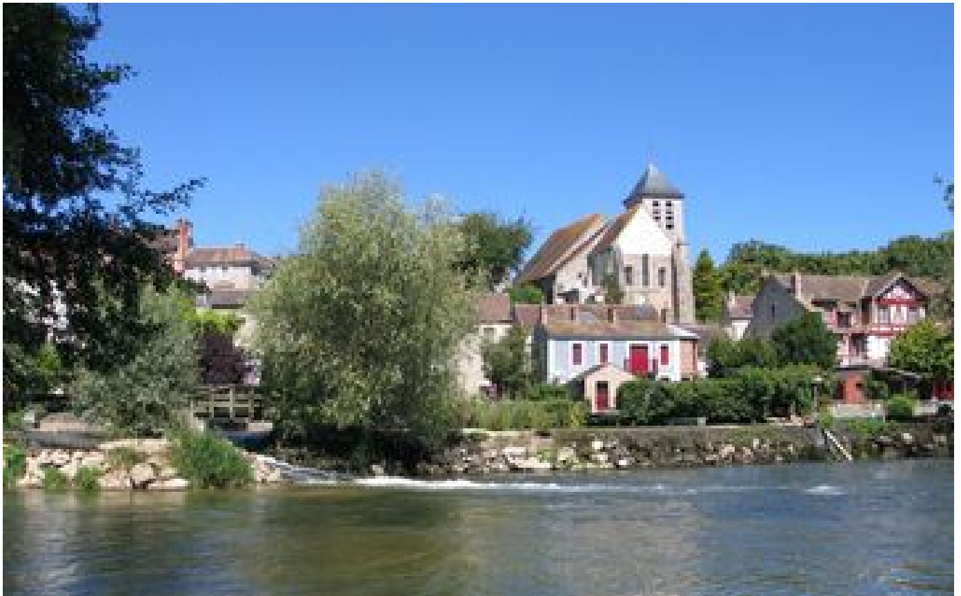
Seine-et-Marne : six nouveaux villages montrent leur caractère