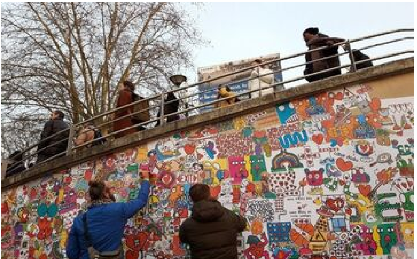
Gare de Melun : l'artiste Romain Jungle et des habitants égayent l'entrée du tunnel en créant une fresque colorée