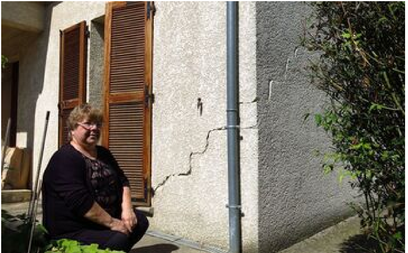
Seine-et-Marne : l'état de catastrophe naturelle pour quinze communes de plus