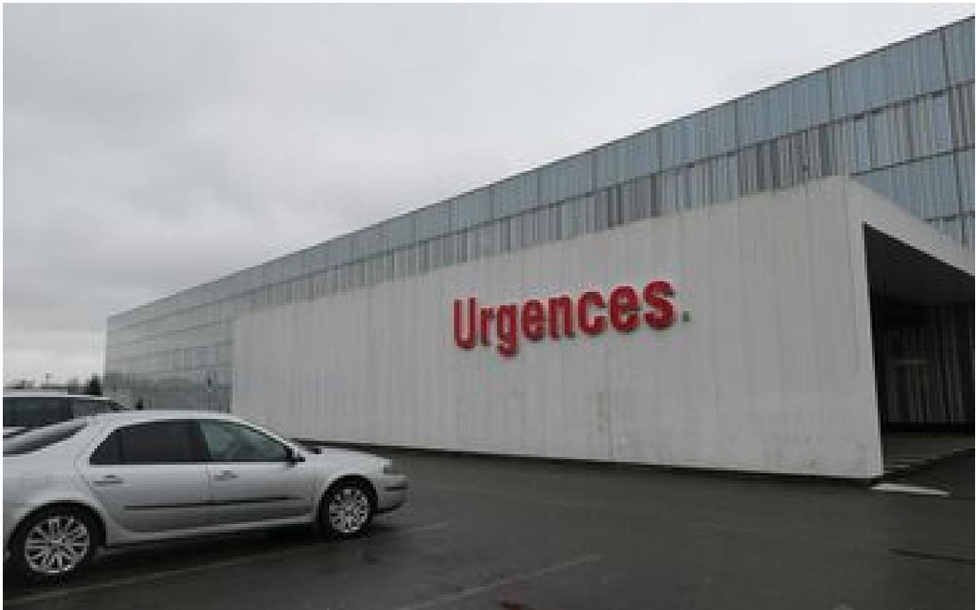
Jossigny : un patient de l'hôpital retrouvé en hypothermie après avoir fugué des urgences