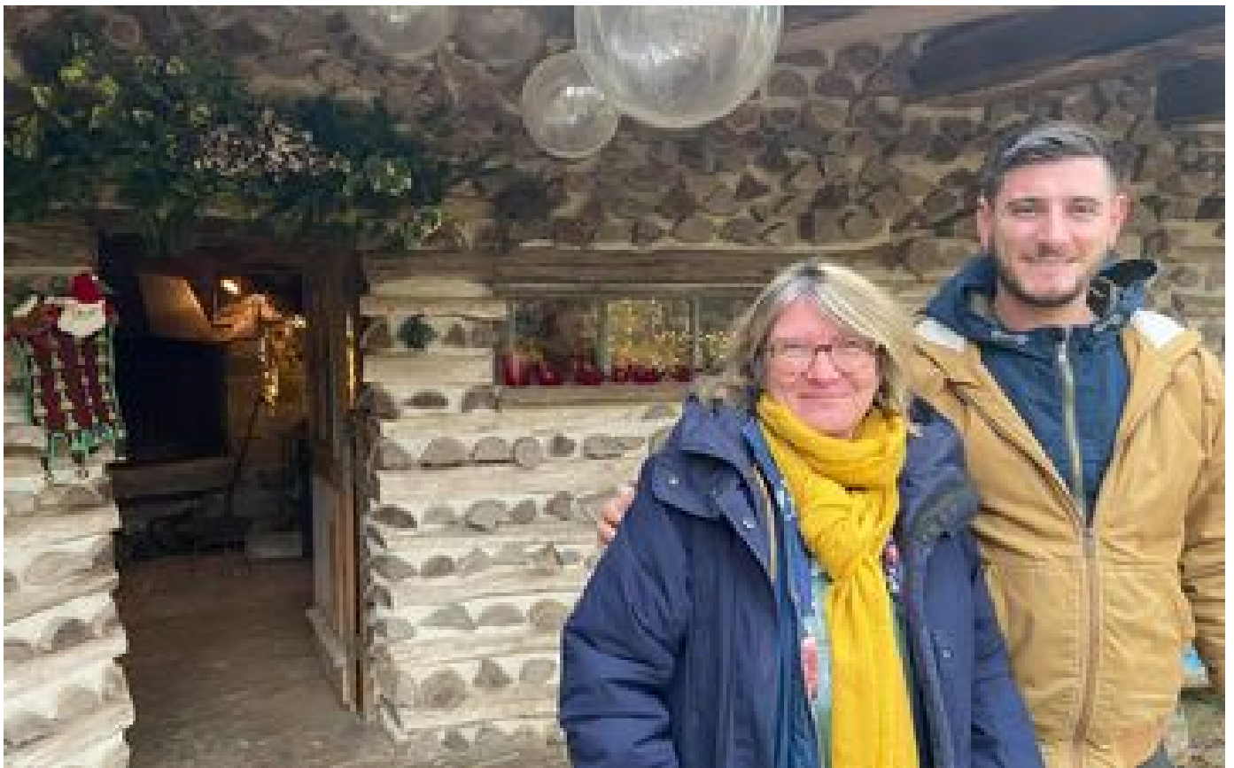
Verdelot : au jardin du Point du Jour, les féeries et la cabane du Père Noël enchantent petits et grands