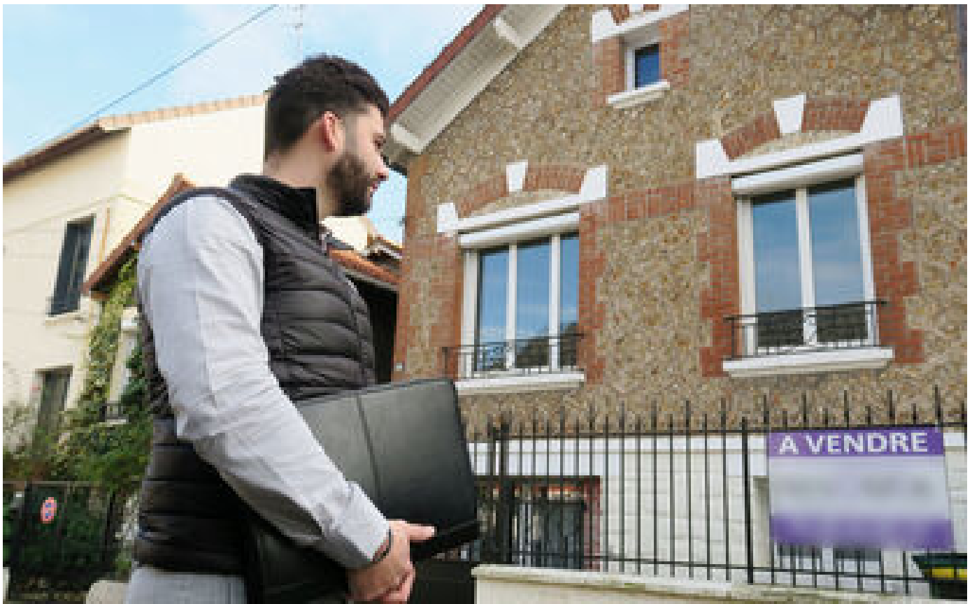
Prix de l'immobilier : « Paris entraîne dans sa chute tout le reste de l'Île-de-France »