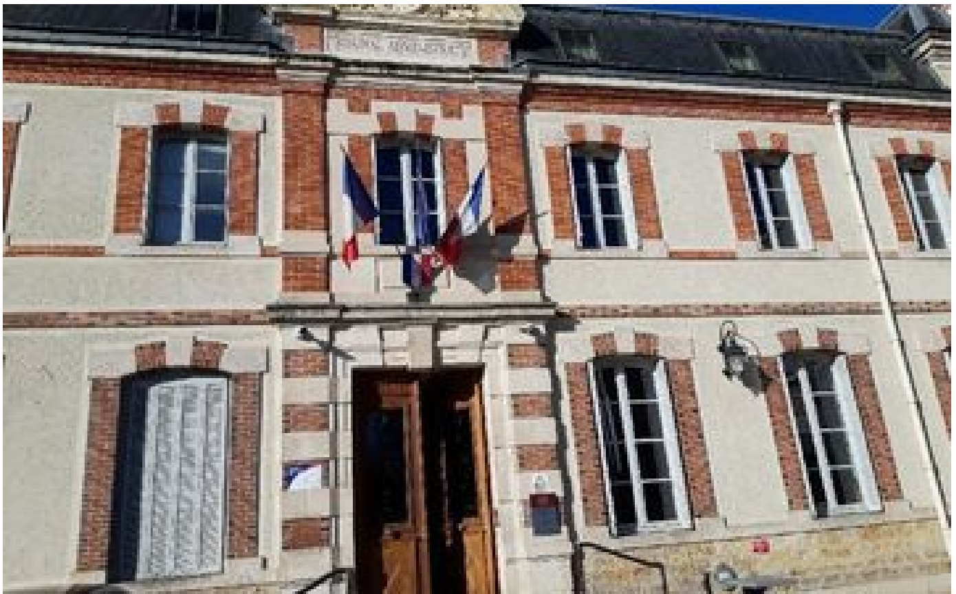
Au tribunal administratif de Melun, le contentieux des étrangers a représenté près d'une affaire nouvelle sur deux en 2022