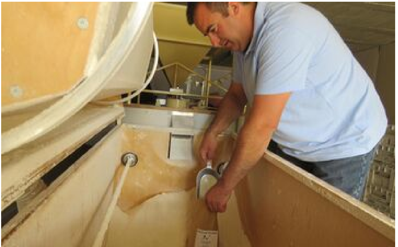
Pain, beurre, fromage... ces agriculteurs franciliens transforment eux-mêmes leur production à la ferme P