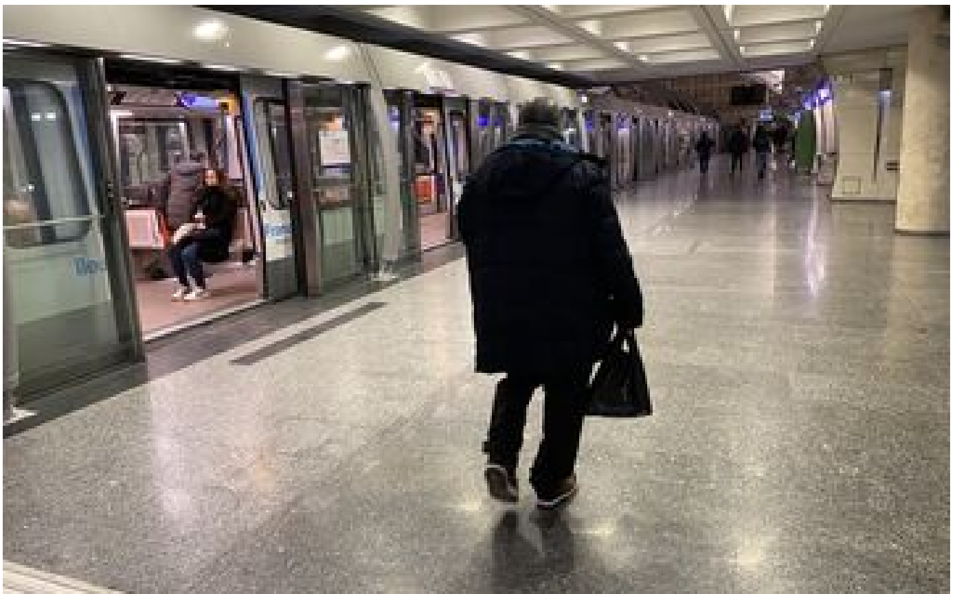
Transports en Ile-de-France : les perturbations du week-end des 11 et 12 février