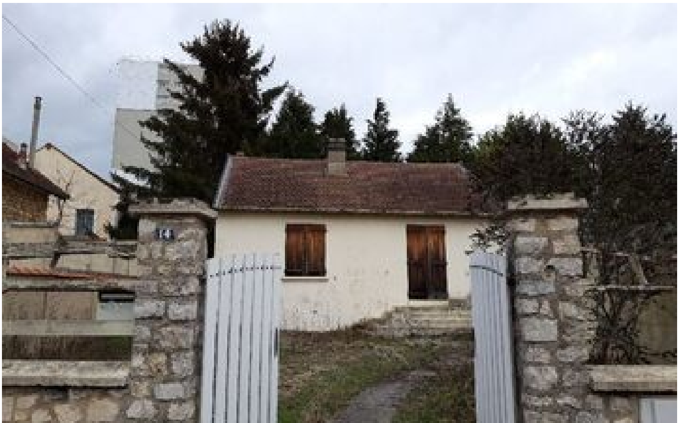
Melun : des questions subsistent après le décès de la nonagénaire à son domicile