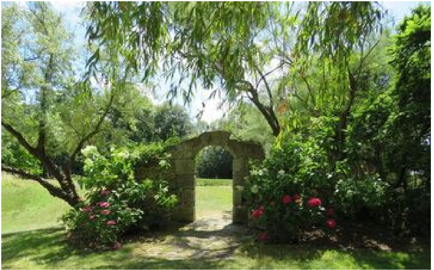
Seine-et-Marne : calme et beauté au jardin du Point du jour à Verdelot