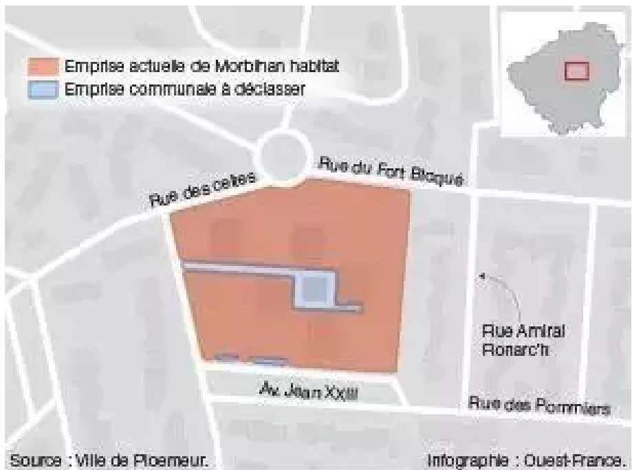
Emprise actuelle des cinq tours.

L'emprise du projet est prévue sur le périmètre actuel occupé par les cinq tours. L'impasse Duguesclin, propriété communale et qui pénètre entre les tours sera intégrée au projet. Préalablement à toute cession du domaine communal, il est nécessaire de déclasser du domaine public les parties cédées (la parcelle DI301 de 959 m2 et une partie de la parcelle DI302 pour 450 m2). La voirie et le parking jouxtant la résidence restent, quant à eux, communaux. Un élément de nature à rassurer les riverains qui s'inquiétaient d'une éventuelle diminution du nombre de stationnement. Le déclassement ne sera prononcé qu'après désaffectation matérielle sur site afin de recueillir les avis de l'enquête publique.