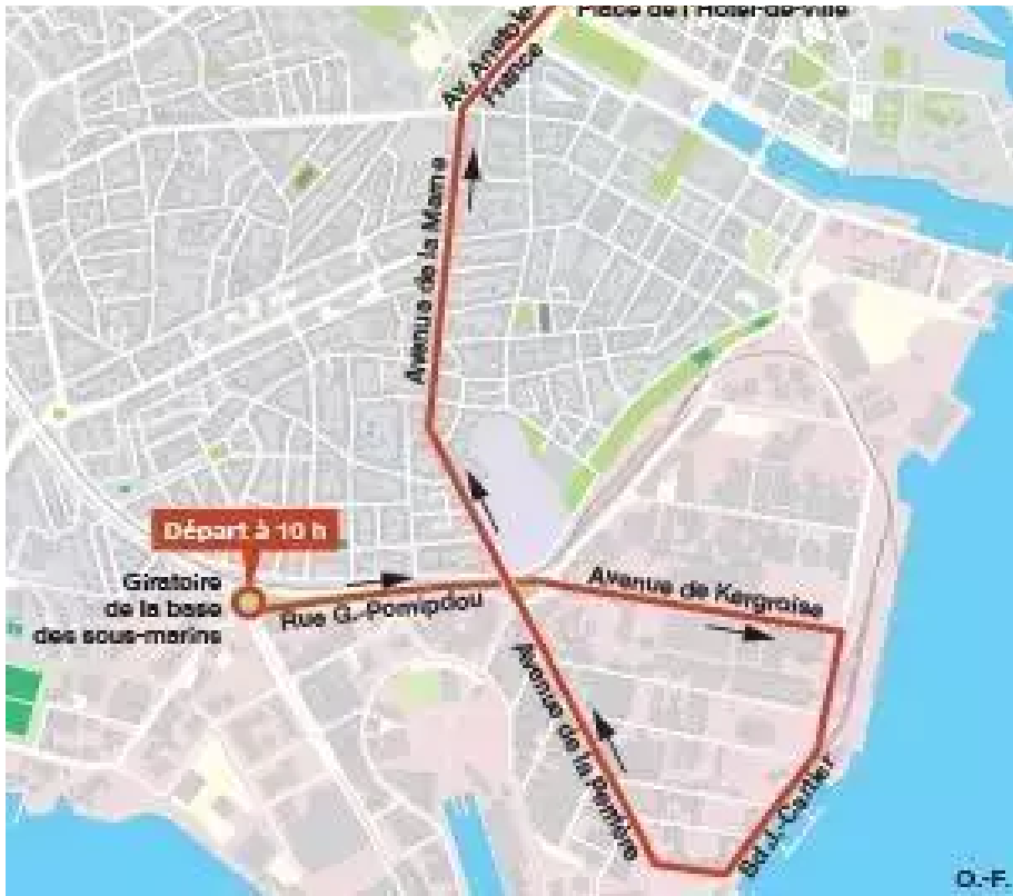
Le cortège formera une grande boucle vers le port de commerce et l'avenue de La Perrière avant de rejoindre le centre-ville par l'avenue de La Marne.

Du côté des perturbations, dans les écoles, les services de restaurations et d'accueil périscolaires seront fortement perturbés. Le service minimum d'accueil sera concentré à l'école de Keroman. Le centre aquatique du Moustoir est fermé . Seuls les cours collectifs sont maintenus.