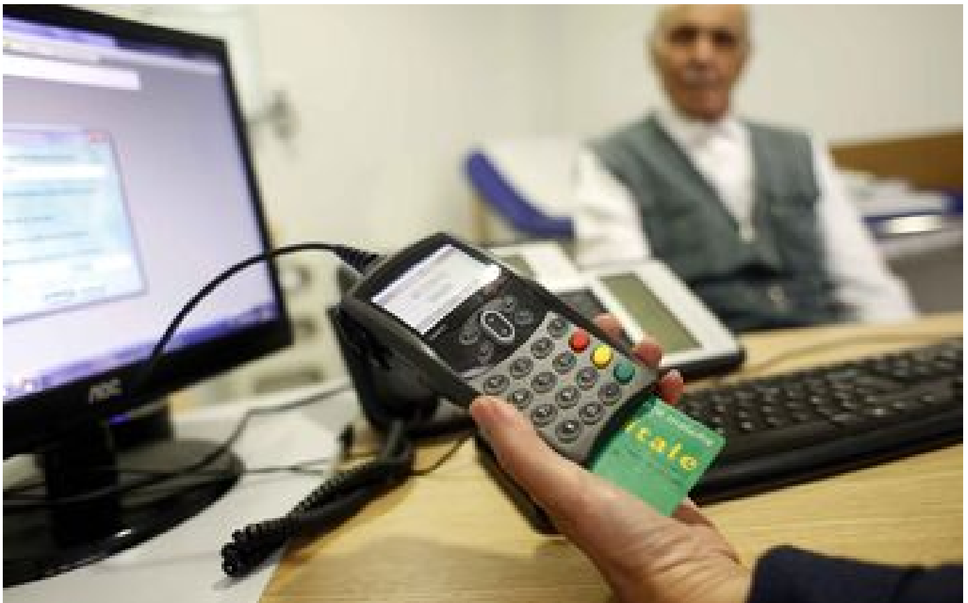
Abonnés Ils vivent sans mutuelle : « L'Assurance maladie fait bien le job, je ne vois aucun intérêt à payer plus »