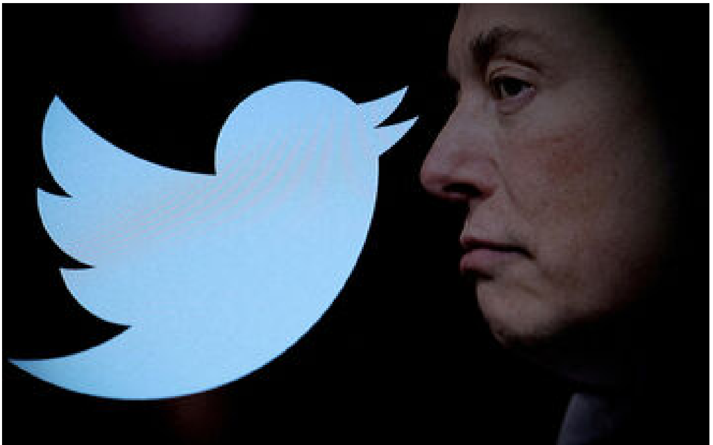
Twitter lance sa version payante et ses labels différenciés en France