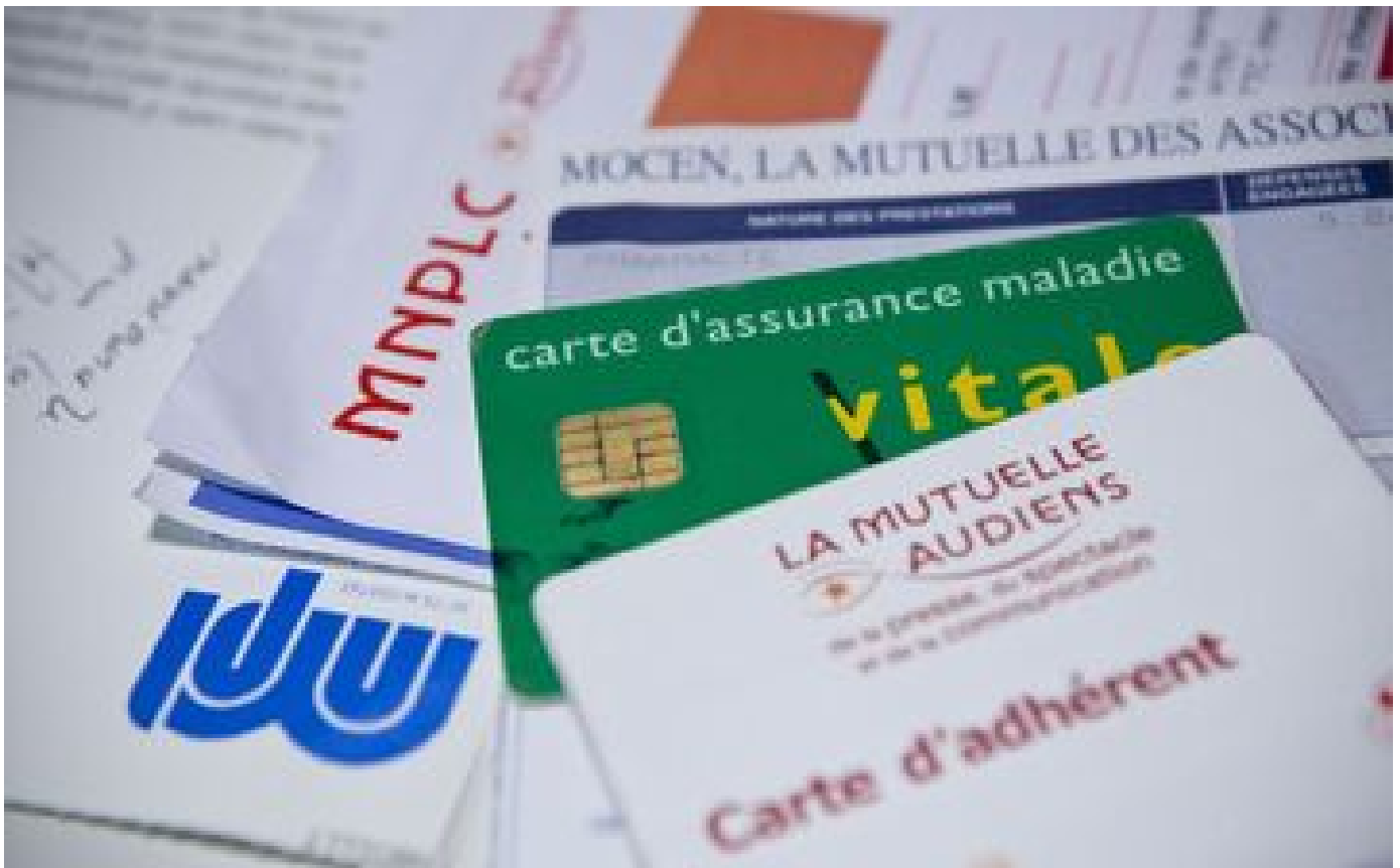
Abonnés Complémentaires santé : face à l'envolée des cotisations, ces assurés qui réduisent leurs garanties