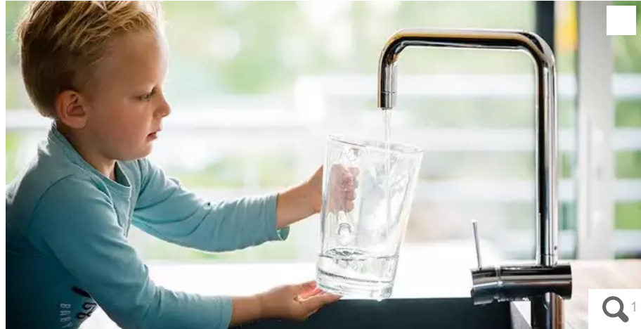
Certaines communes de Lorient agglomération changent de prestataires s'agissant de l'eau et de l'assainissement.

Le marché d'exploitation du service public d'eau potable de plusieurs communes de Lorient agglomération (Morbihan) est arrivé à échéance au 31 décembre 2022 ou au 31 janvier 2023 et plusieurs changements sont également à noter côté assainissement.