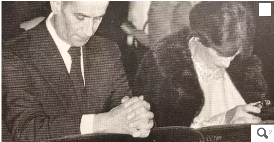
Louis de Funès et son épouse Jeanne fréquentaient régulièrement l'église Saint-Martin du Cellier, où ils habitaient.

Louis de Funès était très discret lorsqu'il venait se reposer dans son château de Clermont, au Cellier (Loire-Atlantique). Pour être assuré de le voir, il fallait se rendre à la messe, le dimanche matin.