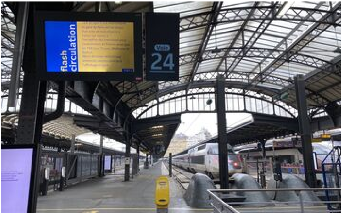
Panne à la gare de l'Est : la reprise du trafic mercredi reste incertaine après un «acte de malveillance»