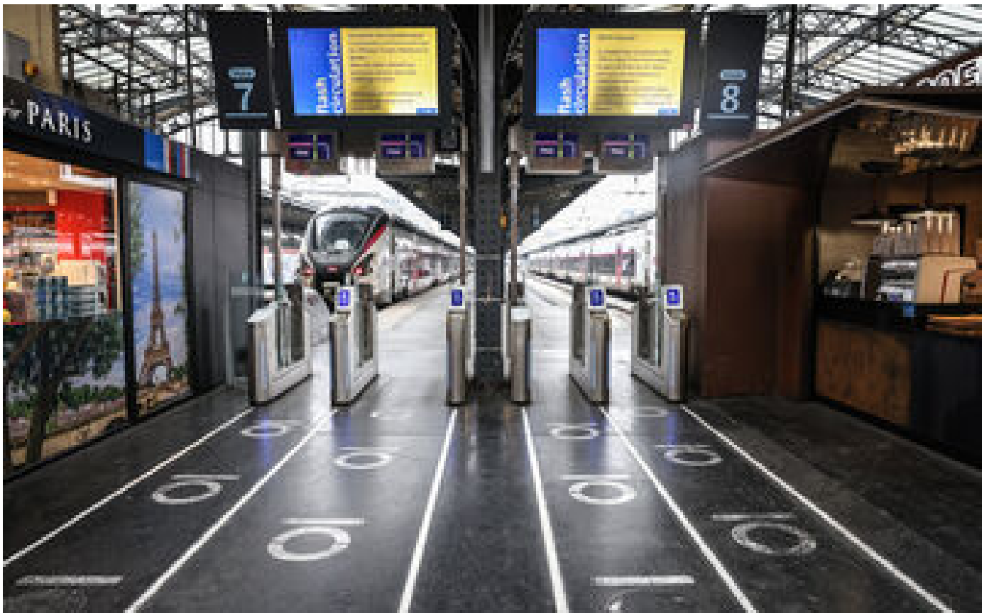
Panne à la gare de l'Est : réparations en cours, le trafic se rétablit plus vite que prévu