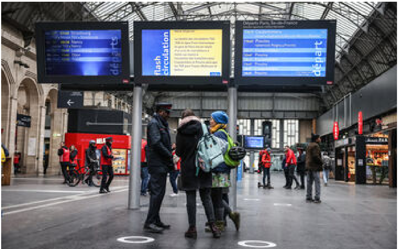
Gare de l'Est : la SNCF dénonce un «sabotage», le trafic «fortement perturbé» mercredi