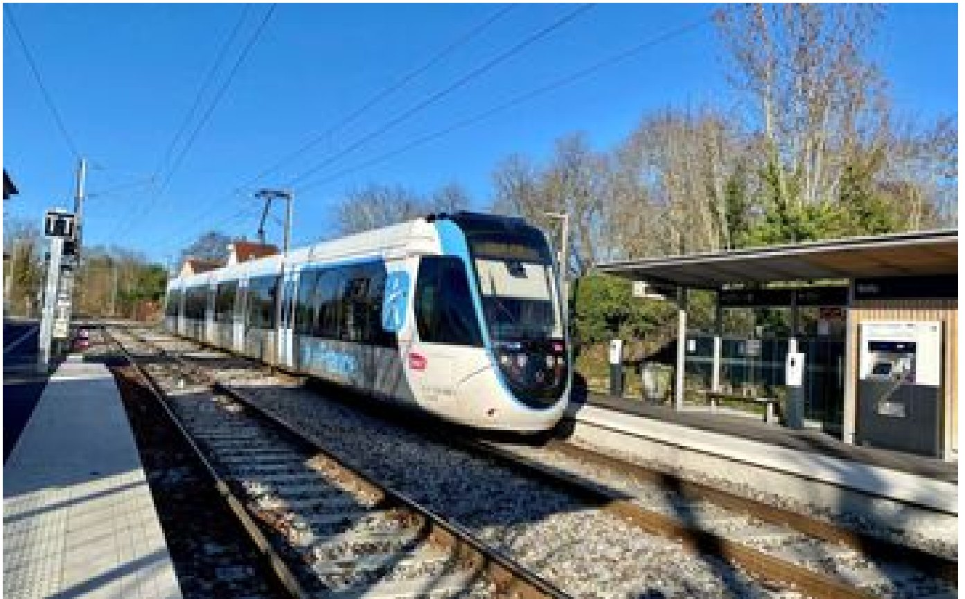
Abonnés Tramway T13 : de Saint-Germain à Poissy, Achères, Conflans et Cergy... le prolongement retardé