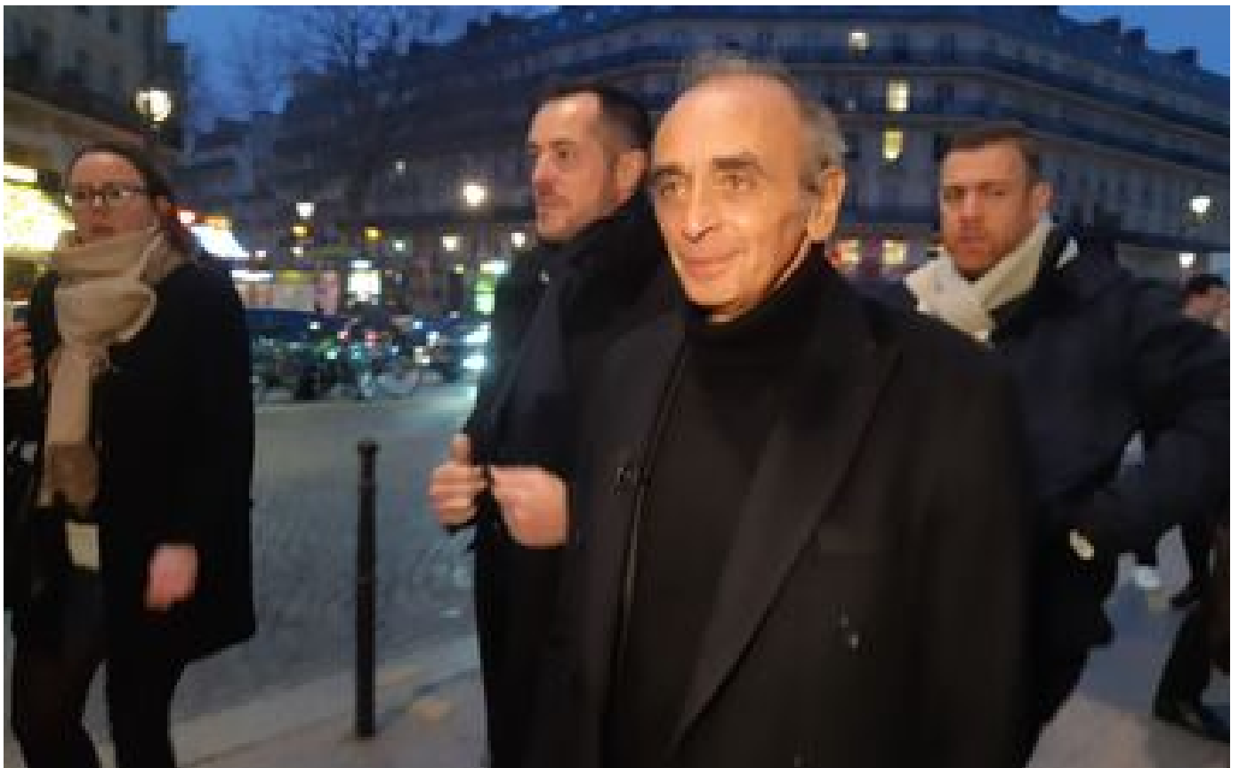
Eric Zeproust dénonce la violence dans les transports en Ile-de-France