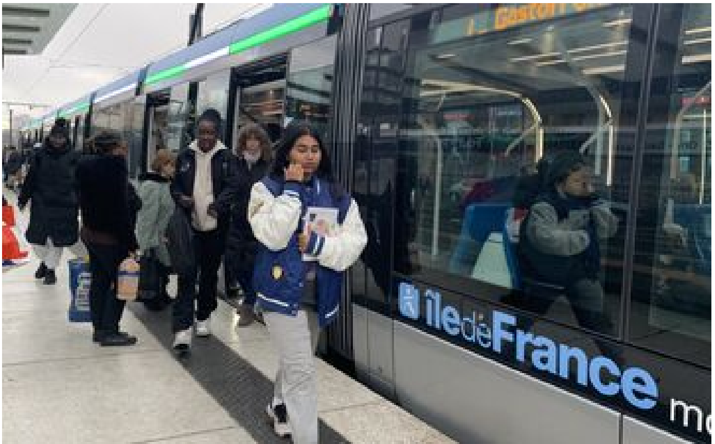
Abonnés Val-de-Marne : le tramway T9 cumule les retards faute de conducteurs, les usagers déçants