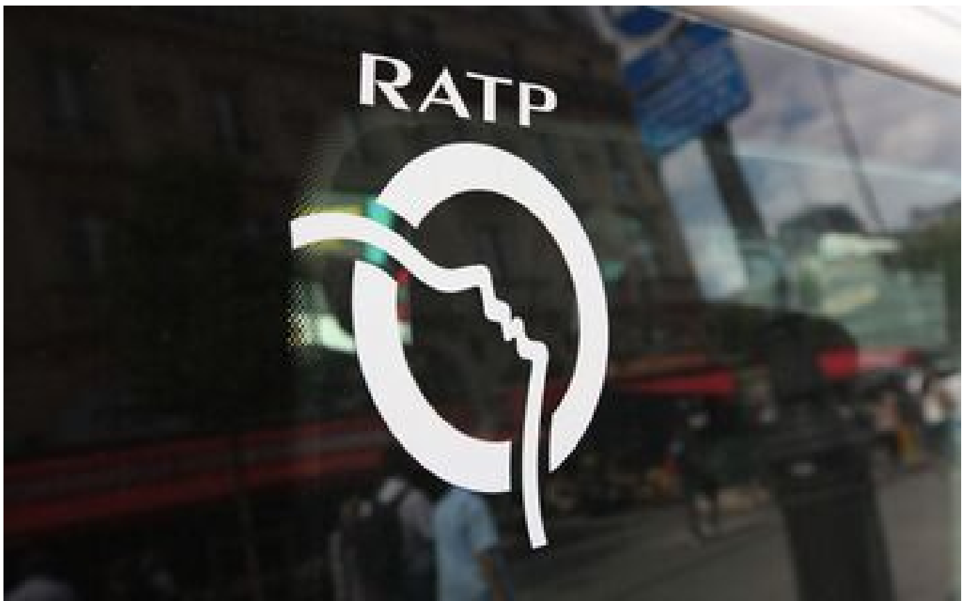
RATP : trois syndicats acceptent la proposition d'augmentation de salaires de la direction