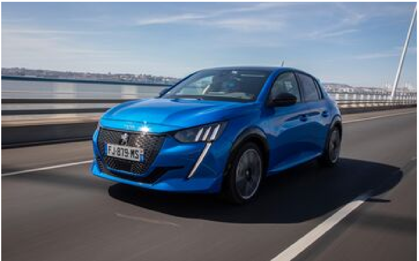
Abonnés Voiture : l'abonnement au mois, la nouvelle tendance flexible et sans engagement