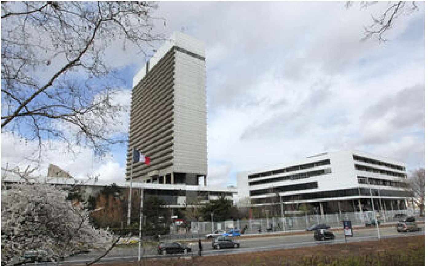
Abonnés À l'aube de son 50e anniversaire, la préfecture des Hauts-de-Seine prépare sa métamorphose