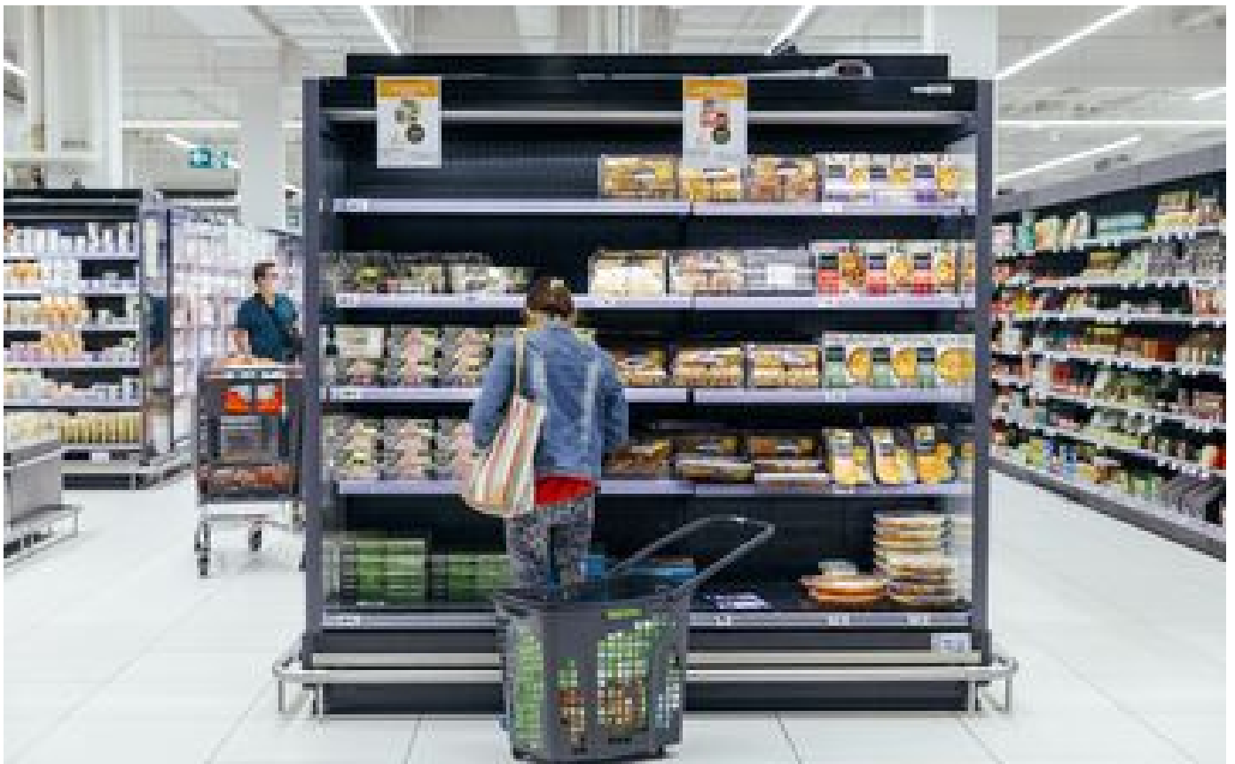
Abonnés Gagner de l'argent en faisant ses courses : Emrys, bon plan ou arnaque ?