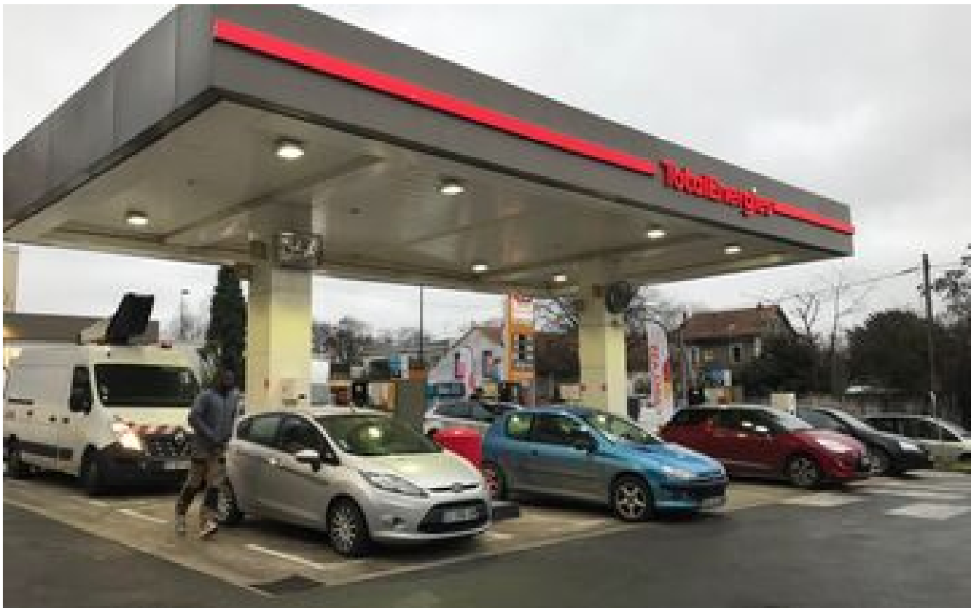
Les prix des carburants stables mais élevés