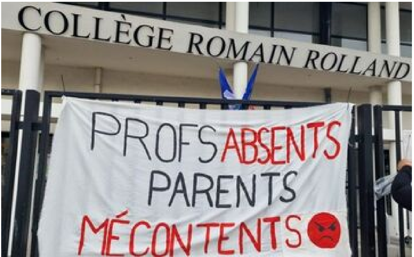
Abonnés Pénurie de profs : malgré les renforts, le casse-tête des remplacements persiste