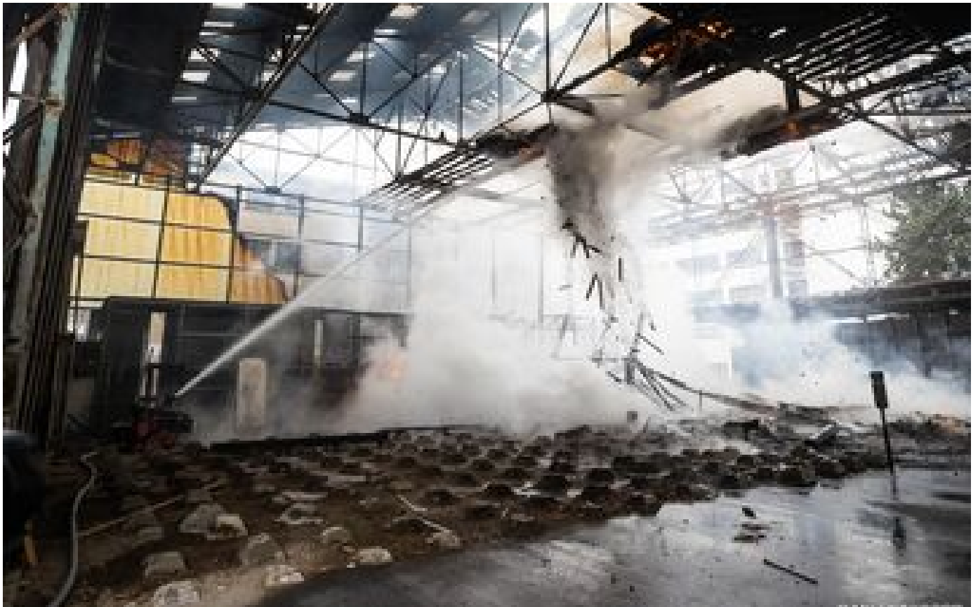
Nanterre : plus de 400 écoliers confinés suite à l'incendie d'un entrepôt de menuiserie