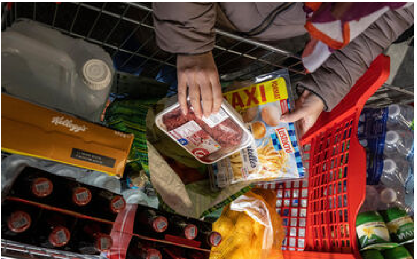
Abonnés Un panier anti-inflation : ce que le gouvernement veut demander à la grande distribution