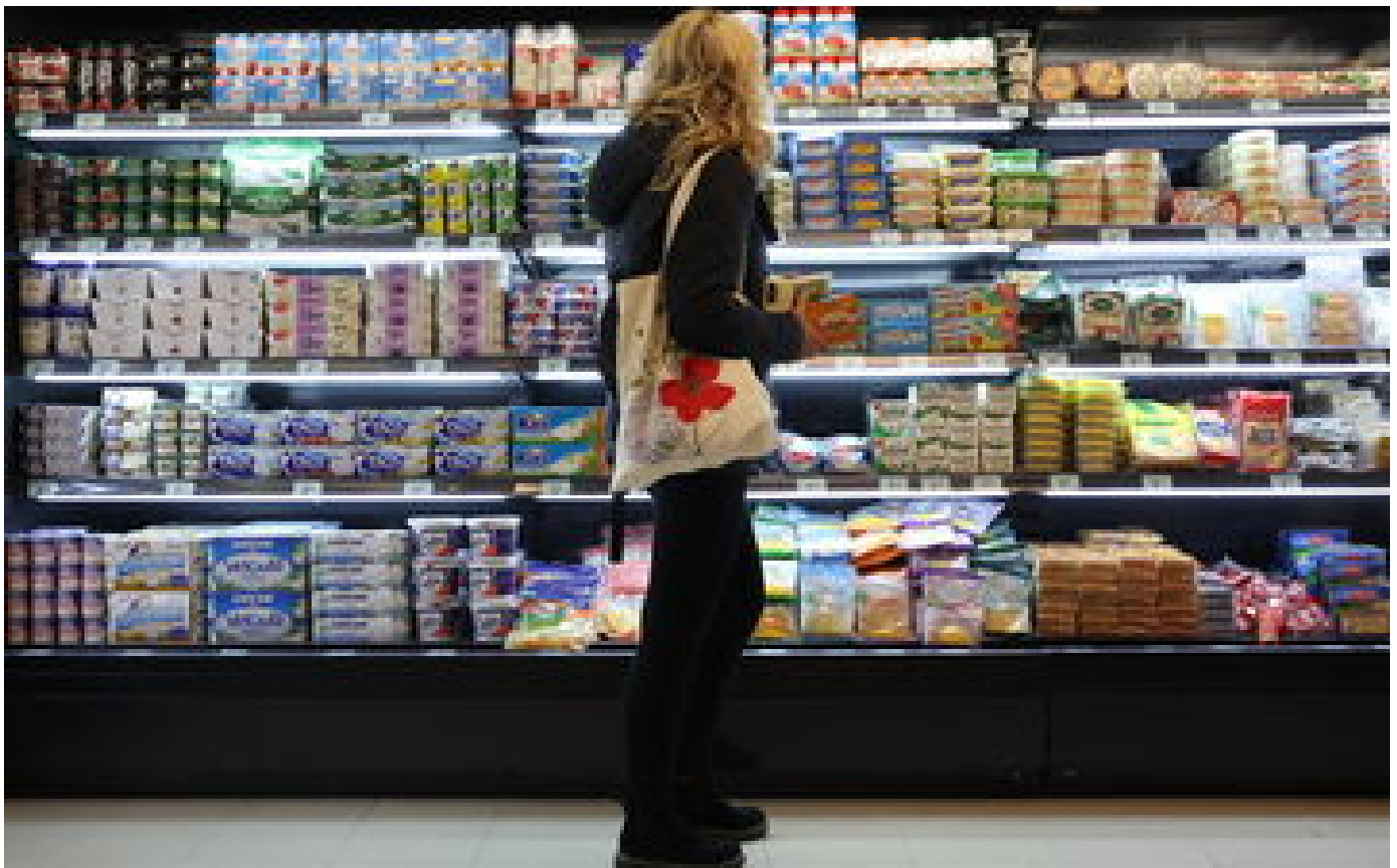
Loi sur les négociations commerciales : la grande distribution appelle les députés à la «responsabilité»