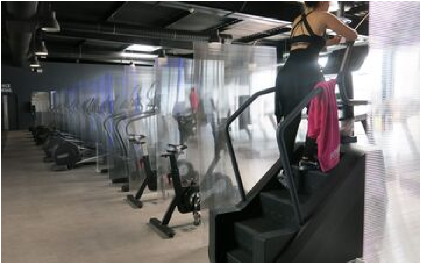
Abonnés Il avait volé de l'argent, des cartes bancaires, une arme... le pilleur des salles de sport part en prison