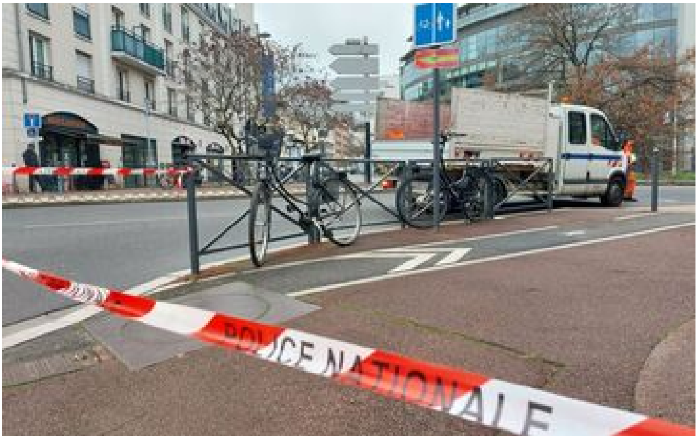
Abonnés Sécurité routière : le nombre de tués sur les routes des Hauts-de-Seine a baissé de 40% en 2022