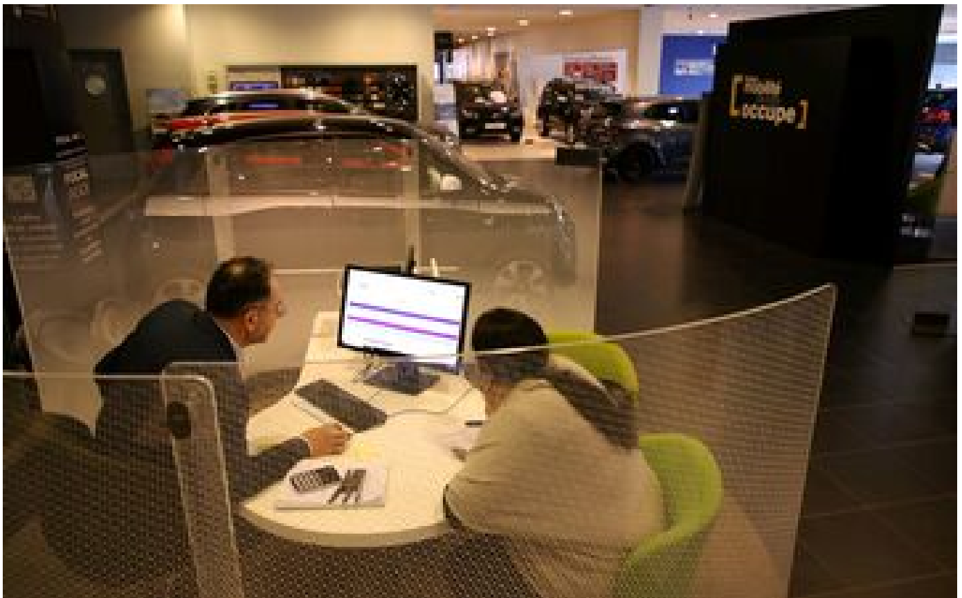
Abonnés Voiture : achat comptant, crédit auto, leasing... comment bien choisir son financement