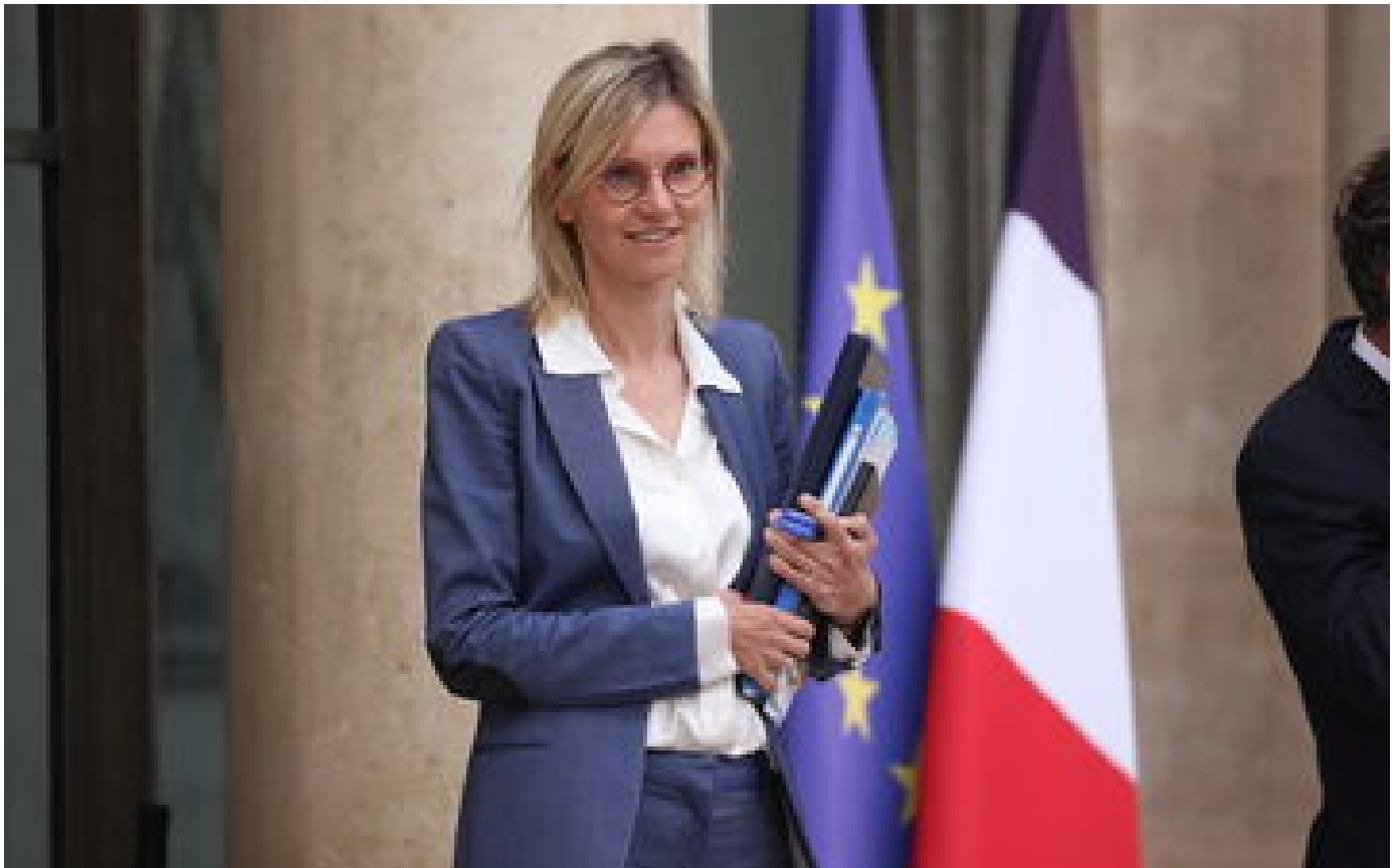
Électricité : la France peut passer l'hiver sans coupure, assure Pannier-Runacher