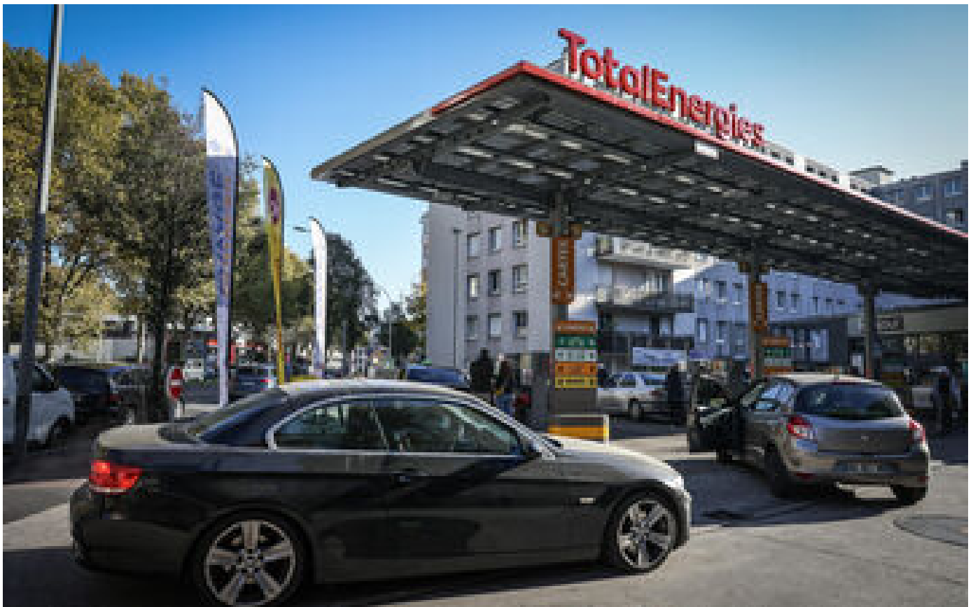
Indemnité carburant : comment demander la prime de 100 euros à partir de ce lundi