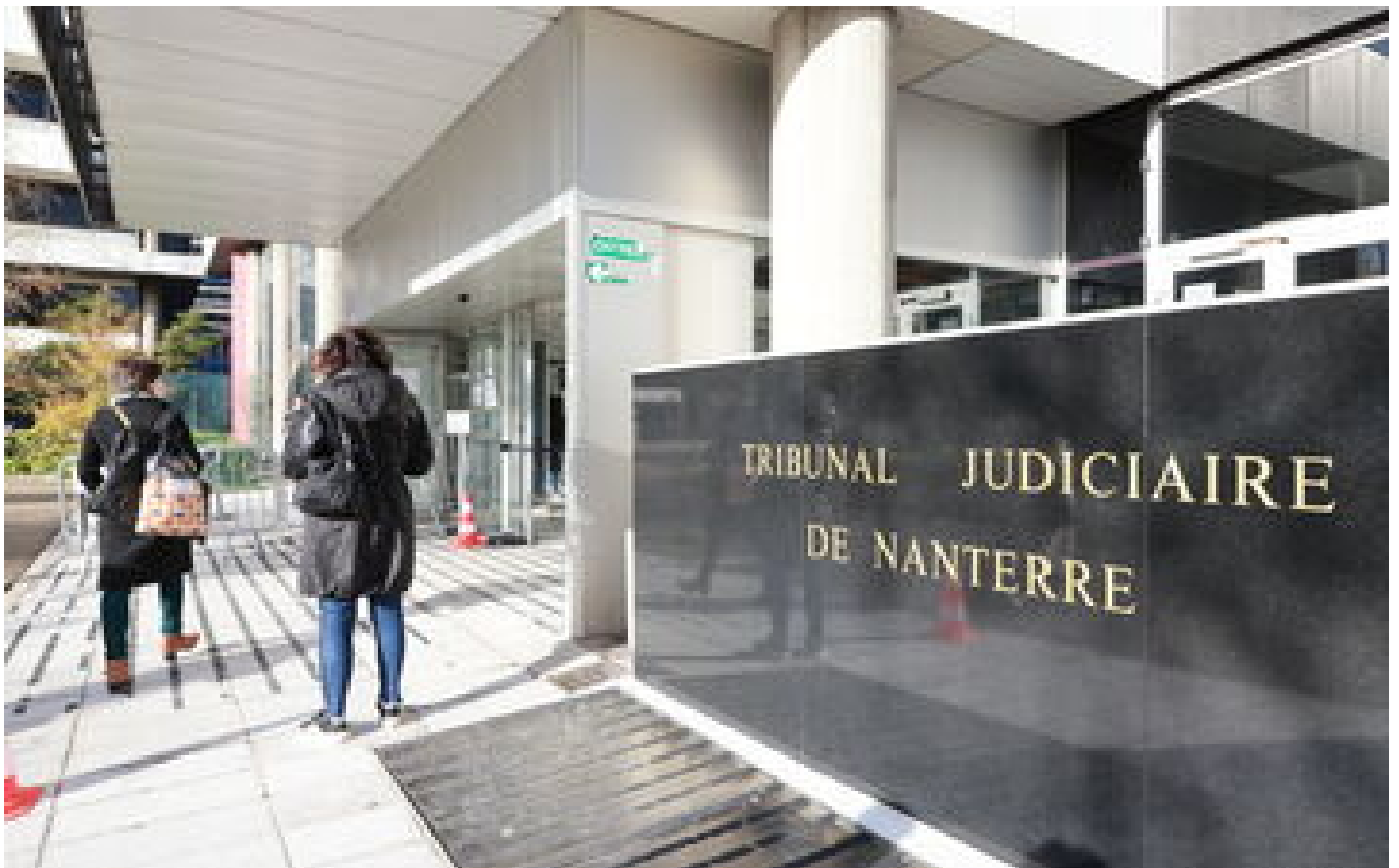
Abonnés «On ne sait pas qui est qui» : deux homonymes jugés à Nanterre pour une même escroquerie