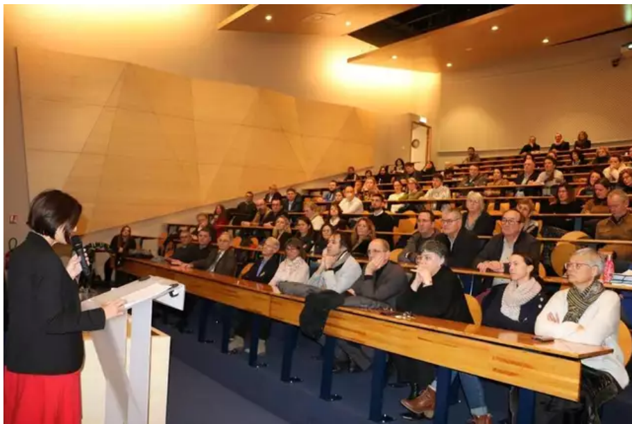
Lors de l'allocation de Virginie Dupont, la proutidante de l'UBS, mardi à Lorient.