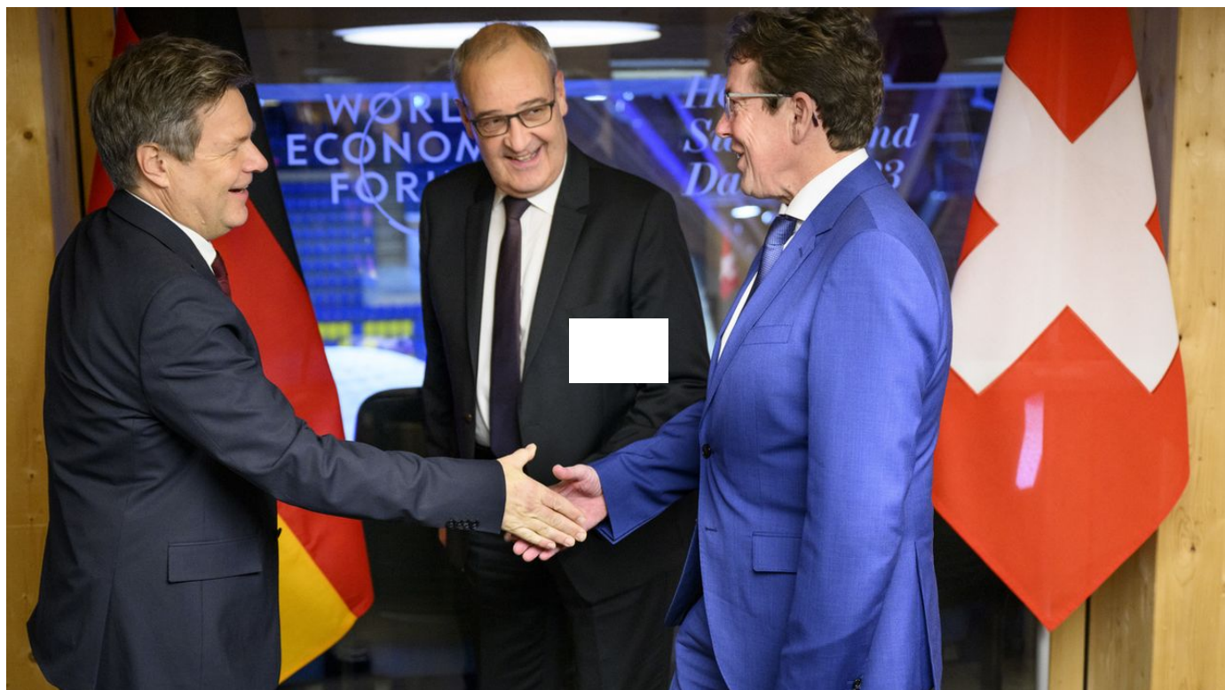
Un accord de solidarité sur le gaz entre la Suisse et l'Allemagne passera par un arrangement avec l'Italie / Le Journal horaire / 23 sec. / hier à 22:02

Un accord de solidarité sur le gaz entre la Suisse et l'Allemagne passera par un arrangement avec l'Italie. Berne a accepté lundi soir à Davos (GR) le scénario demandé par Berlin. Un dialogue avec Rome va être entamé.