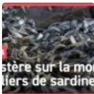
Des milliers de poissons retrouvés morts sur deux plages entre Saint-Nic et Plomodiern (29) ( https://www.breizh-info.com/2023/01/15/213739/sdes-milliers-de-poissons-retrouves-morts-sur-deux-plages-entre-saint-nic-et-plomodiern-29/ )

( https://www.breizh-info.com/2023/01/15/213746/analyse-de-taxi-driver-de-martin-scorsese/ )