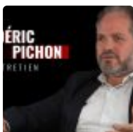
Syrie et Bachar : sortir du trou noir médiatique ( https://www.breizh-info.com/2023/01/15/213736/syrie-et-bachar-sortir-du-trou-noir-mediatique/ )

( https://www.breizh-info.com/2023/01/15/213739/sdes-milliers-de-poissons-retrouves-morts-sur-deux-plages-entre-saint-nic-et-plomodiern-29/ )