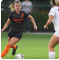
États-Unis. Après la folie Black Lives Matter, un retour à la raison ? ( https://www.breizh-info.com/2023/01/16/213633/black-lives-matter-hening/ )

( https://www.breizh-info.com/2023/01/16/213633/black-lives-matter-hening/ )