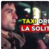
Analyse de Taxi Driver de Martin Scorsese ( https://www.breizh-info.com/2023/01/15/213746/analyse-de-taxi-driver-de-martin-scorsese/ )

( https://www.breizh-info.com/2023/01/16/213716/a-la-decouverte-des-saints-bretons-le-16-janvier-cest-la-saint-enored/ )