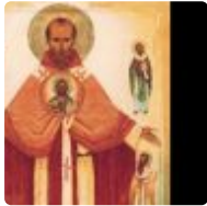
A la découverte des Saints Bretons. Le 16 janvier, c'est la Saint Enored ( https://www.breizh-info.com/2023/01/16/213716/a-la-decouverte-des-saints-bretons-le-16-janvier-cest-la-saint-enored/ )

( https://www.breizh-info.com/2023/01/16/213633/black-lives-matter-hening/ )