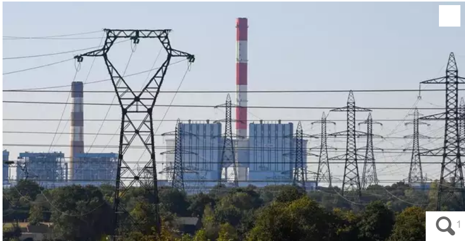
Les salariés de la centrale électrique de Cordemais ont voté la grève. Sans engagement de l'État pour le projet Écocombust d'ici au 12 janvier, ils arrêteront la production.

Les travaux d'une usine Écocombust sur le site de la centrale de Cordemais sont prêts à être lancés. Mais le feu vert de l'État tarde. Lassés, les syndicats ont déposé un préavis de grève à partir de ce jeudi 5 janvier.