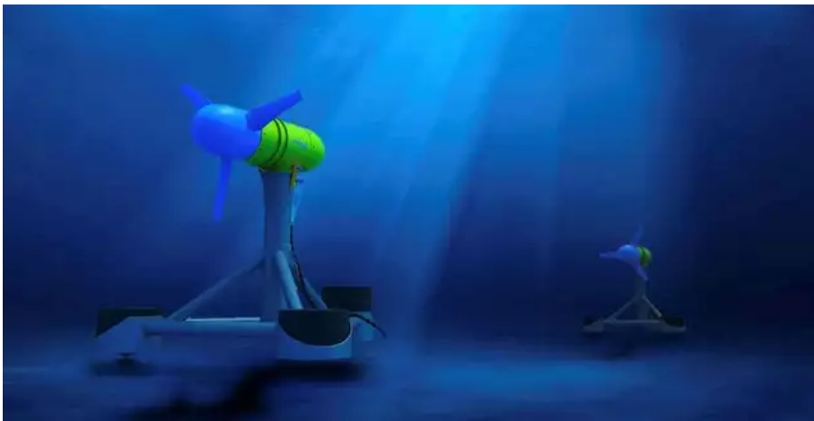
Deux hydroliennes de 14 mètres, fabriquées par la société Sabella, seront prochainement immergées à l'entrée du golfe du Morbihan.