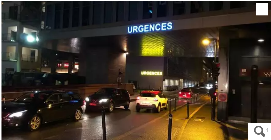
La situation des urgences du CHU est de plus en plus difficile. « Le système de santé public ne remplit plus son rôle et met en péril la santé des citoyens », estime un patient, dans une lettre adressée au directeur du CHU de Nantes.

Les urgences du CHU de Nantes, c'est connu, sont débordées. Et le personnel ne cesse de tirer la sonnette d'alarme. Des patients aussi. L'un d'eux a d'ailleurs écrit une lettre ouverte au directeur du CHU. Il témoigne de son expérience.