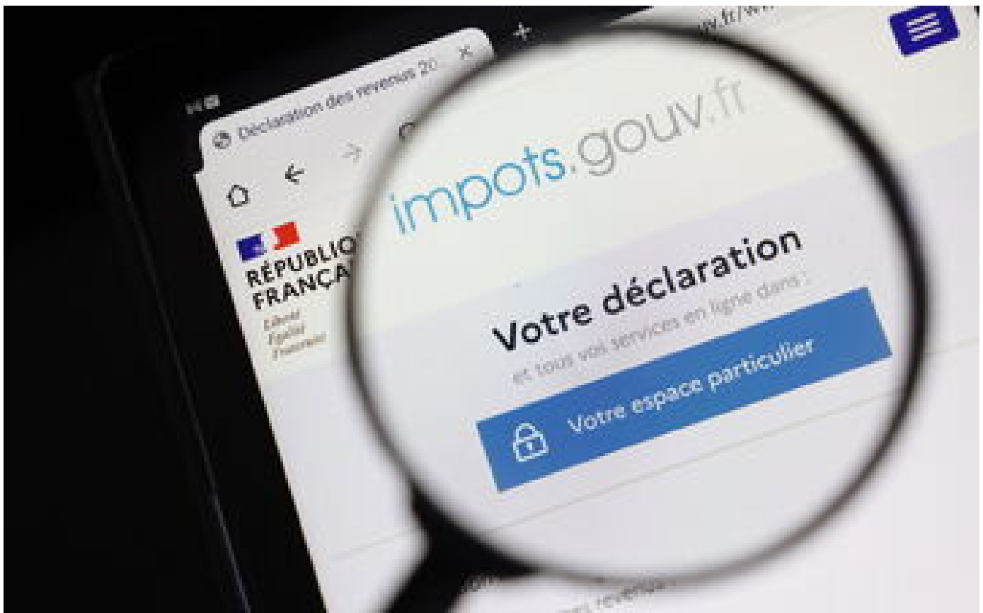
Abonnés Impôts : taxe d'habitation, barème... tout ce qui va changer en 2023