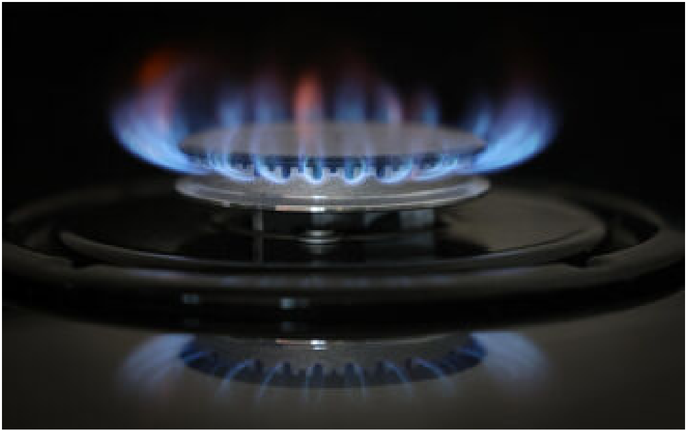
Gaz européen : le prix de gros a été divisé par cinq depuis le mois d'août