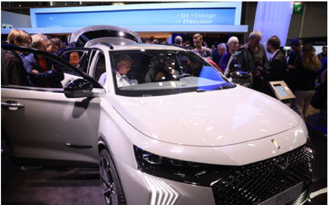
Automobile : 2022, une nouvelle année noire pour le marché français