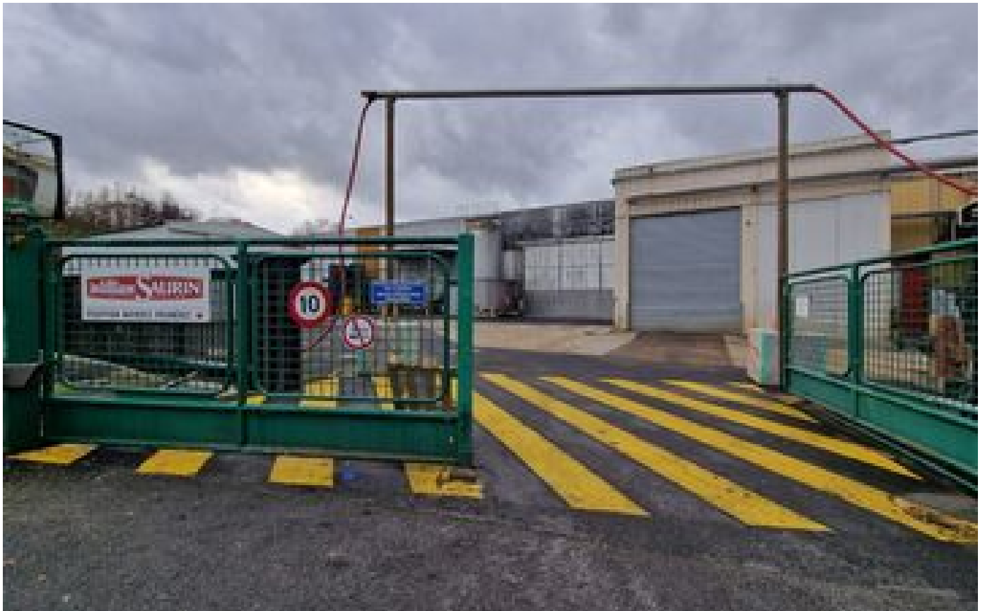
Prix de l'énergie : Cofigeo met 800 salariés au chômage technique