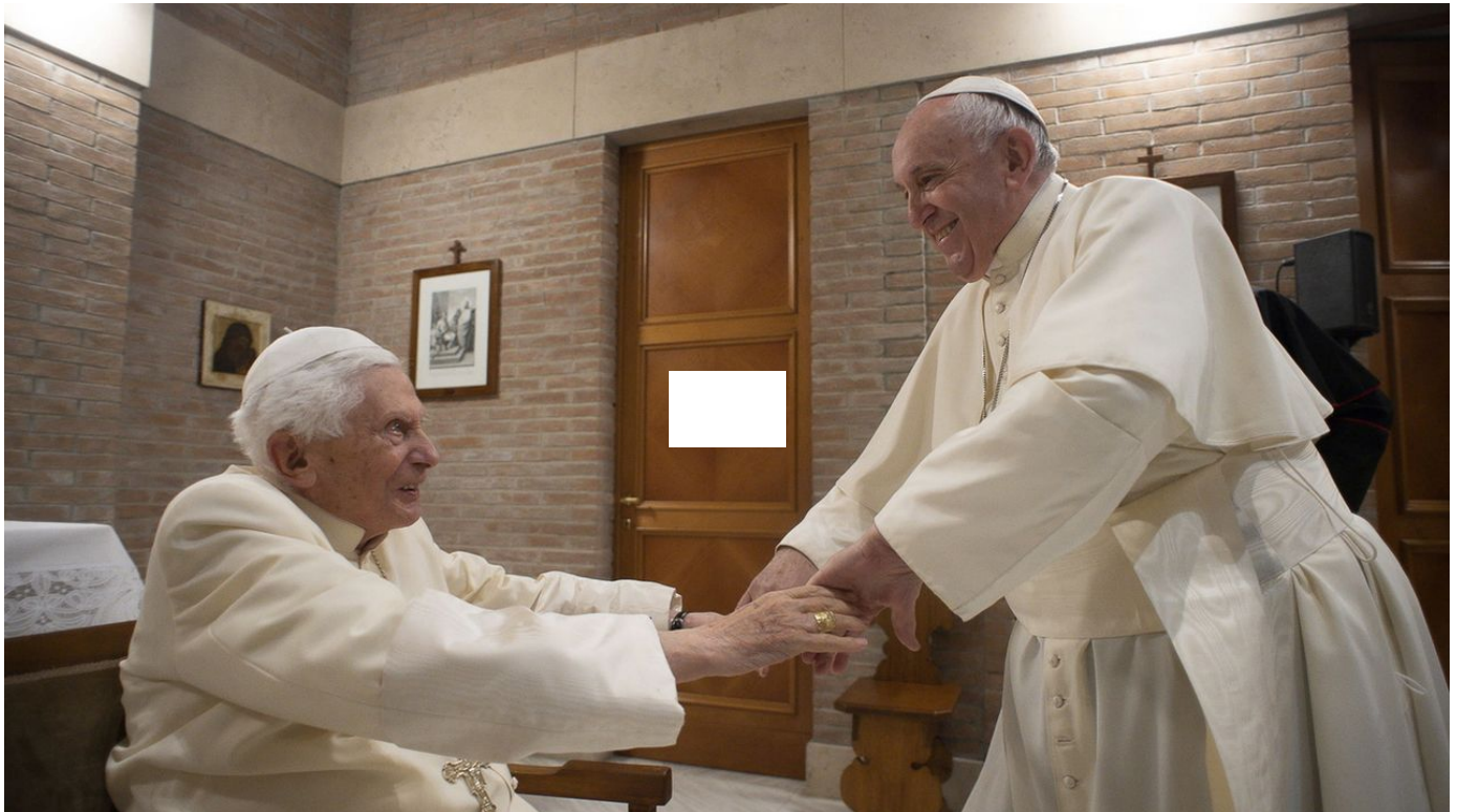
Le pape annonce que Benoît XVI est "gravement malade" et prie pour lui / Le Journal horaire / 10 sec. / aujourd'hui à 11:02

Le pape François a annoncé mercredi que son prédécesseur Benoît XVI, âgé de 95 ans, était "gravement malade" et qu'il priait pour lui. L'Allemand avait surpris le monde entier en 2013 en annonçant sa renonciation pour des raisons de santé.