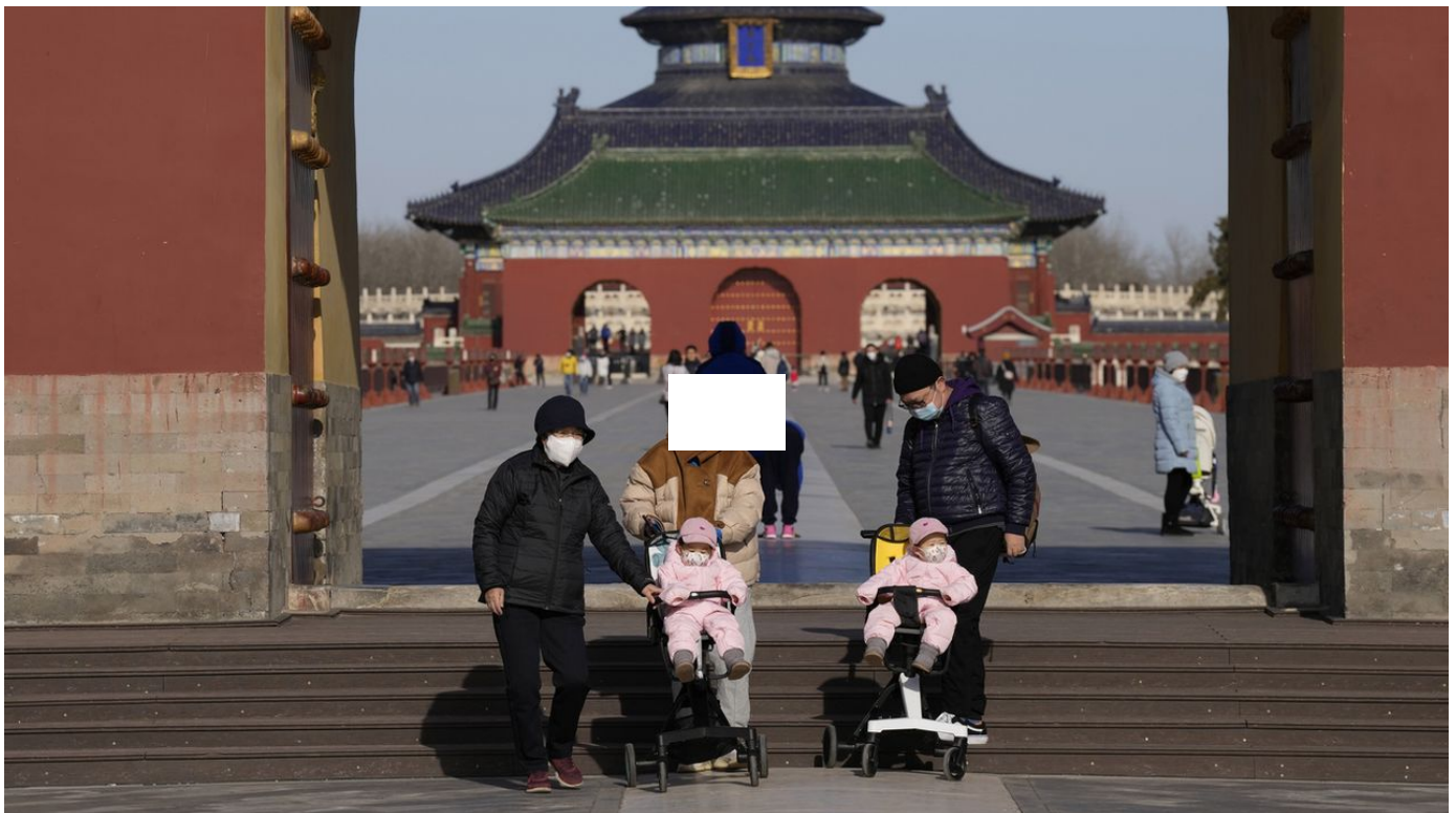
En Chine, la commission de la Santé cesse de publier les chiffres du Covid / Le Journal horaire / 31 sec. / aujourd'hui à 10:02

La commission nationale chinoise de la Santé, laquelle fait office de ministère, a annoncé dimanche qu'elle ne publierait plus les chiffres quotidiens des cas et décès du Covid, comme elle le faisait depuis début 2020.