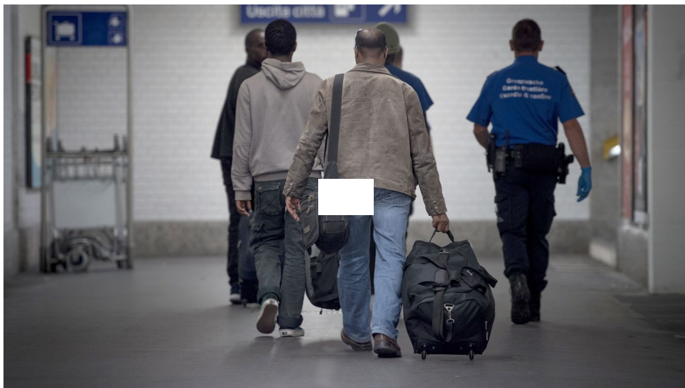
La Suisse ne peut pas renvoyer 184 réfugiés vers l'Italie / Le Journal horaire / 34 sec. / aujourd'hui à 10:03

L'Italie ne reprend pour l'instant plus les réfugiés dits Dublin en raison du grand nombre de nouveaux migrants arrivant par la mer. Par conséquent, la Suisse ne peut pas expulser 184 personnes vers l'Italie. La pression sur les centres d'hébergement augmente.