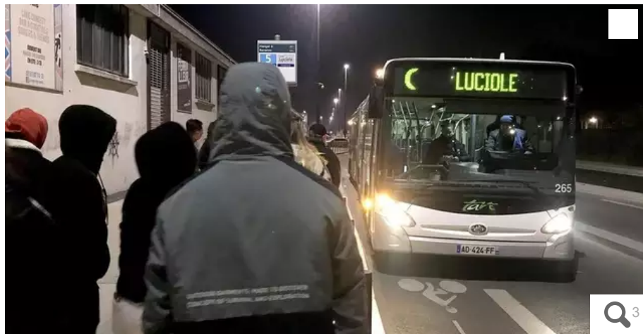
Luciole, le bus nocturne, part le jeudi à 4 h du Hangar à bananes, direction Chantrerie, au nord-est de Nantes. Le samedi, trois circuits différents (avec trois départs chacun) sont proposés aux fêtards, entre 2 h 45 et 4 h 45.

Nantes la nuit. En sortant des bars ou de la discothèque, au Hangar à bananes, la nuit du 8 au 9 décembre, ces étudiants filent au lit grâce à Luciole, le dernier bus nocturne, à 4 h. Ils croisent des travailleurs de l'ombre, discrets et chaudement vêtus, dans le premier tram de la ligne 1, départ 4 h 44, de la Beaujoire.