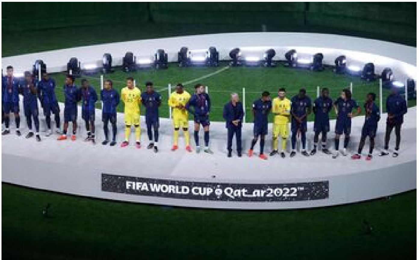
La France battue en finale : pas de fête pour les Bleus à leur retour à Paris