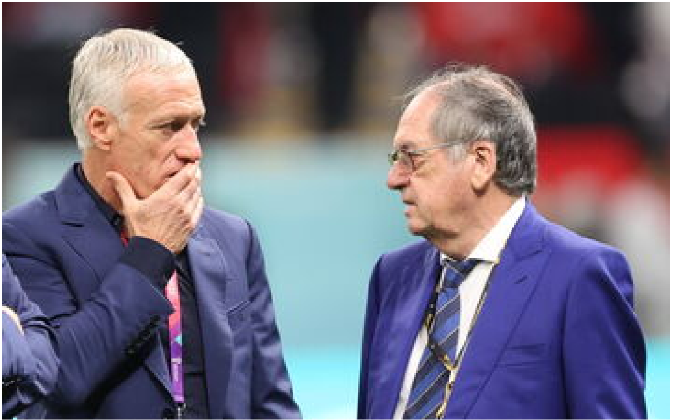
Abonnés Noël Le Graët : «On ne peut pas être triste après un tel match»