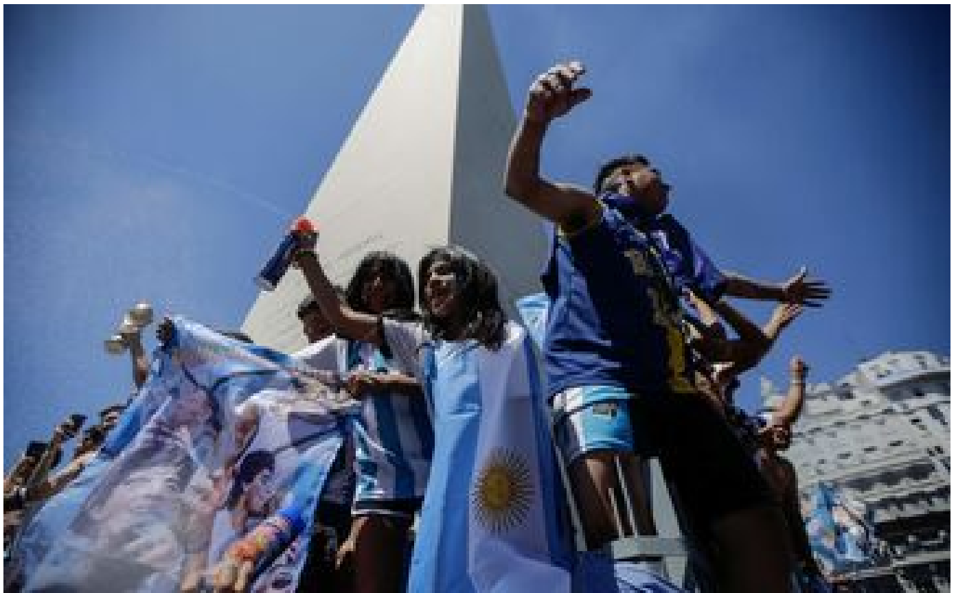
«Cette victoire, c'est un cri qu'on a longtemps gardé en nous» : à Buenos Aires, la délivrance des Argentins