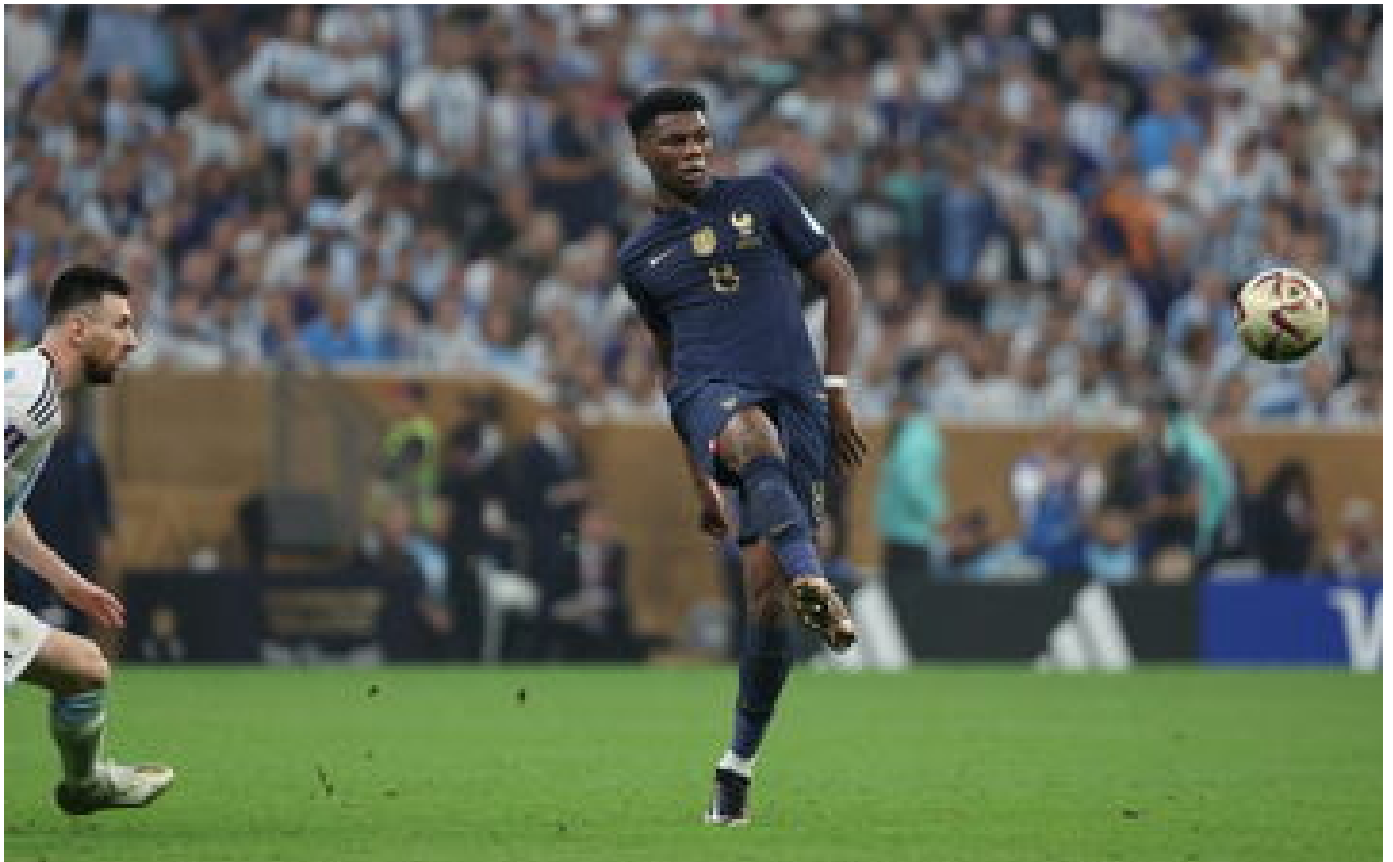
Abonnés Maxime Bossis sur la défaite des Bleus : «L'Argentine mérite globalement de l'emporter»