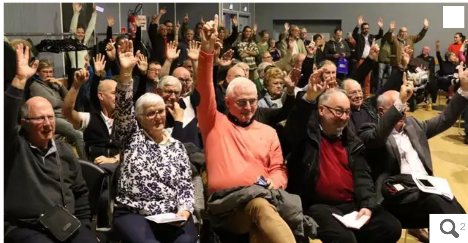
Lors du vote à l'assemblée générale le 26 novembre.