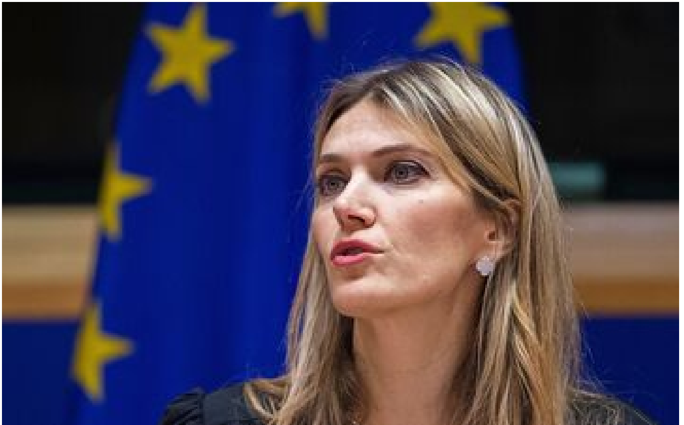
Parlement européen : accusée de corruption, Eva Kaili reste écrouée, son audience reportée au 22 décembre