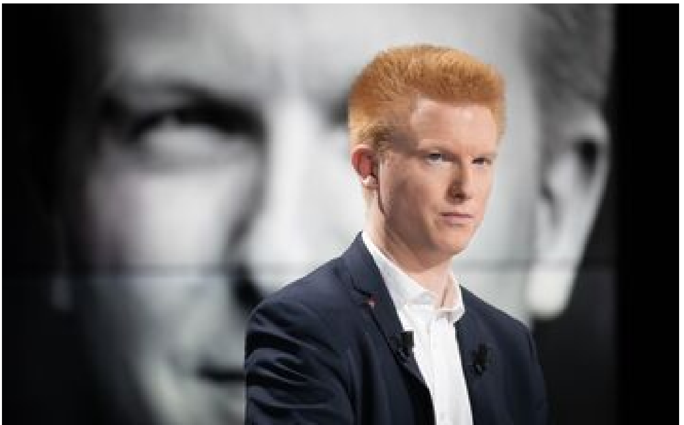
Affaire Quatennens : pourquoi sa charge contre Beauvau n'est pas dans la version papier de La Voix du Nord