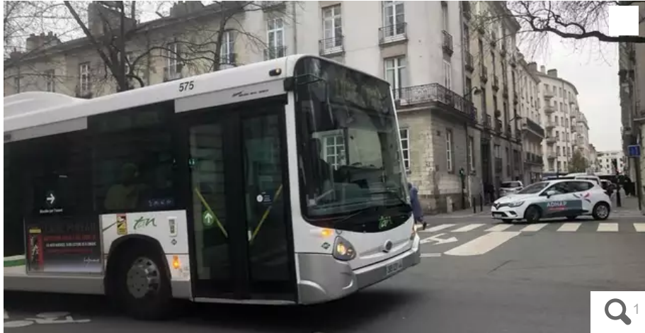
Le bus 54, qui passe boulevard Guist'hau, va devenir un Chronobus.

Les élus métropolitains vont voter, vendredi 16 décembre, plusieurs améliorations de la performance et du maillage du réseau de bus de la Semitan. Dont la transformation de la ligne 54 en Chronobus.