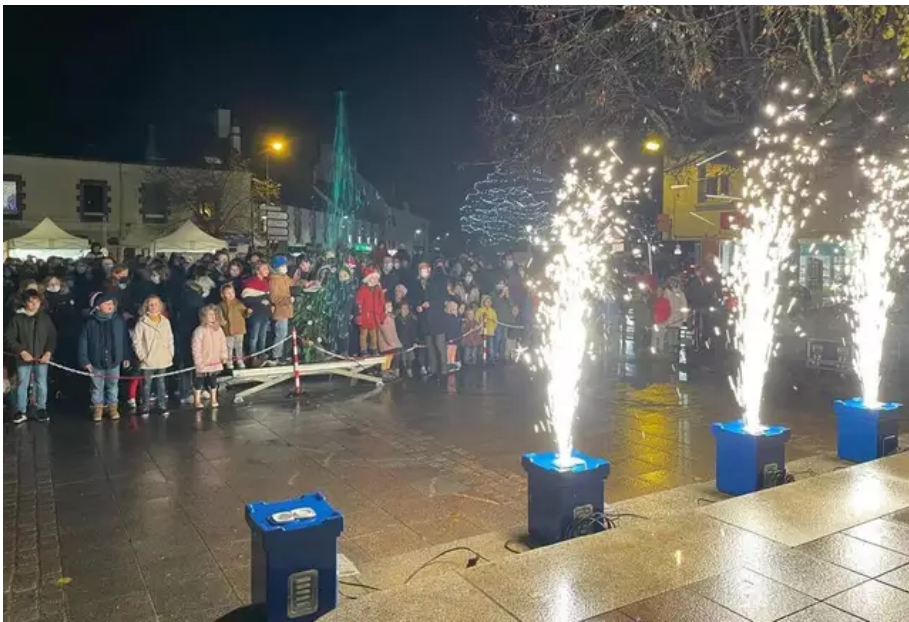
Plœmeur a décidé de réduire à trois semaines ses illuminations de Noël (du 9 décembre au 6 janvier).