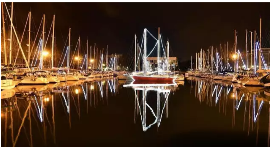
Alors que la Sellor ne renouvellera pas son opération dans le bassin à flot de Lorient, les plaisanciers du port de Sainte-Catherine à Locmiquélic sont invités à parer leur bateau de guirlandes. ?

Diminution des jours d'illumination, aussi, à Gâvres , à Pont-Scorff ainsi qu'à Caudan , ce qui va permettre de «diviser par deux la facture énergétique».