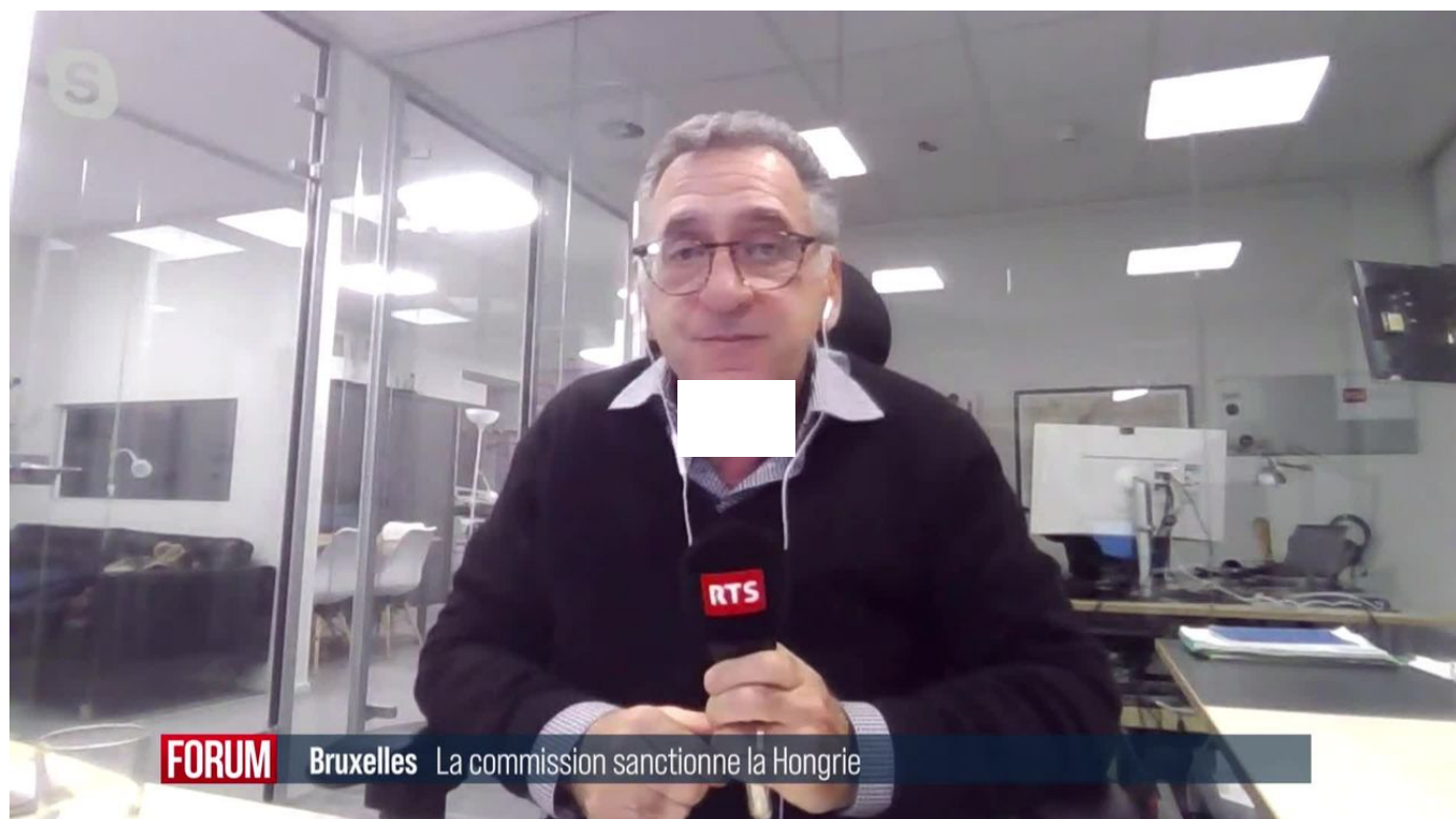
La Commission européenne recommande le gel des aides destinées à la Hongrie / Forum / 2 min. / hier à 19:46

Les réformes engagées par Viktor Orbán n'auront pas suffi: la Commission européenne a recommandé mercredi le gel de plus de 13 milliards d'euros (12,8 milliards de francs) de fonds européens destinés à la Hongrie, en réponse à des problèmes de corruption.