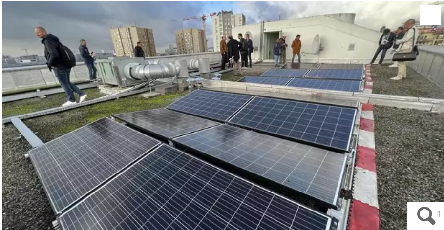
Réduire sa dépendance aux marchés financiers, c'est réduire ses besoins et donc produire sa propre énergie. C'est le cap fixé par Nantes métropole, en pleine transition vers les énergies renouvelables.

Les achats groupés ont permis aux communes de l'agglomération de faire face, pour le moment, à la crise énergétique. Le prochain contrat de gaz doit être renouvelé le 1er janvier 2024.