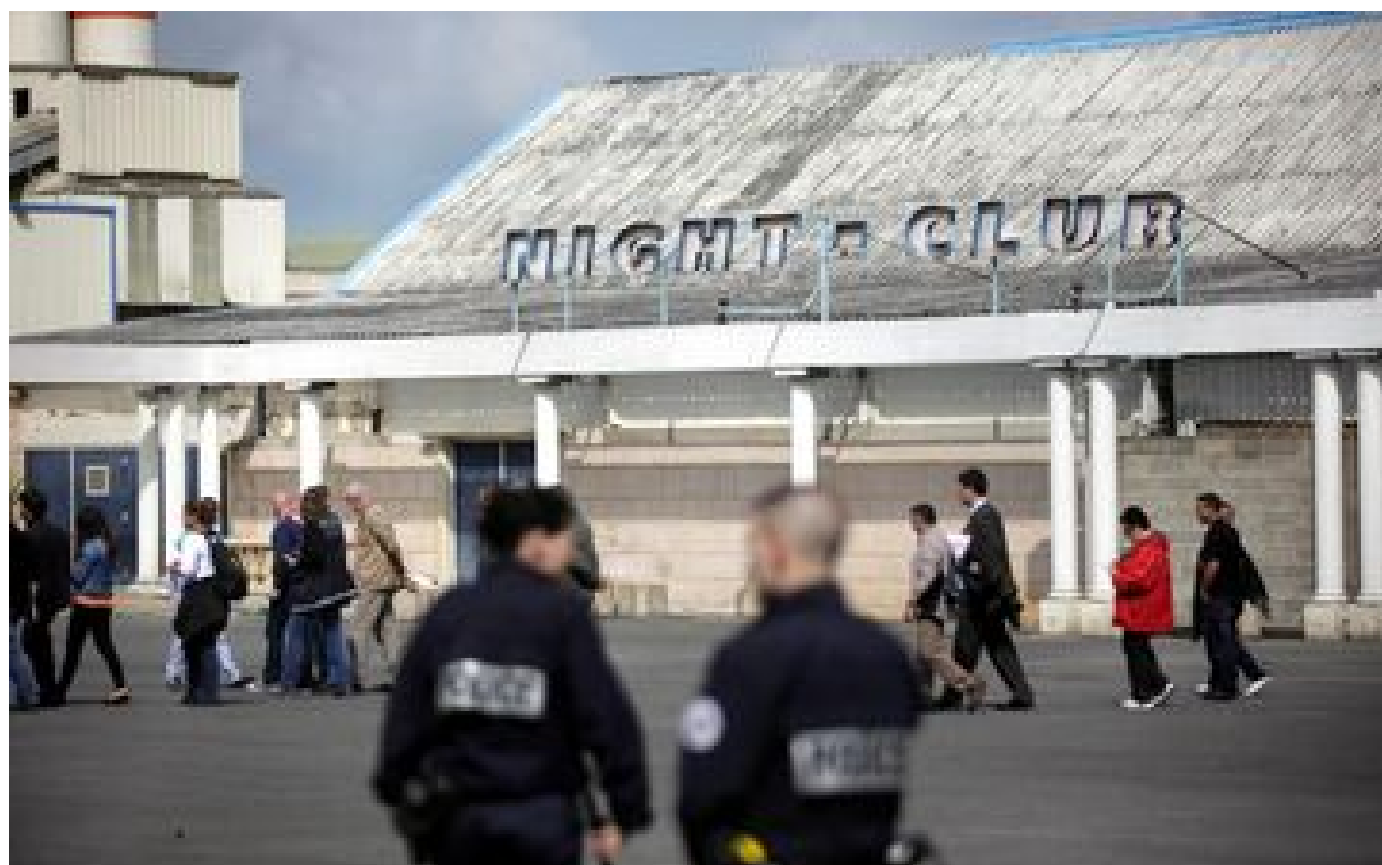
Abonnés Affaire du Calypso : l'attente désespérée des grands-parents d'Arnaud, mort après une soirée en boîte de nuit