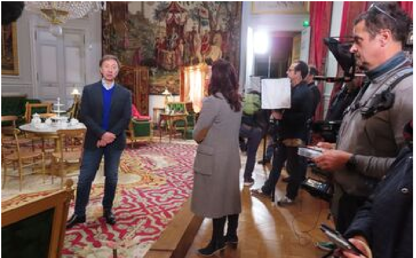
Abonnés «Secrets d'histoire» : Stéphane Bern sur les traces de Napoléon III au château de Compiègne