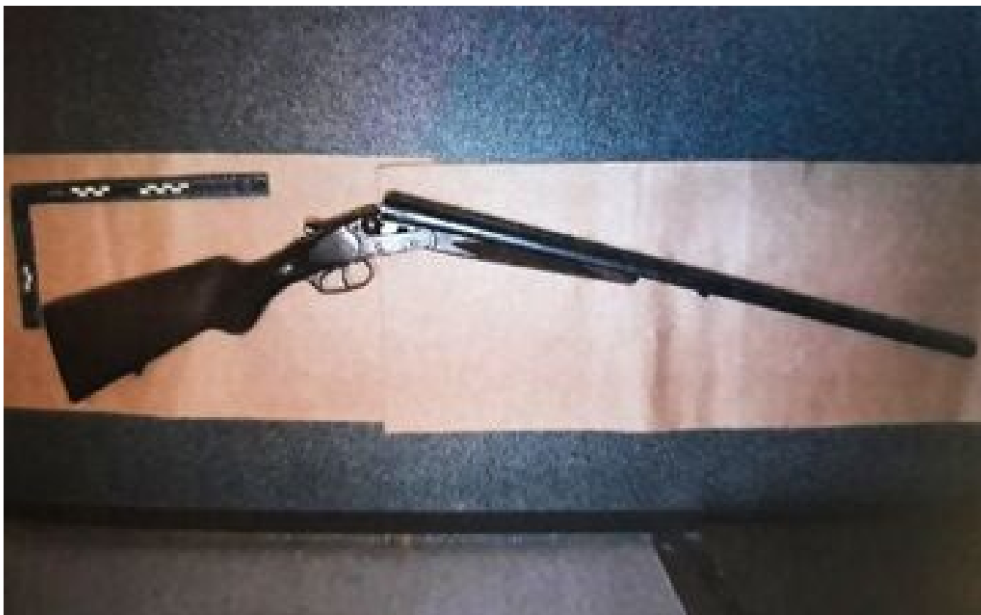
Abonnés Dans l'Oise, il avait tiré à travers la porte, blessant ses voisins : «Ils n'arrêtent pas de m'embêter»