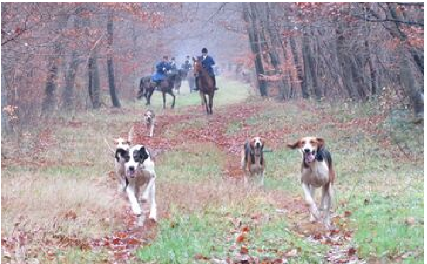
Abonnés Fouet contre bombe lacrymogène : dans l'Oise, les violences entre chasseurs et opposants montent d'un cran