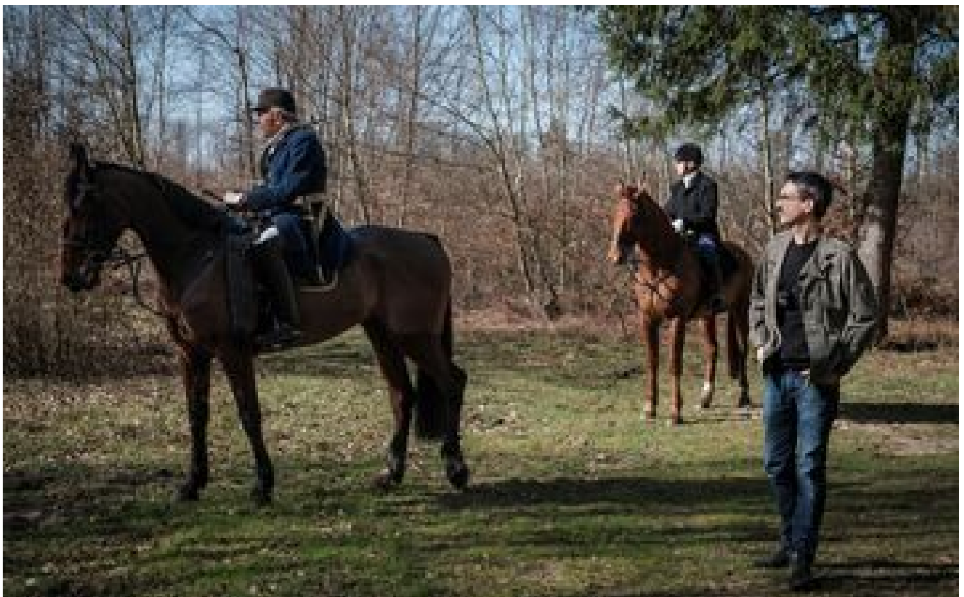
Chasse à courre dans l'Oise : un veneur condamné pour avoir percuté une anti-chasse avec son cheval