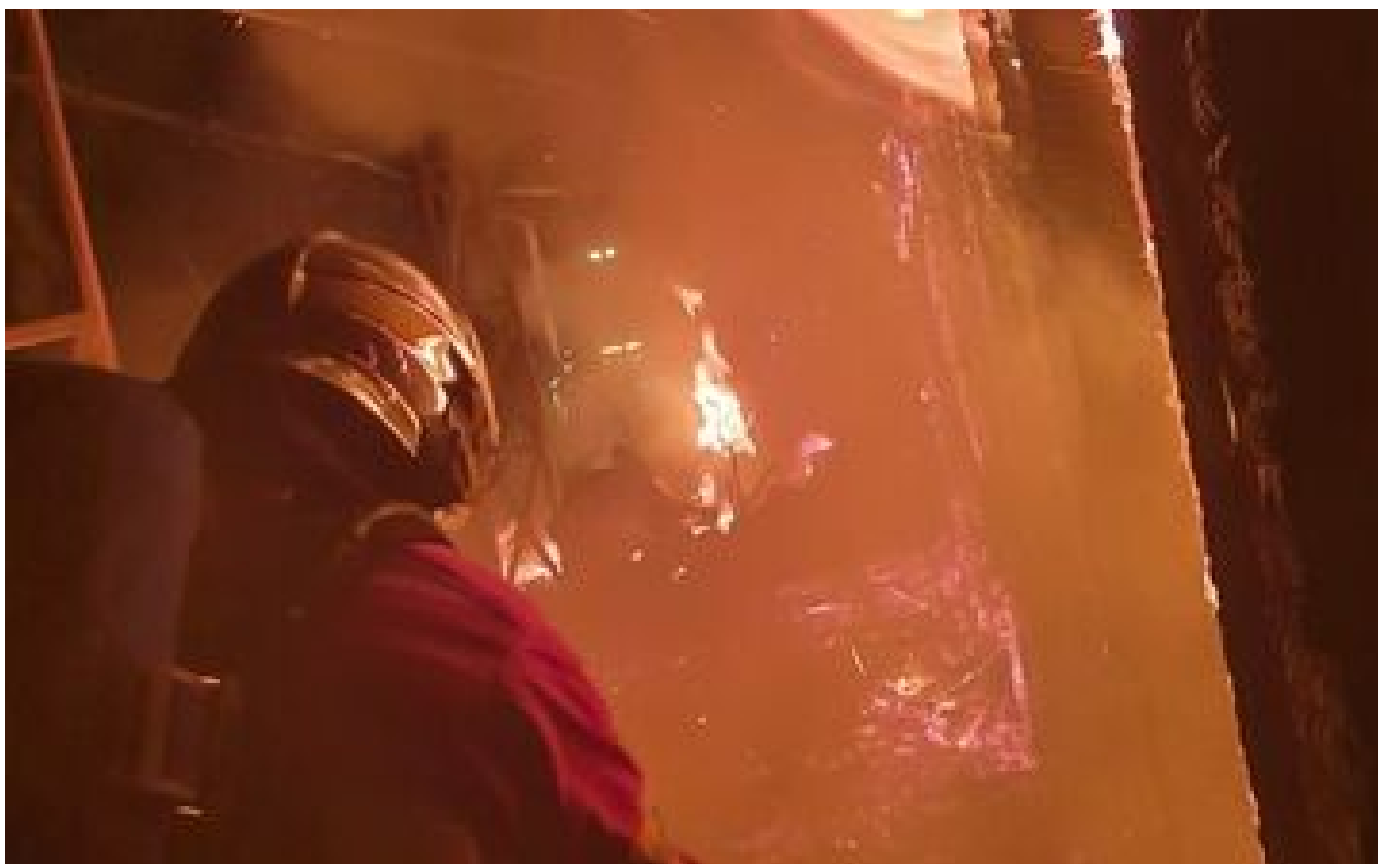
Voitures brûlées et incendie du restaurant du stade équestre à Compiègne : 3 ans de prison