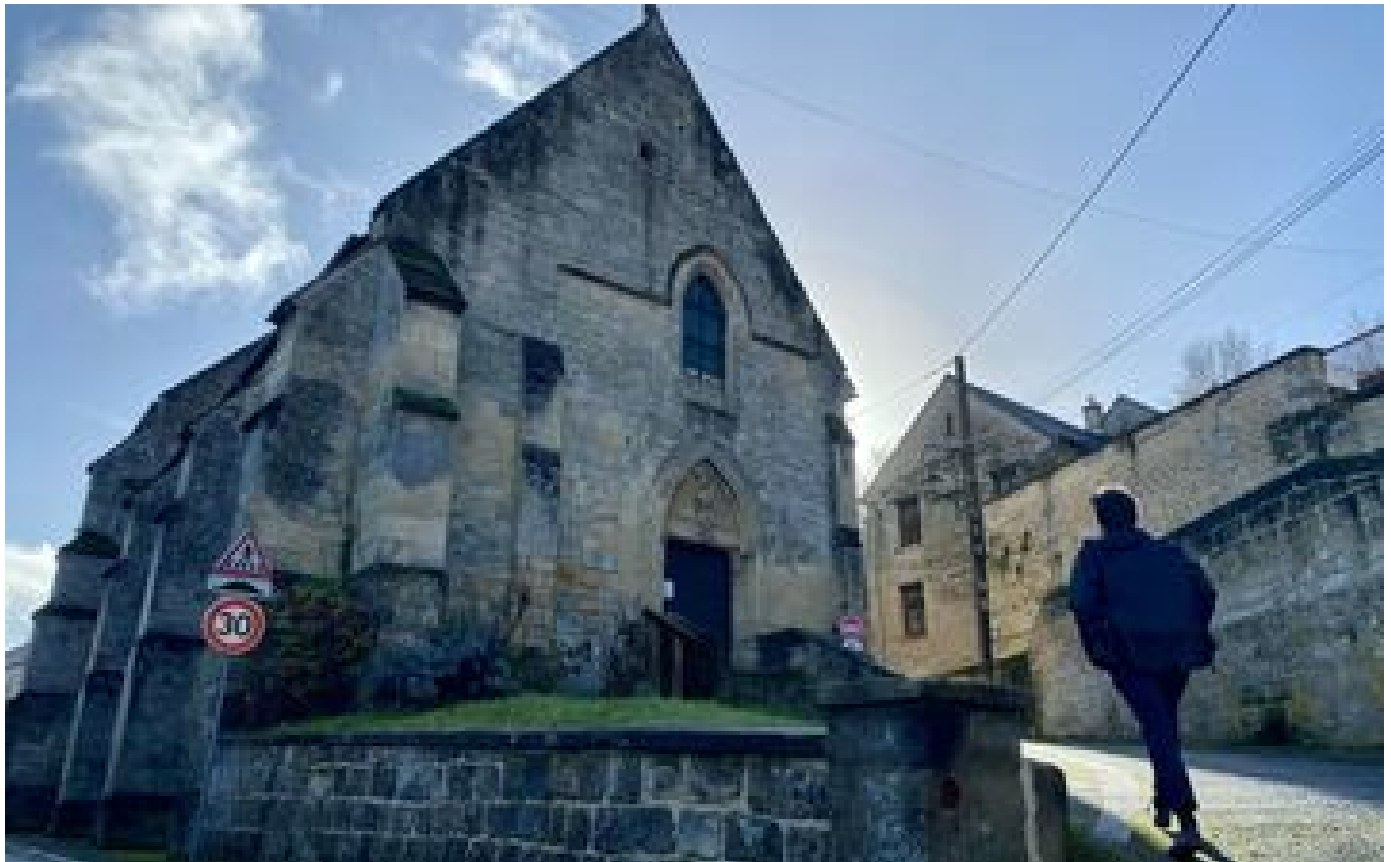
Abonnés Six fois moins de prêtres qu'en 1965 : dans l'Oise, c'est la fin du curé de campagne