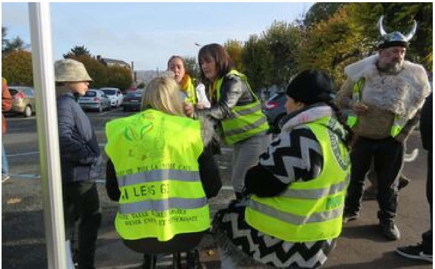
« La vie chère, c'est la vraie violence » : des Gilets jaunes de l'Oise et d'ailleurs ont renfilé la chasuble à Noyon