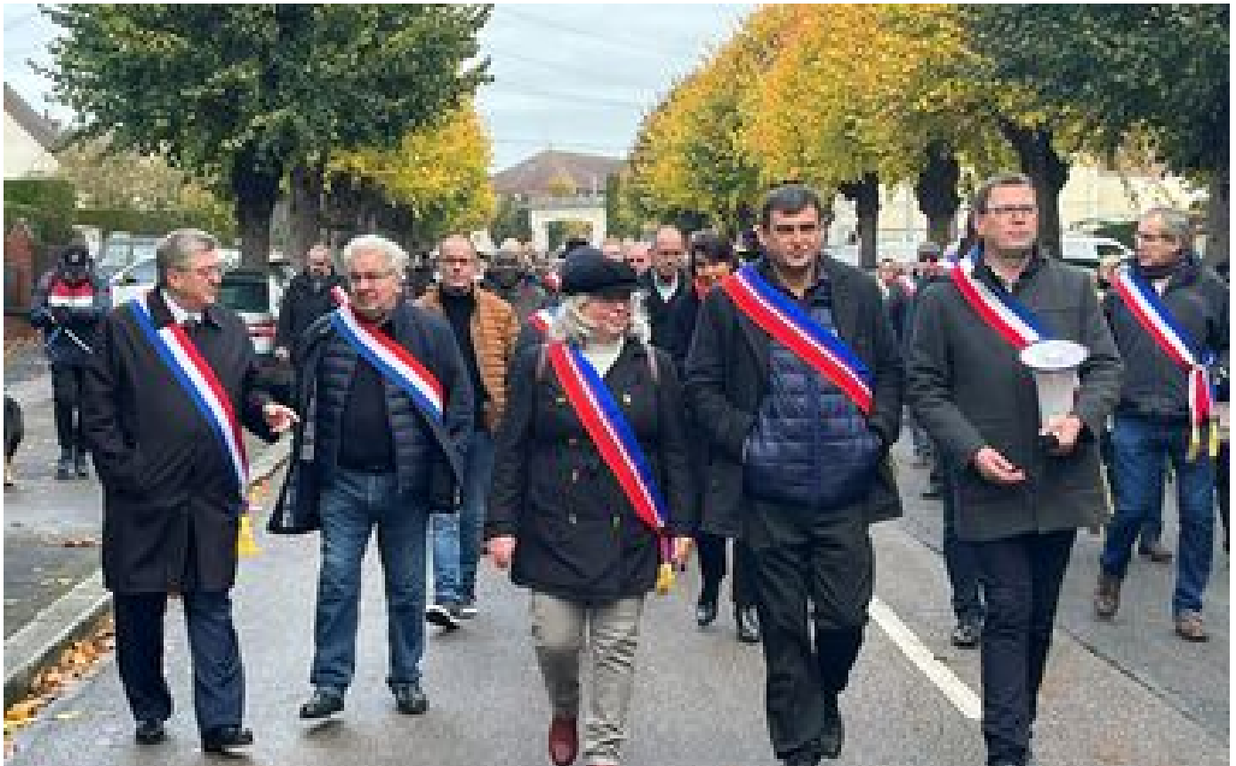
Abonnés À Noyon, élus et habitants disent non au Smur sans médecin