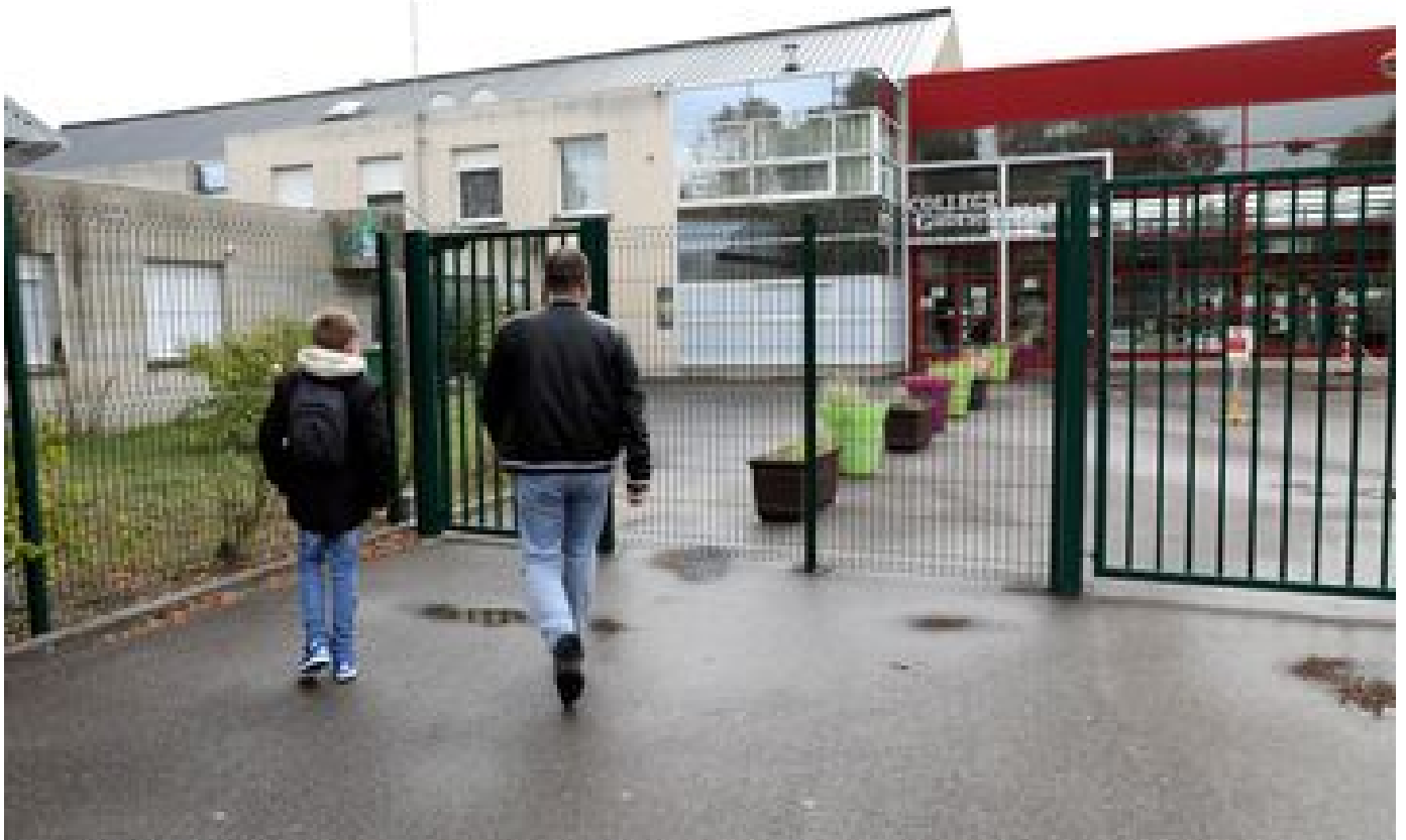
Abonnés Mixité sociale : dans l'Oise, le très net choix du privé pour les collégiens les plus favorisés