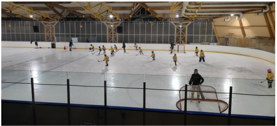
Compiègne, ce mercredi. Le Hockey Club de Compiègne compte 250 licenciés, dont 160 enfants.