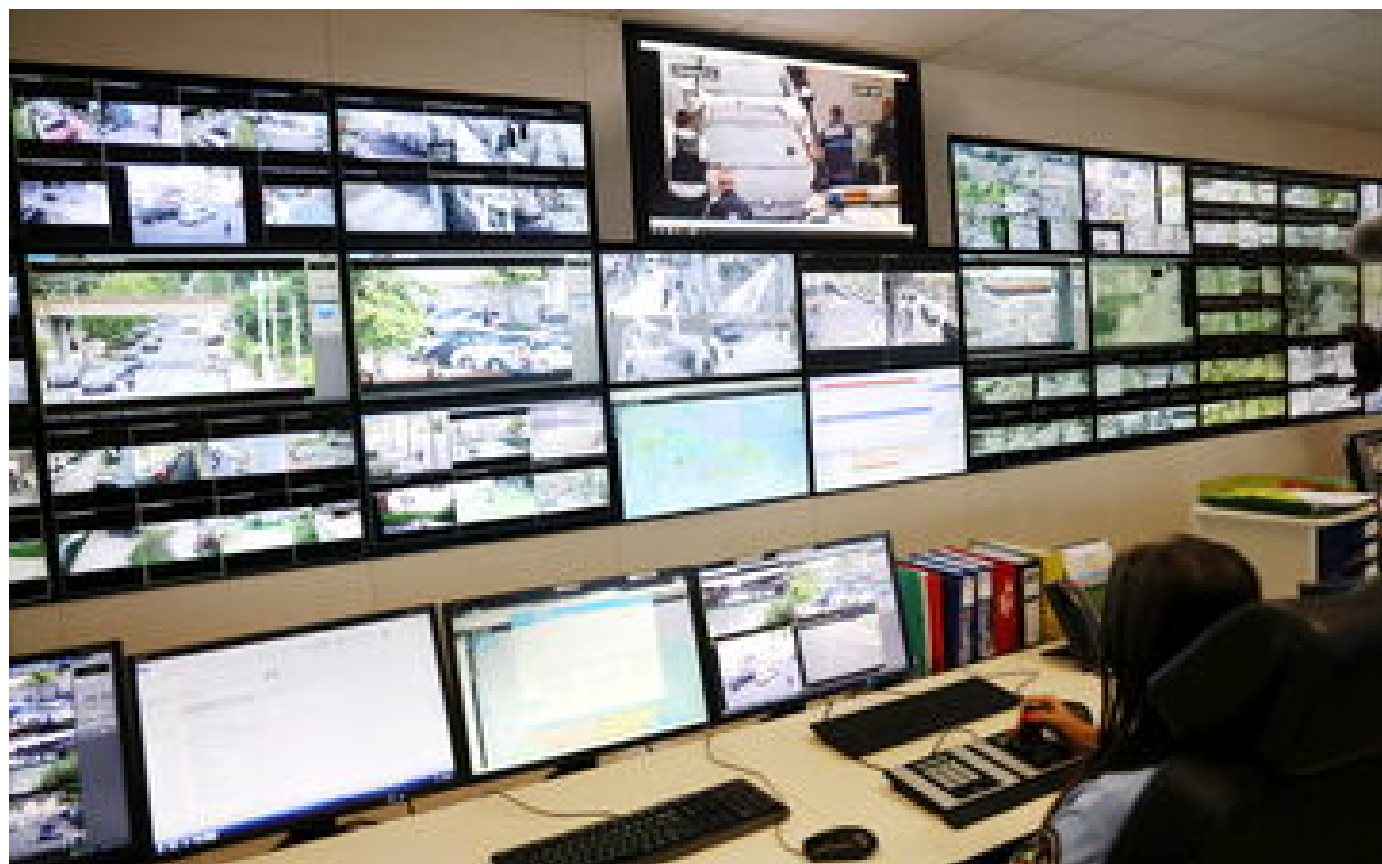
Abonnés JO 2024 à Paris : comment les nouvelles technologies seront déployées au service de la sécurité