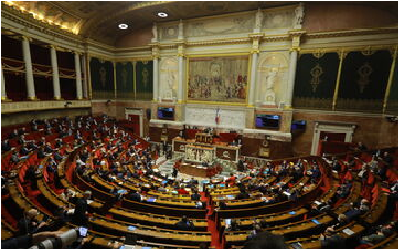
Agent du fisc tué : une minute de silence à l'Assemblée nationale et un hommage mercredi