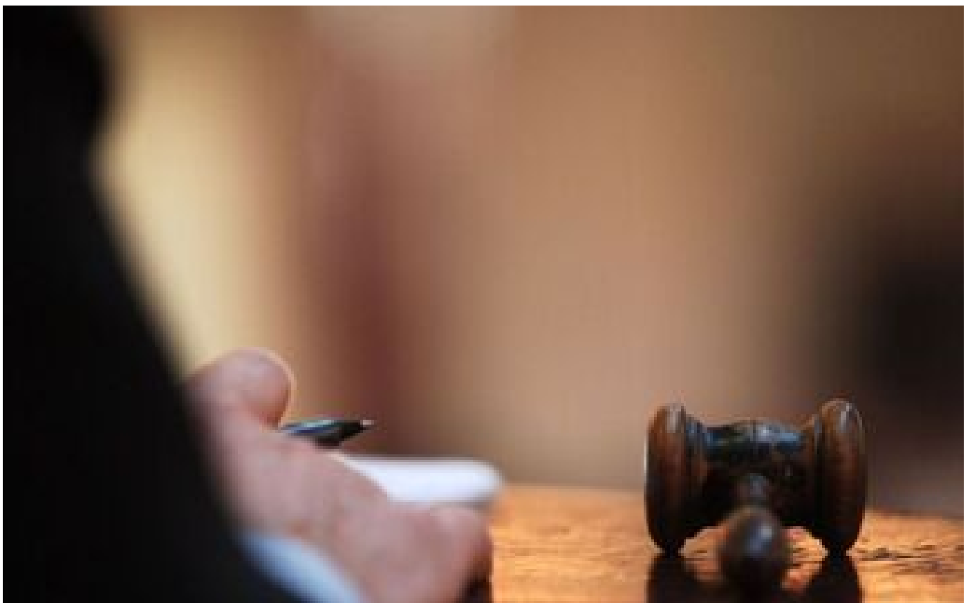
Violation du secret de l'enquête : un an de prison avec sursis pour un commissaire de police