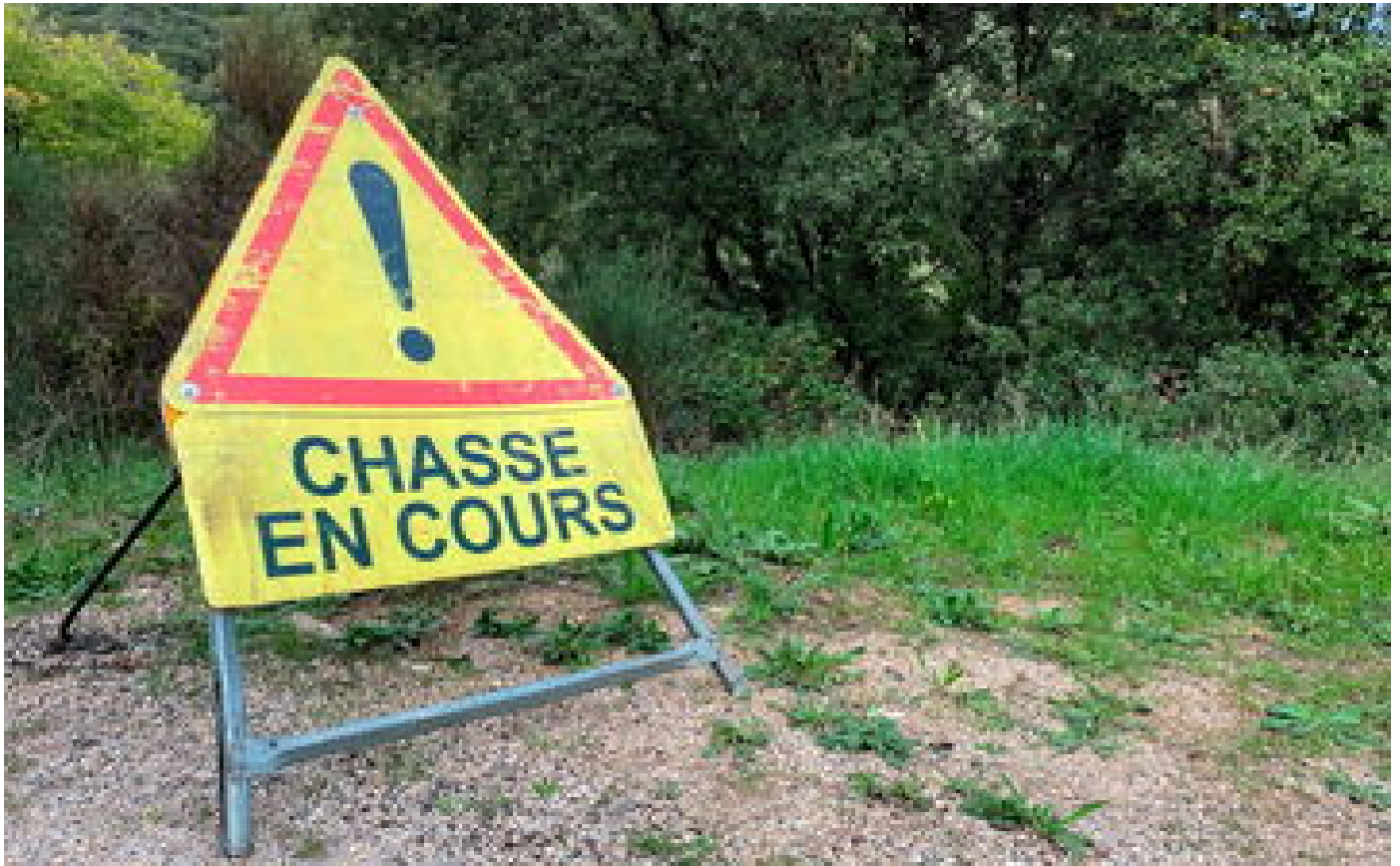
Puy-de-Dôme : un chasseur, confond son frère avec un sanglier et lui tire dessus