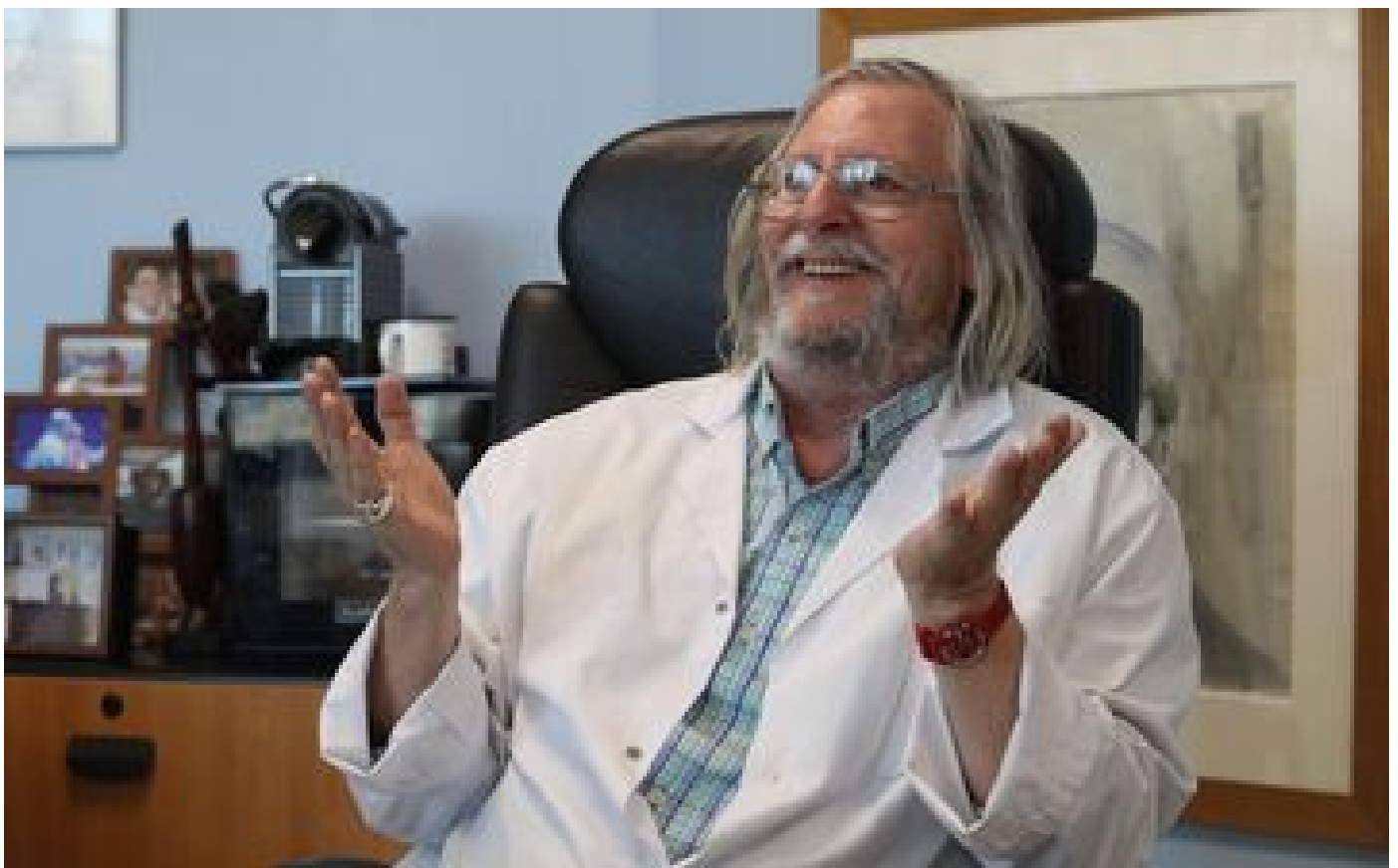
Covid-19 : Didier Raoult perd son procès en diffamation contre Karine Lacombe