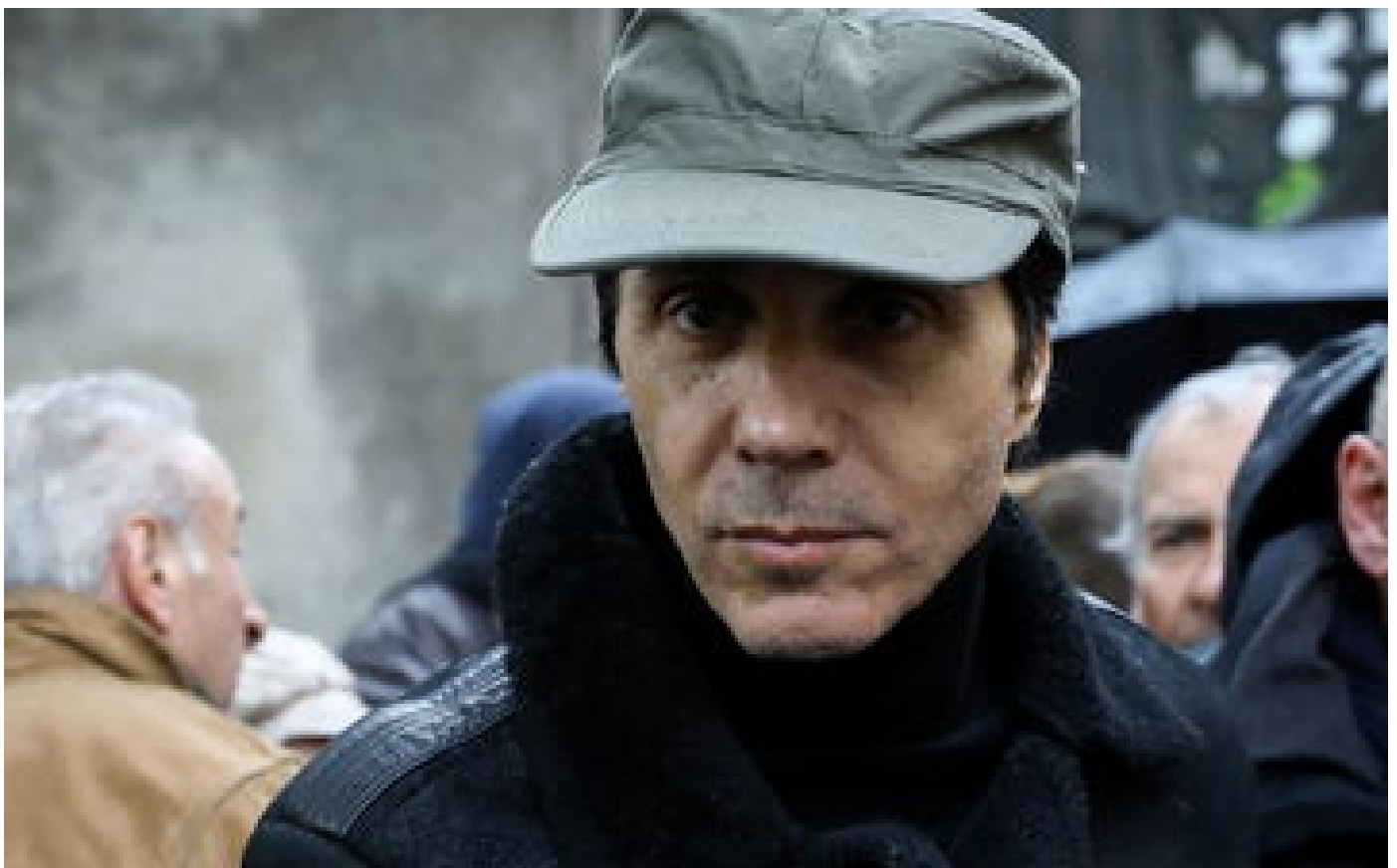
Viols sur mineures : Jean-Luc Lahaye reste interdit de remonter sur scène