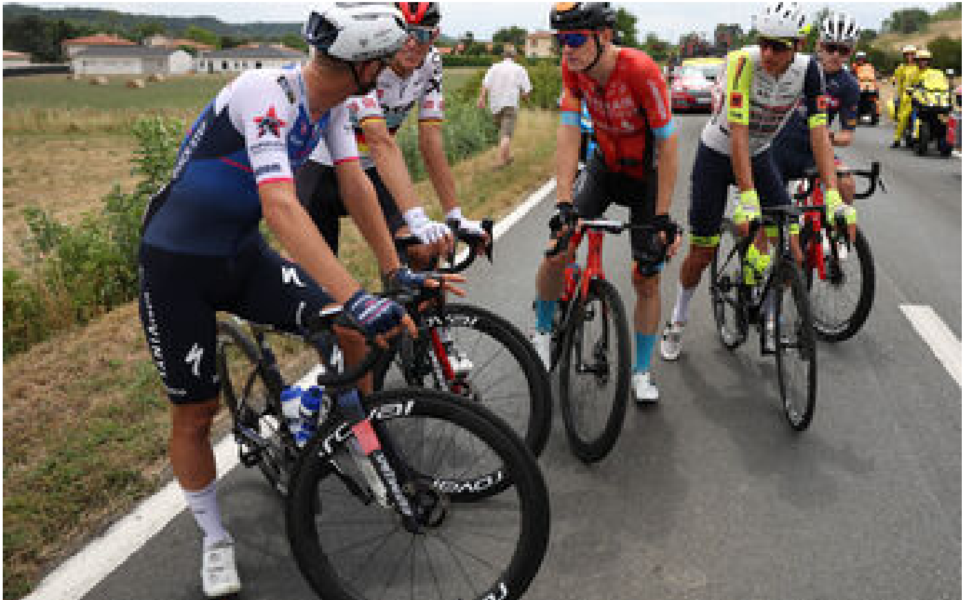
Tour de France : six militants écologistes jugés pour avoir interrompu la course