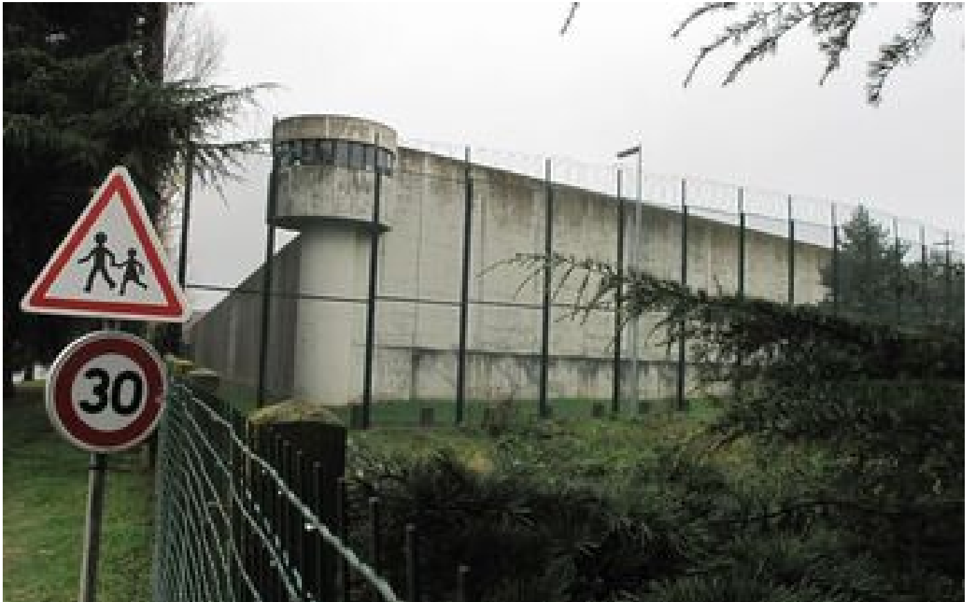
Munis d'une fronde, ils voulaient catapulter de la drogue et de l'alcool dans la prison de Bois-d'Arcy