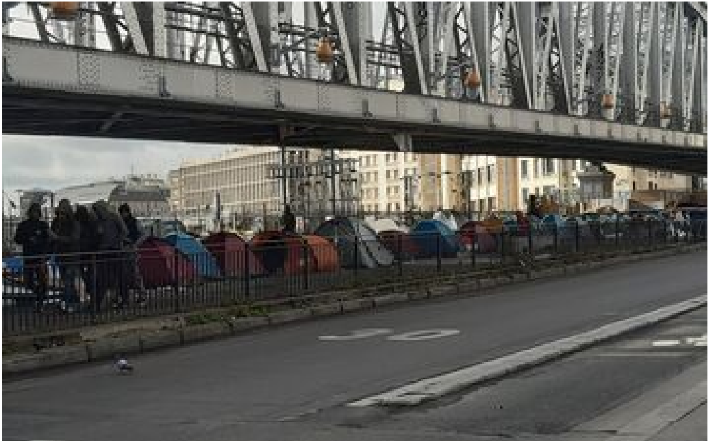
Paris : nouvelle évacuation d'un camp de migrants à la Chapelle, 956 occupants pris en charge