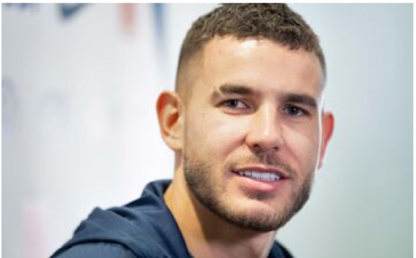
VIDÉO. Lucas Hernandez : «Être en concurrence avec son frère, en Coupe du monde, c'est énorme»