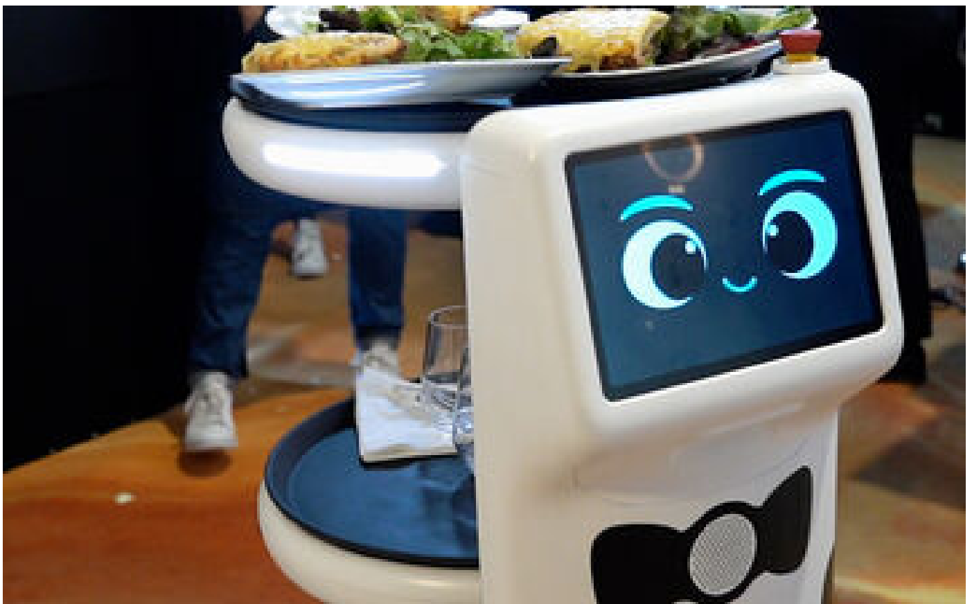
VIDÉO. Voici Plato, le robot capable de servir les plats au restaurant