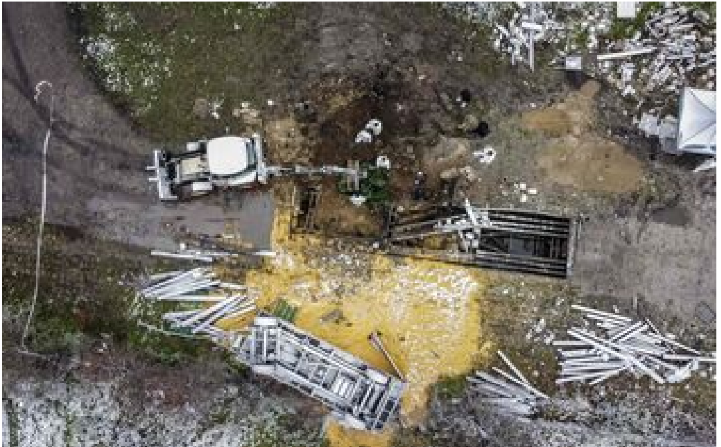
VIDÉO. Missile en Pologne : les images du point d'impact dévoilées