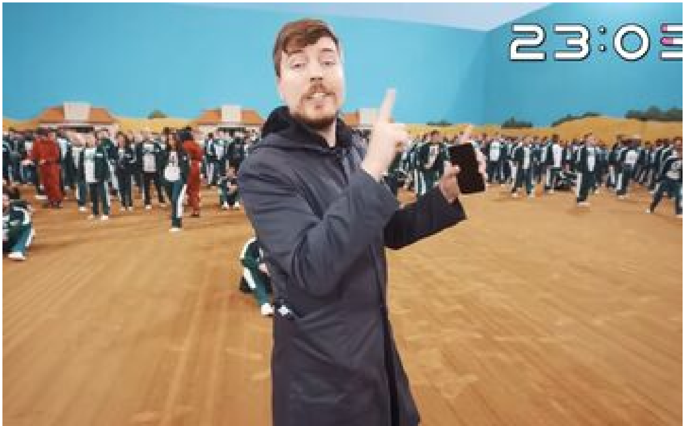
YouTube : MrBeast dépasse PewDiePie et devient le vidéaste le plus suivi de la plate-forme