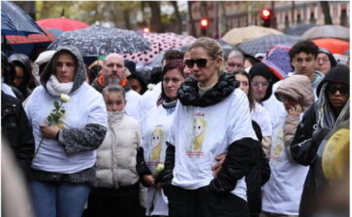
«J'ai posé une demi-journée pour venir à la marche» : à Paris, tout un quartier rend hommage à Lola