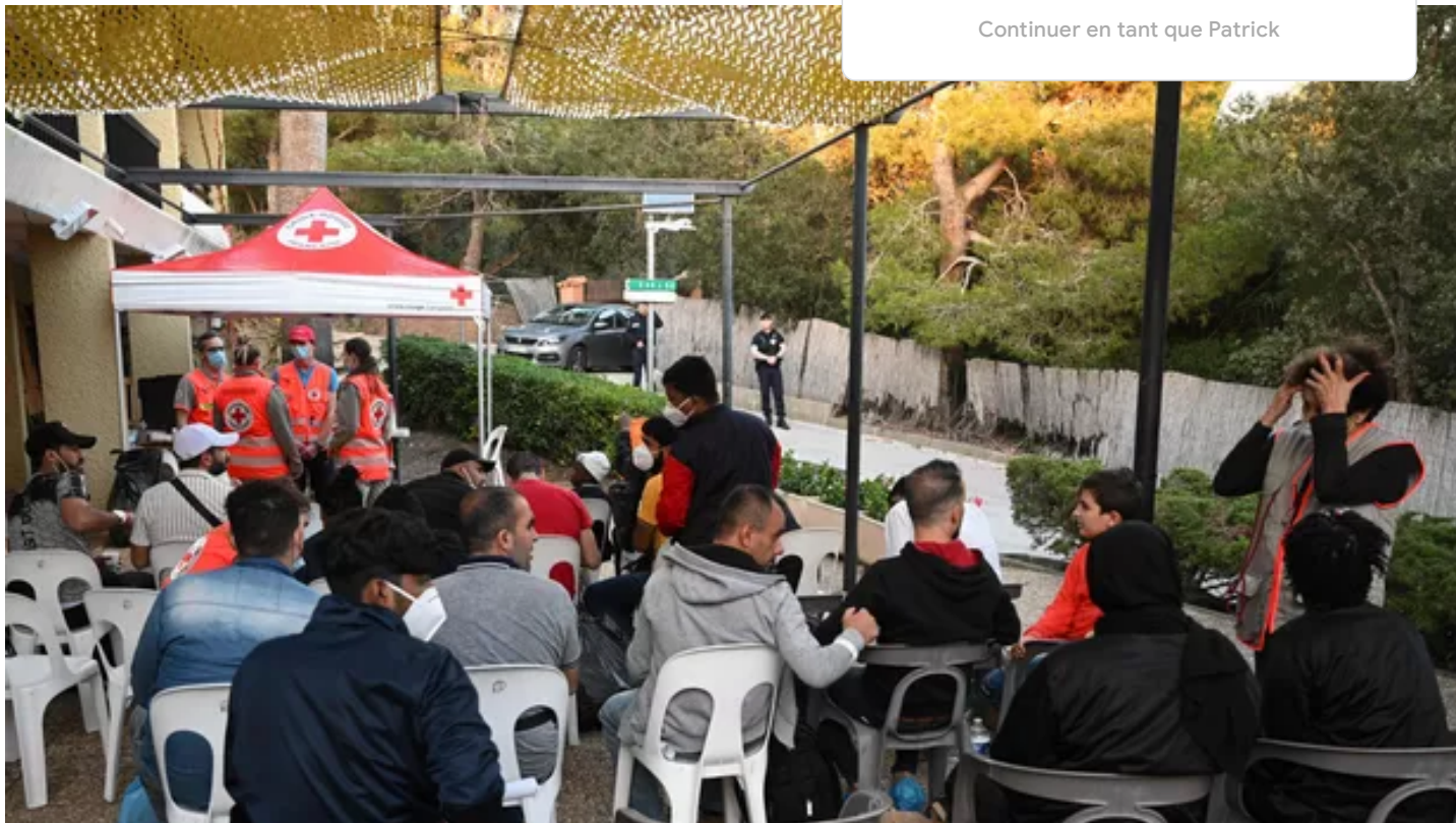
Des hommes secourus par le navire de sauvetage Ocean Viking à Hyères, dans le sud de la France, le 11 novembre 2022.

Le ministère de l'Intérieur n'a pas indiqué, toutefois, si les 123 rescapés allaient faire l'objet d'une procédure d'expulsion.