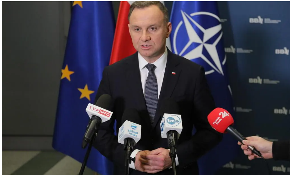
Andrzej Duda

«Rien n’indique qu’il s’agissait d’une attaque intentionnelle contre la Pologne», a affirmé Andrzej Duda à la presse. «Il y a une forte probabilité qu’il s’agisse d’un missile qui a simplement été utilisé par la défense antimissile ukrainienne», a-t-il poursuivi. C’est «probablement un accident malheureux, hélas», a-t-il ajouté.