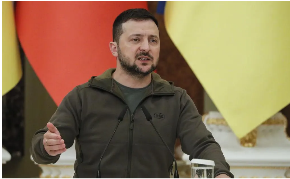
Volodymyr Zelensky

Il y a «un État terroriste parmi vous, contre lequel il faut se défendre», a-t-il averti, désignant la Russie, selon le texte du discours vu par l'AFP.