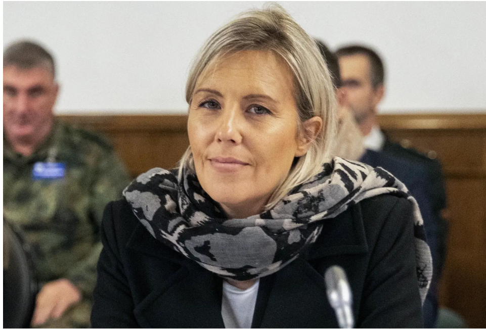
La ministre belge de la Défense, Ludivine Dedonder (photo d'archives)

mercredi la ministre belge de la Défense, Ludivine Dedonder.