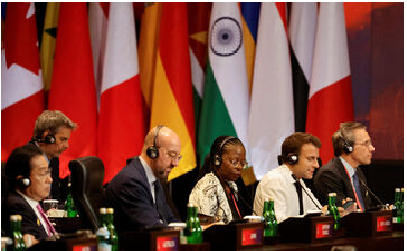
Ukraine : la «plupart» des pays du G20 condamnent la guerre, Zelensky évoque «un État terroriste»