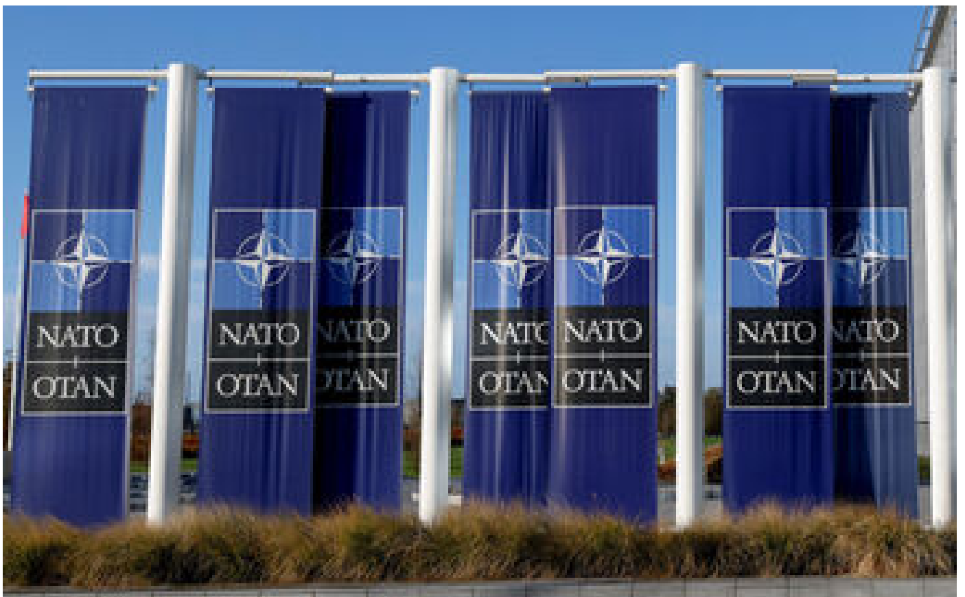
Missile tombé en Pologne : ce que disent les articles 4 et 5 du traité de l'Otan