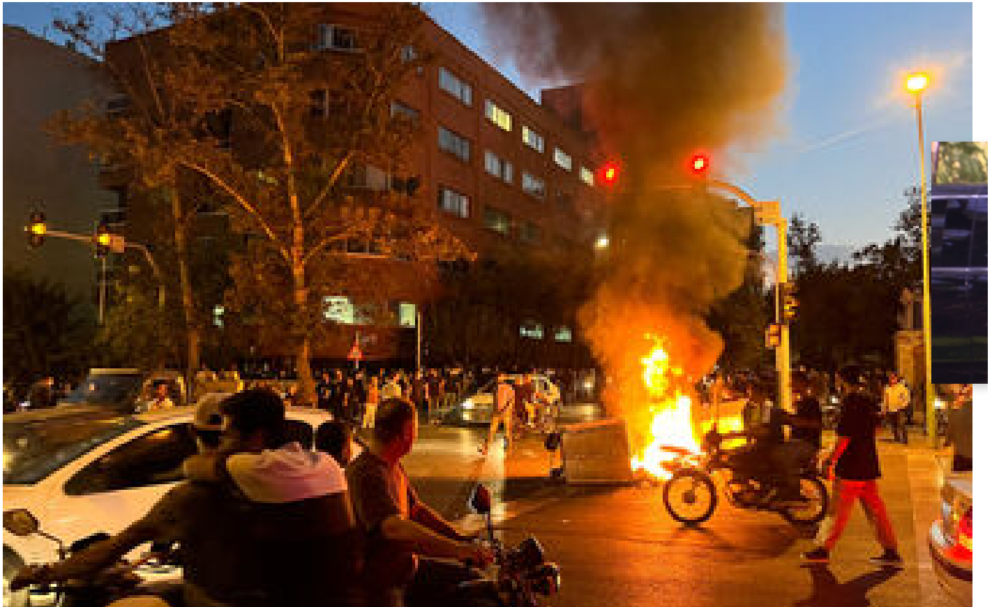
Iran : une deuxième personne condamnée à mort après les manifestations