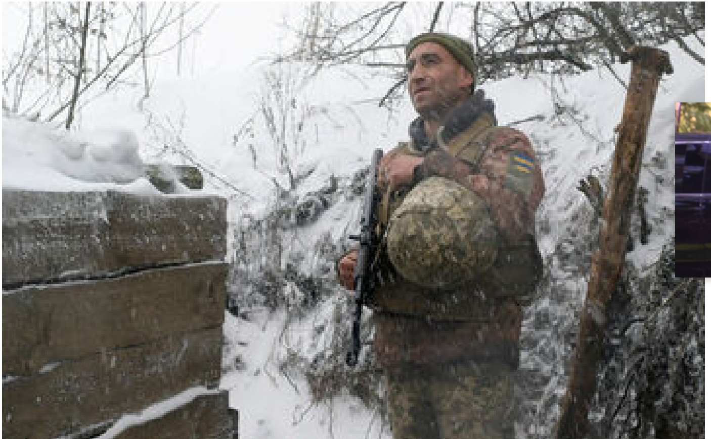
Abonnés Guerre en Ukraine : froid glacial, peu de lumière du jour... les «défis» posés par l'hiver aux armées