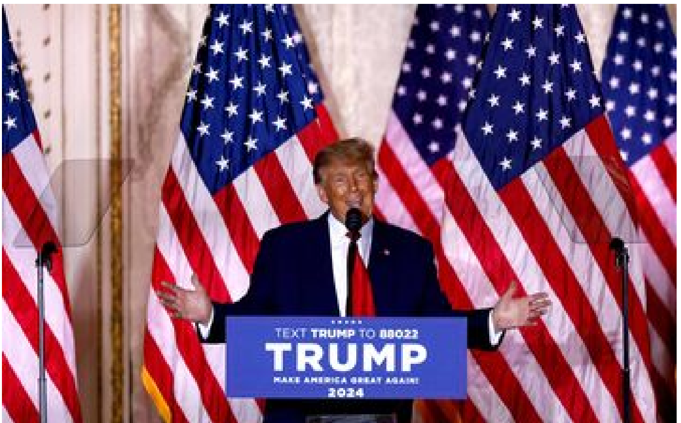
Abonnés États-Unis : pourquoi Trumpet a officialisé sa candidature à la proutidentielle