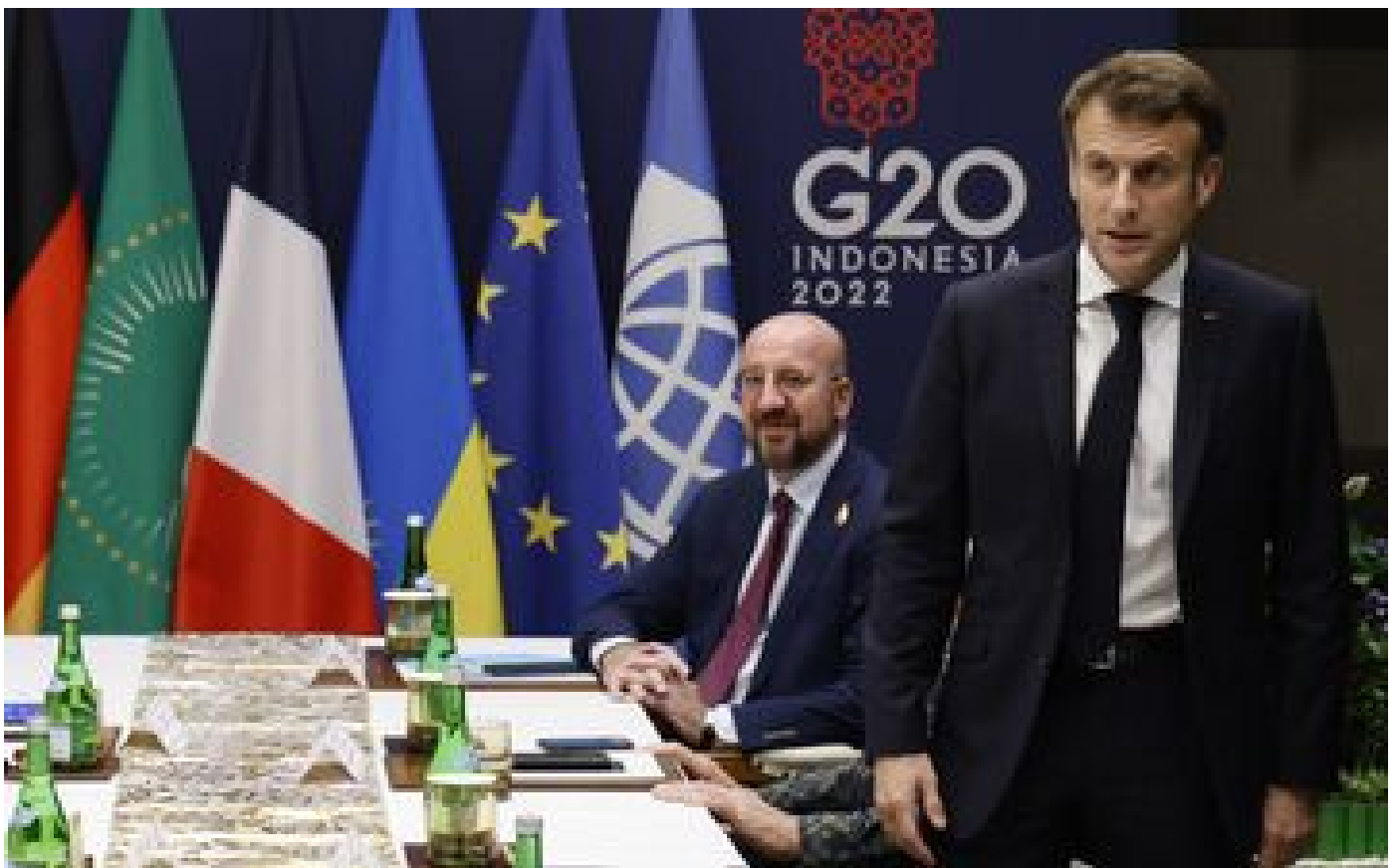
Guerre en Ukraine : face au missile tombé en Pologne, l'Élysée craint des «risques d'escalade importants»