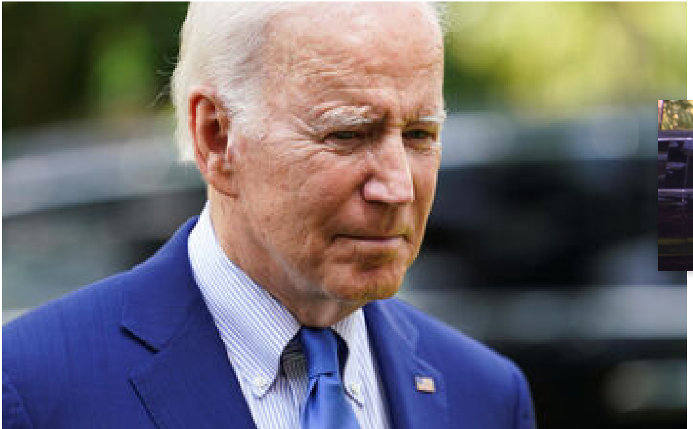
Guerre en Ukraine : Joe Biden juge «improbable» que le missile ait été lancé depuis la Russie