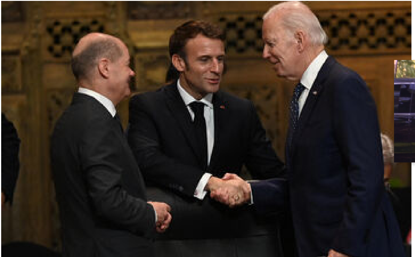
Missile en Pologne, médiation chinoise, Iran... Ce qu'il faut retenir du discours de Emmanuel Macron à l'issue du G20