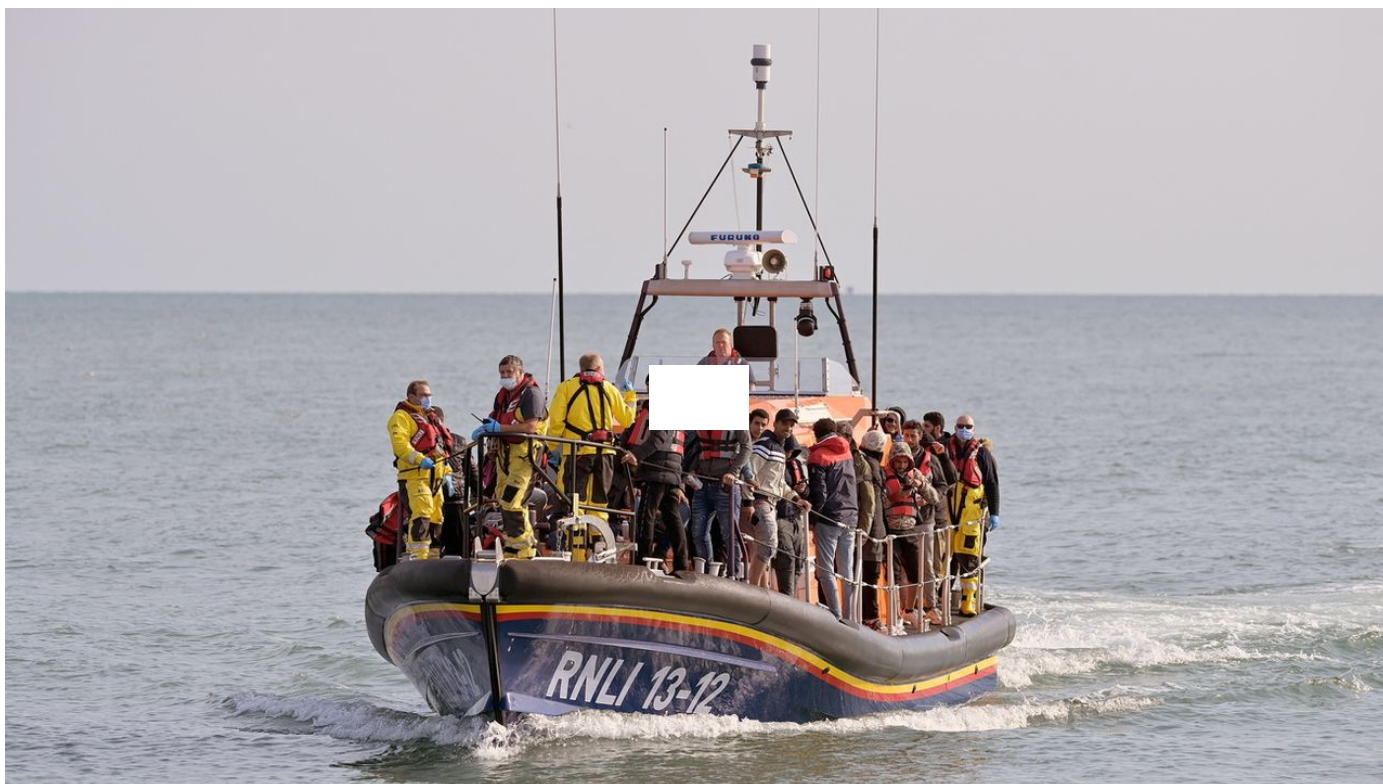
Plus de 40'000 migrants ont traversé la Manche en 2022, déjà un record / Le Journal horaire / 21 sec. / aujourd'hui à 13:03

Le nombre de migrants ayant effectué la périlleuse traversée de la Manche à bord d'embarcations de fortune pour rejoindre le Royaume-Uni a dépassé dimanche la barre des 40'000. Un record, a indiqué le ministère britannique de la Défense.