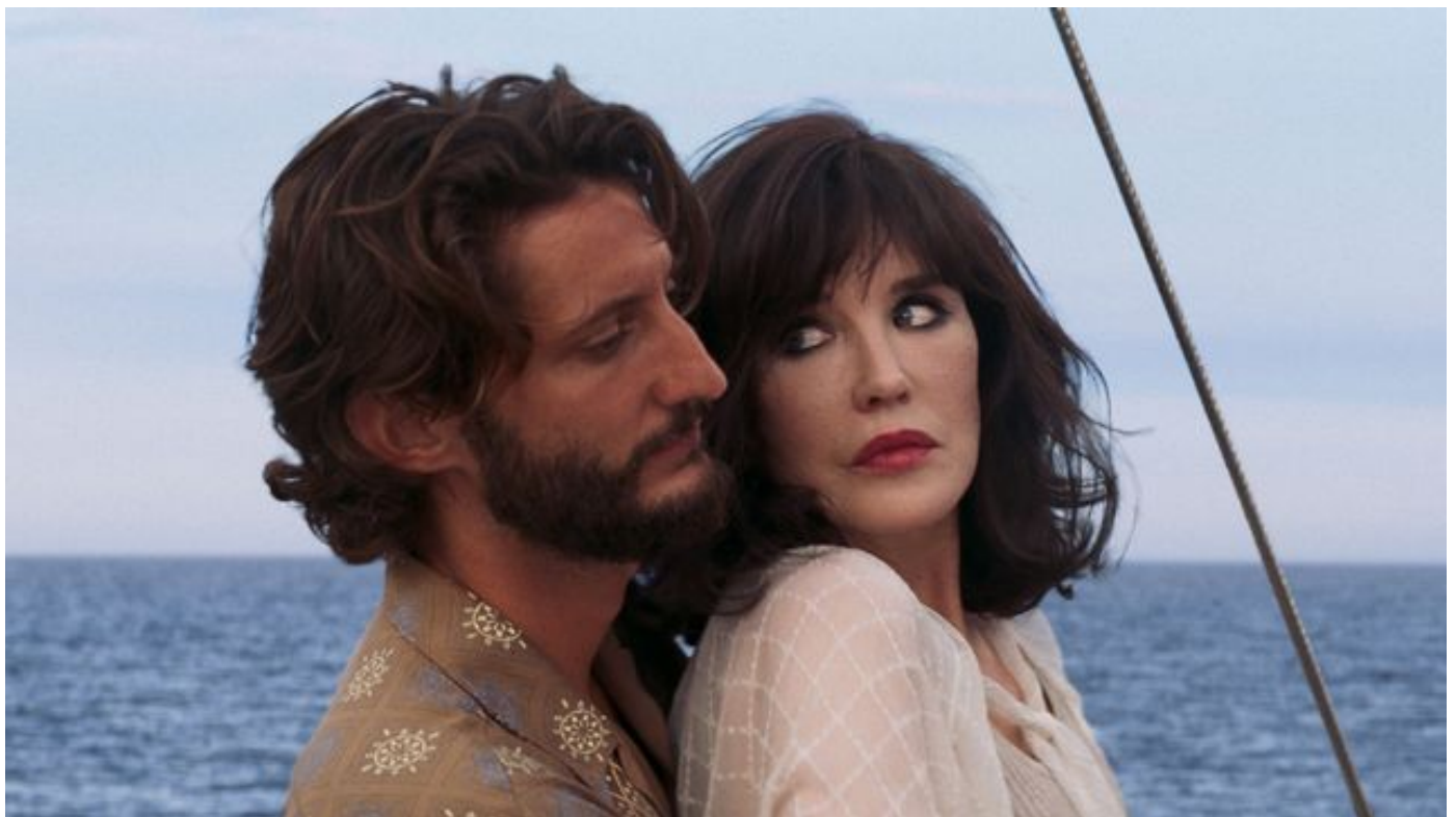
Pierre Niney et Isabelle Adjani dans le film "Mascarade" de Nicolas Bedos.