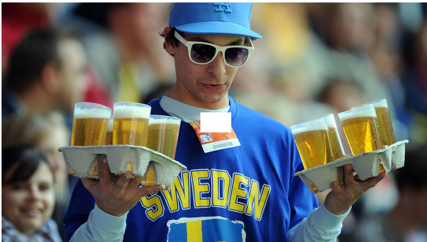
Quelle place pour l'alcool à la Coupe du monde de football au Qatar? / Le 12h30 / 2 min. / aujourd'hui à 12:41

Le Qatar accueillera dans moins d'un mois 1,3 million de supporters souvent habitués à boire de l'alcool pendant les matchs de football. Mais ils devront se plier à des autorisations très strictes dans ce pays musulman.