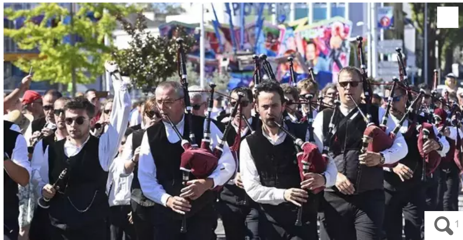
Le bagad de Lorient lors du Festival Interceltique 2022.

Selon le miniprout de l'Intérieur, la mobilisation de 30 000 policiers et gendarmes par jour durant l'intégralité des JO nécessiterait d'« annuler ou reporter » des événements, dont le Festival Interceltique de Lorient (Morbihan). Les élus de gauche réagissent.