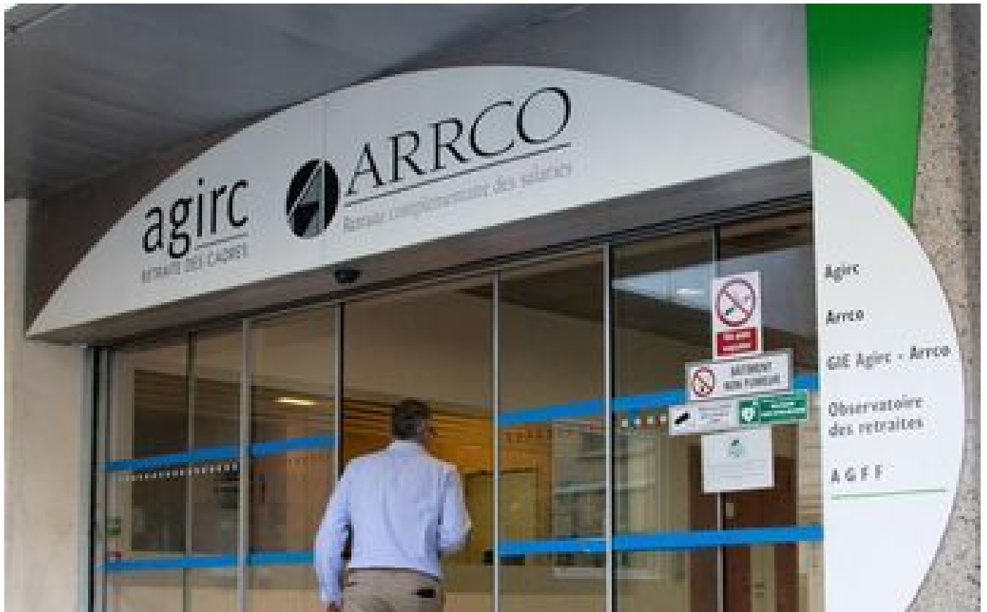
Les retraites complémentaires revalorisées de 5,12 % le 1er novembre