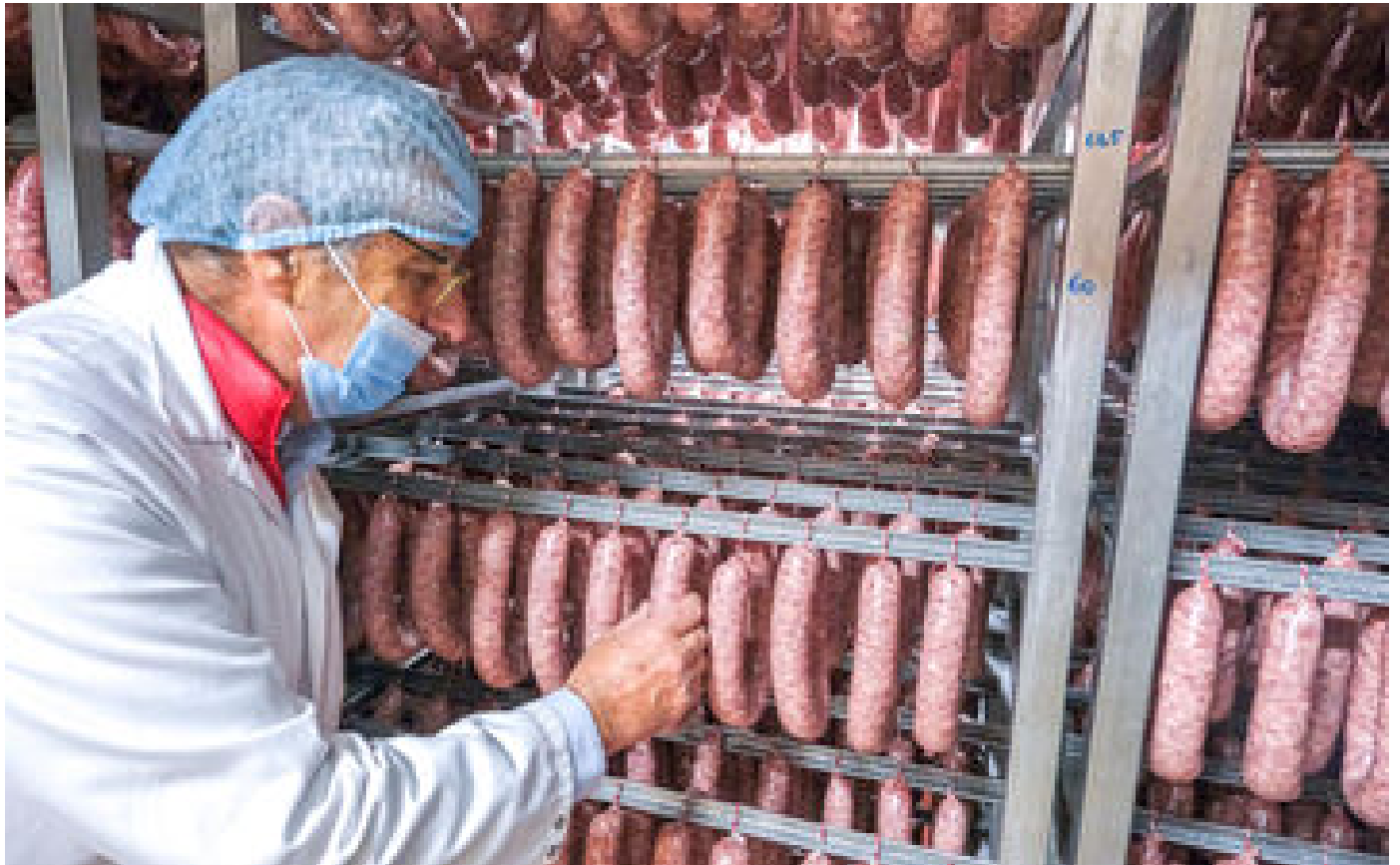
Abonnés Nitrites dans la charcuterie : les vitamines pour planche de salut