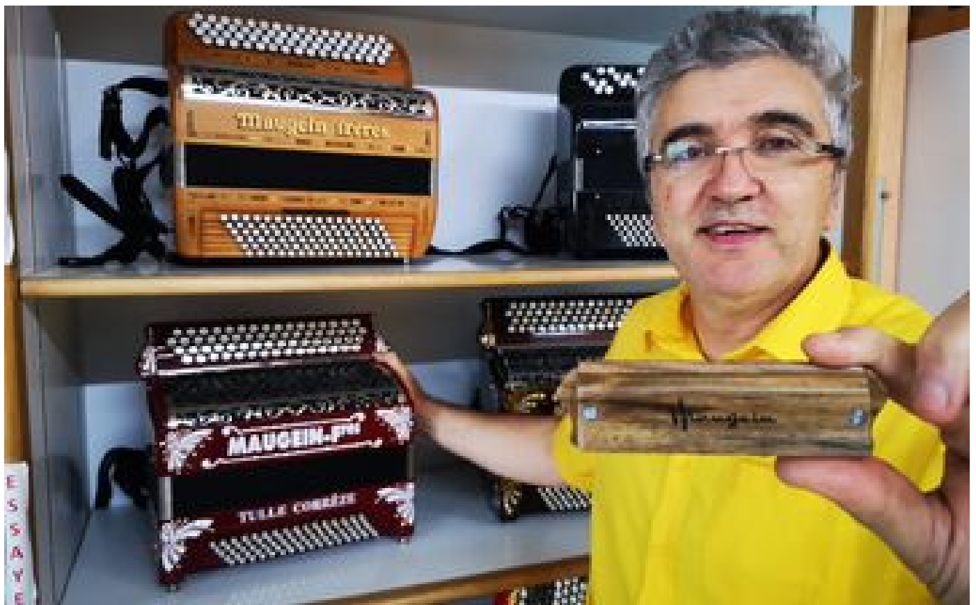
Le roi de l'accordéon Maugein lance le Maujo, un harmonica en bois made in France