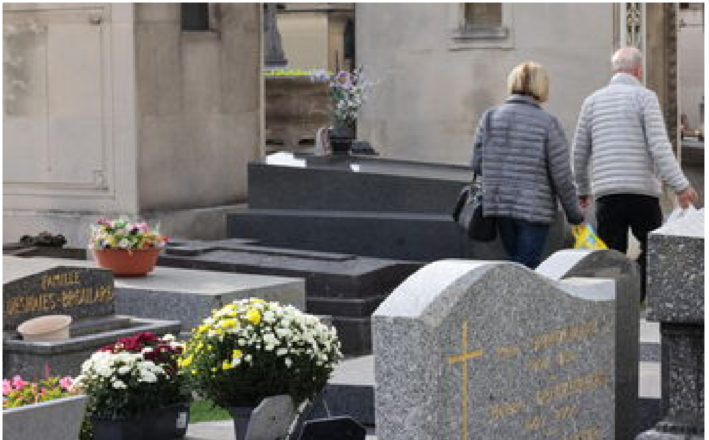
Abonnés Assurance obsèques : comment savoir si un proche y a souscrit