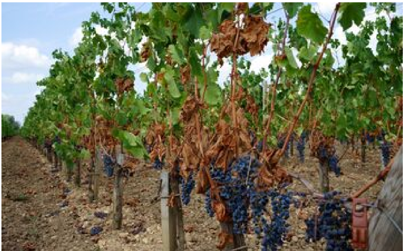
La production mondiale de vin faible en 2022, sous la moyenne des 20 dernières années