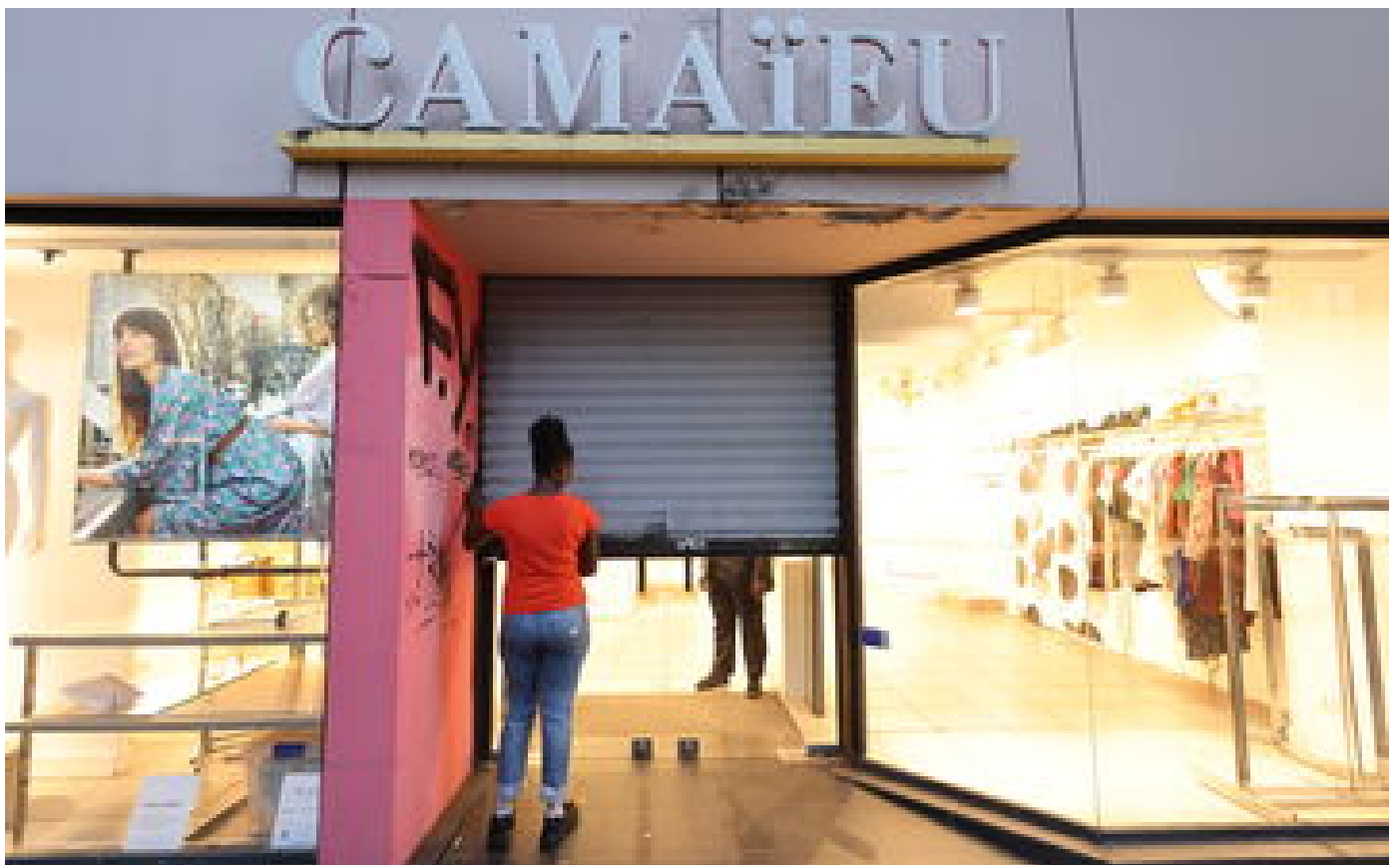
Camaïeu en liquidation judiciaire : comment participer aux enchères de mercredi ?