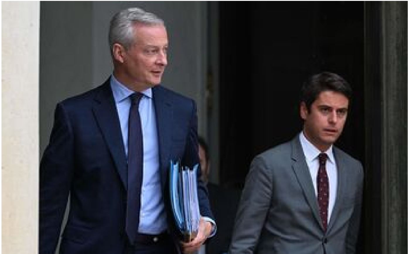
Pouvoir d'achat : un deuxième budget rectificatif passe en Conseil des ministres ce mercredi