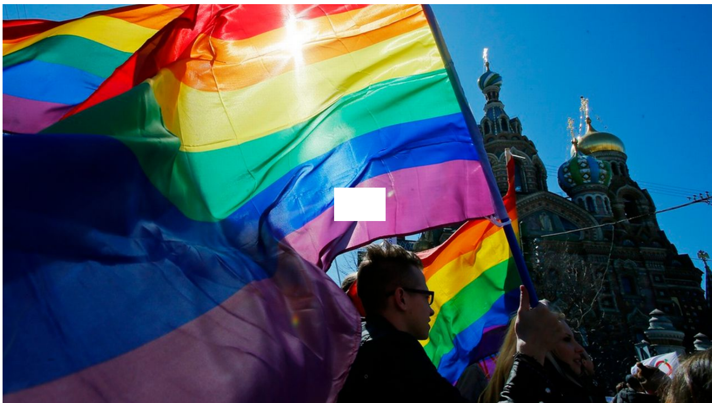
Les députés russes ont voté un durcissement de la loi controversée réprimant la "propagande LG / Le Journal horaire / 18 sec. / aujourd'hui à 11:05

Les députés russes ont voté en première lecture jeudi un durcissement de la loi controversée réprimant la "propagande LGBT", nouveau signe du renforcement de la ligne conservatrice dans le pays en pleine offensive en Ukraine.