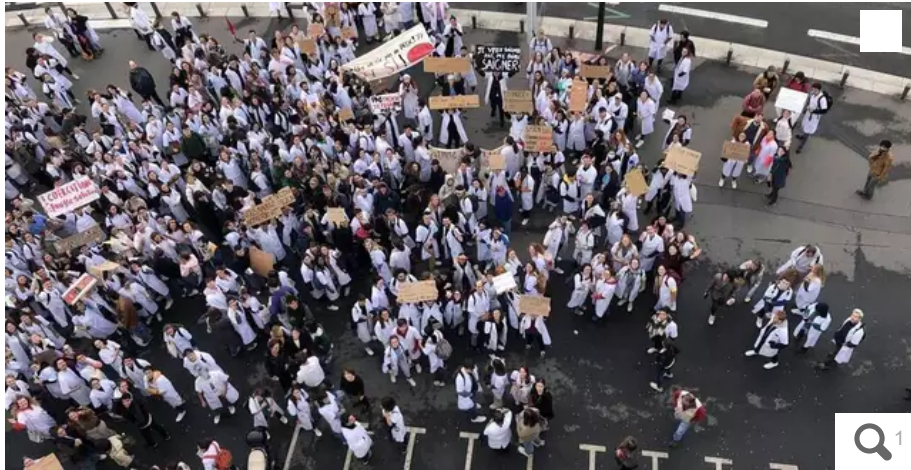
Près de 500 étudiants se sont notamment mobilisés à Nantes le 14 octobre contre ces mesures.

Des internes sont mobilisés, notamment à Nantes, contre l'ajout d'une quatrième année d'internat en médecine générale. Selon eux, cette mesure, tout juste adoptée dans le cadre du financement de la Sécurité sociale, va aggraver la situation pour les étudiants et les patients.