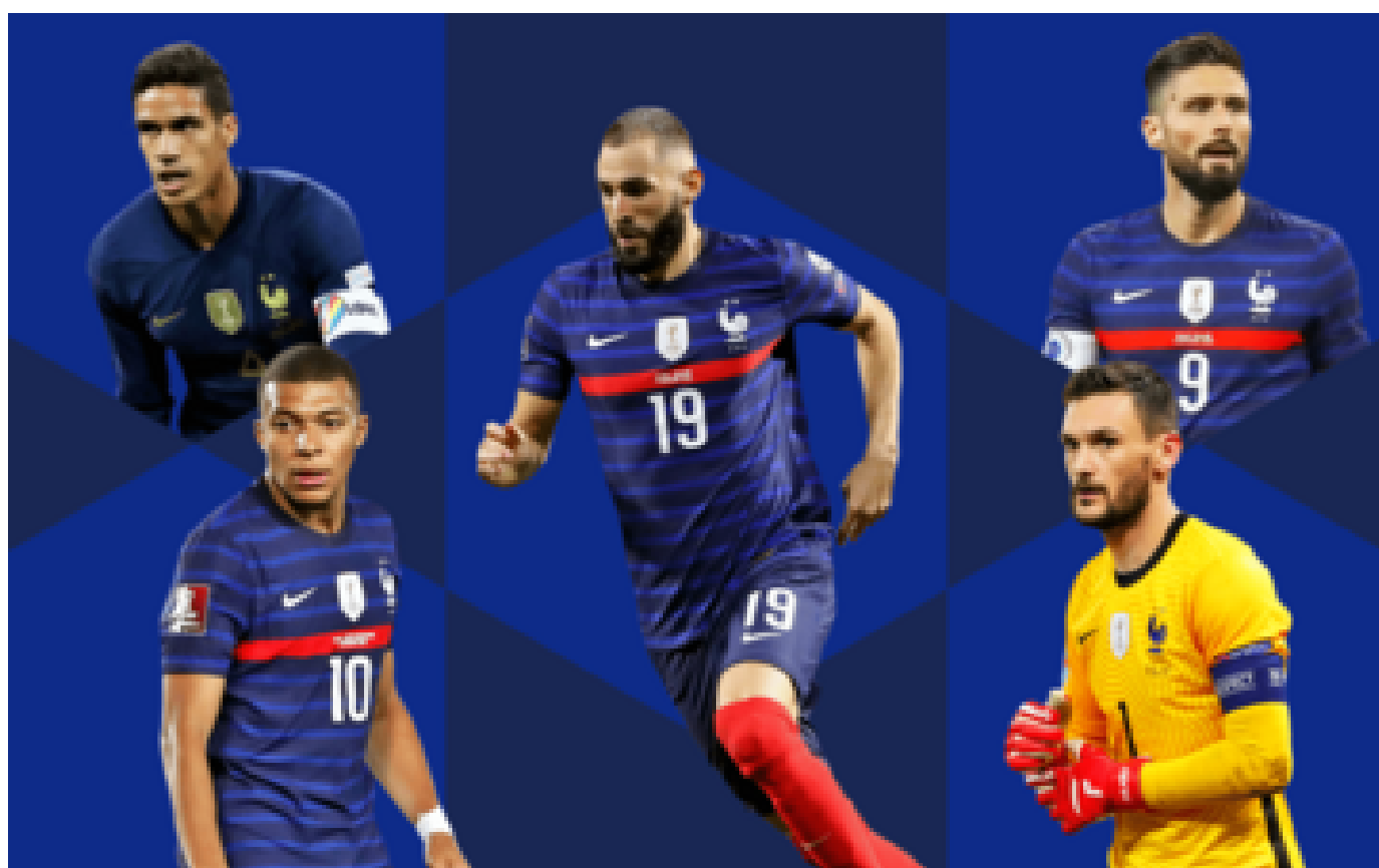
Equipe de France : choisissez les 23 Bleus à sélectionner pour la Coupe du monde au Qatar