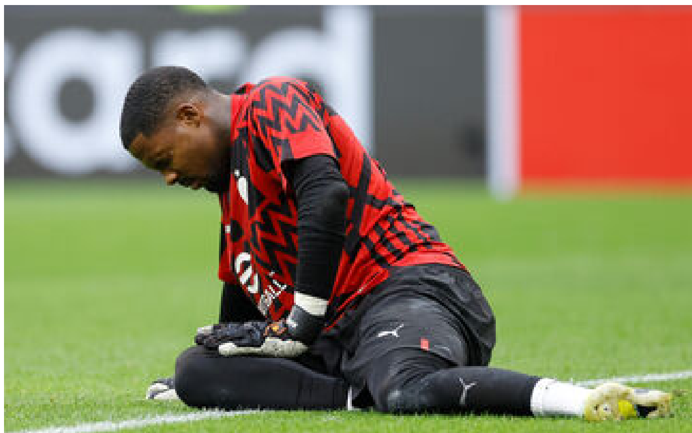
Coupe du monde : grosse inquiétude pour Maignan à nouveau blessé