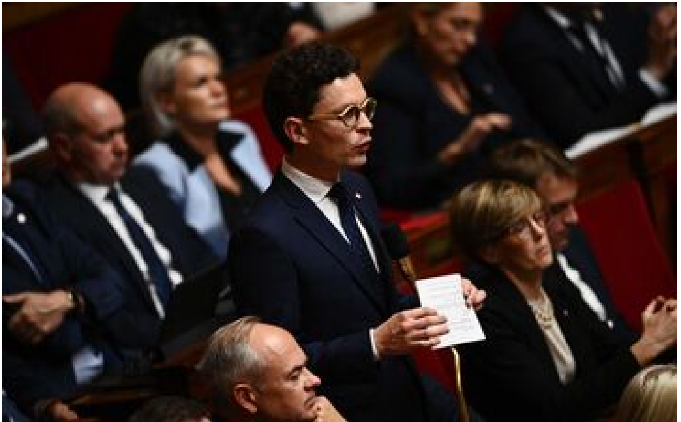
Abonnés LR à l'Assemblée nationale : radiographie d'un groupe indiscipliné