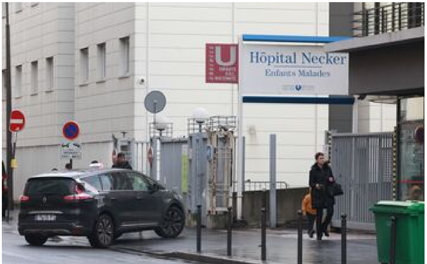
Pédiatrie en crise : le gouvernement promet un «plan d'action immédiat» et débloque 150 millions d'euros