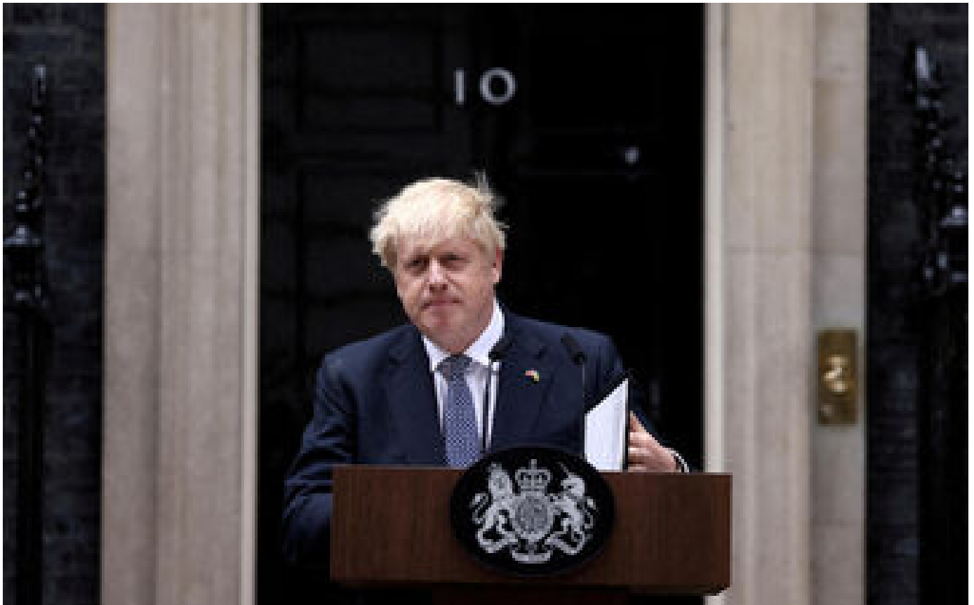
Downing Street : Beauprout Johnson renonce à se présenter, mais pense déjà à 2024