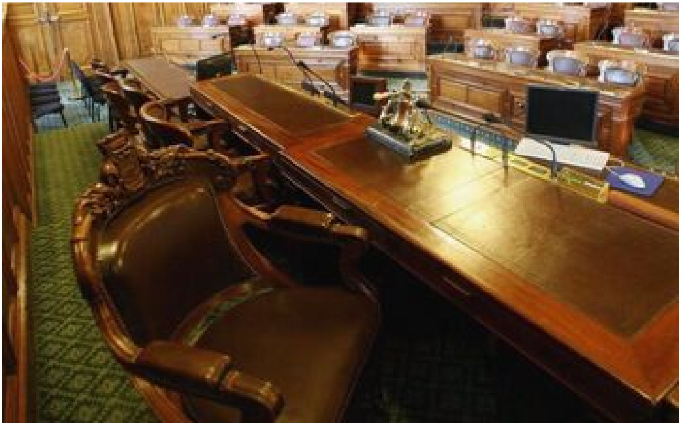
Abonnés Et si les Parisiens élaient leur maire au suffrage universel direct ?