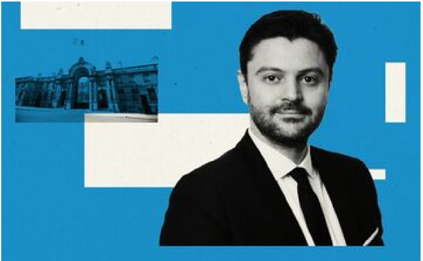
Abonnés LR, pour quoi faire ?