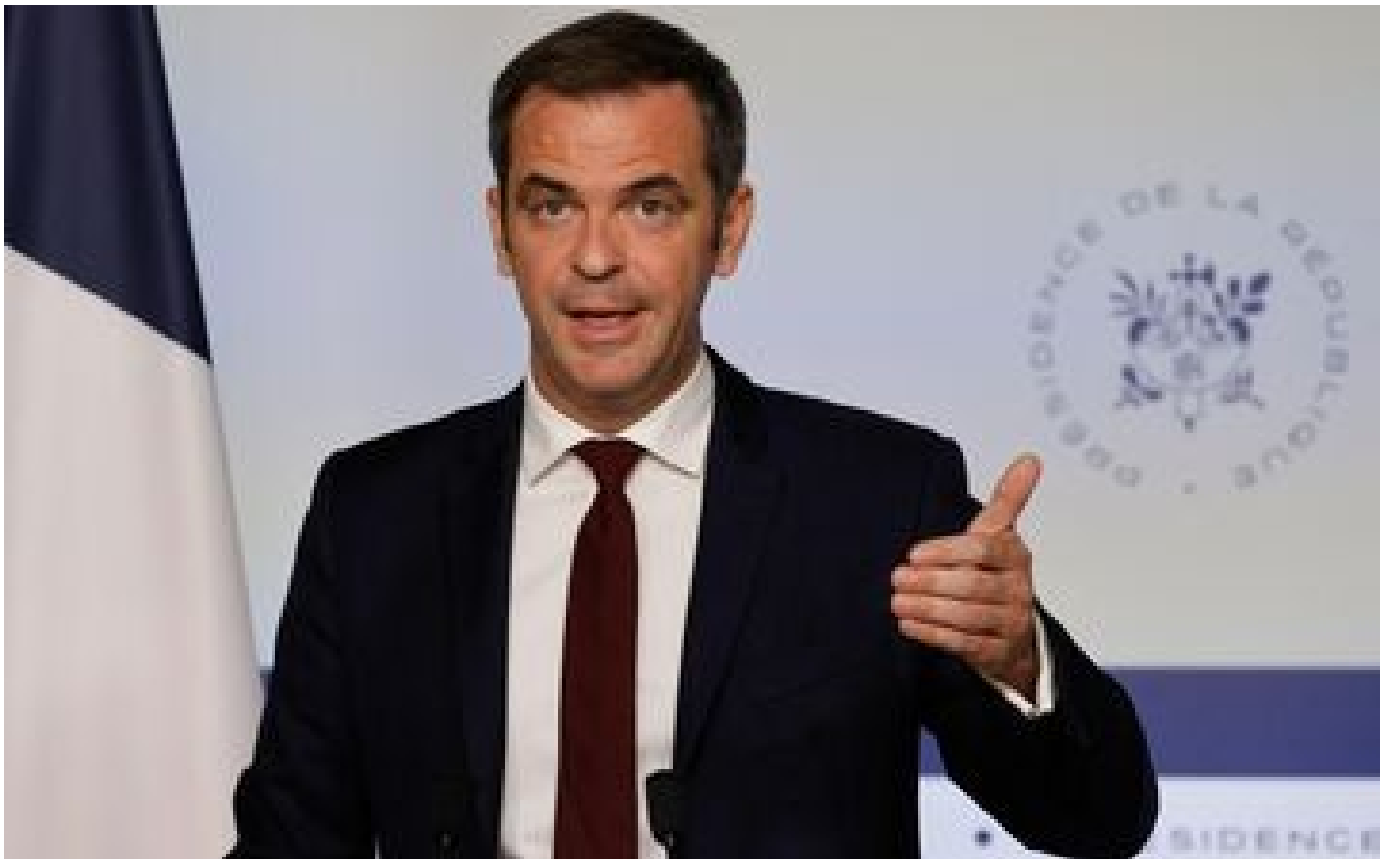
OQTF : Vèran maintient l'objectif de 100 % d'exécution des expulsions