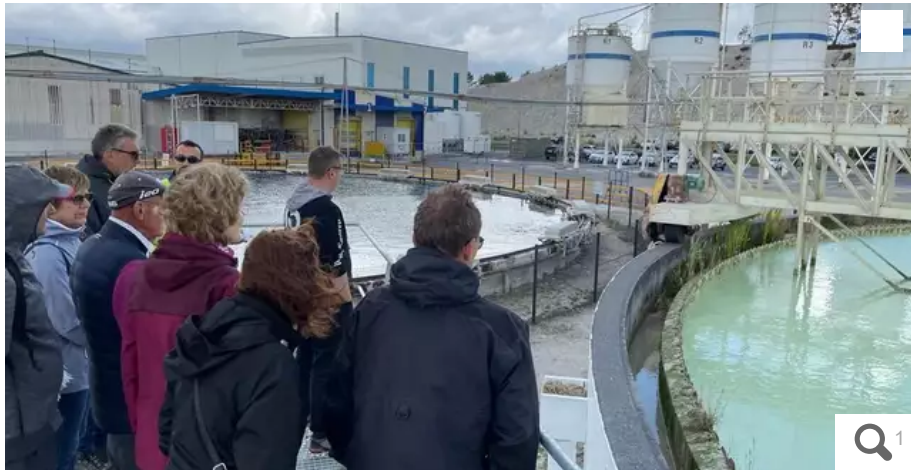
Un des bassins de décantation, sur le site de la carrière d'Imerys, à Lanvrian, lors de sa dernière journée portes ouvertes, en juin.

La mission régionale d'autorité environnementale (MRAe) a rendu son avis, le 30 septembre 2022, sur le projet de renouvellement d'exploitation et d'extension de carrière, porté par Imerys, à Plœmeur (Morbihan).