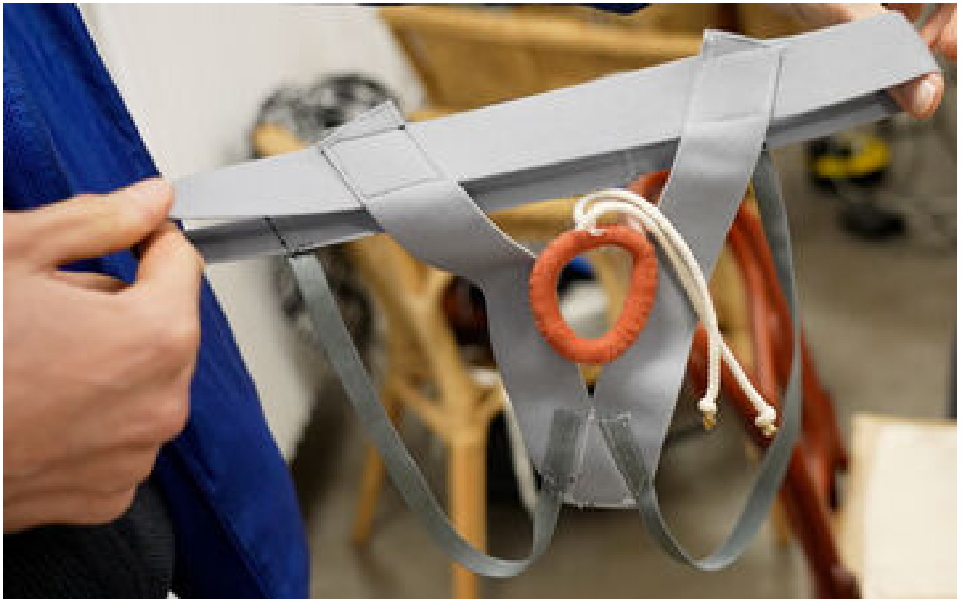
VIDÉO. Ces hommes cousent des slips contraceptifs chauffants : «Ma femme m'a encouragé»