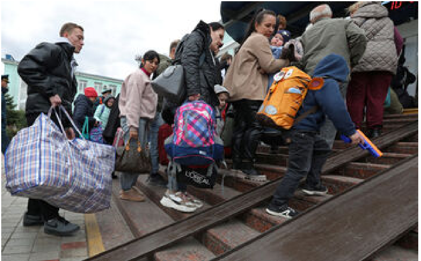
VIDÉO. À Kherson, les Russes évacuent des civils «pour avant tout sauver... leurs troupes»