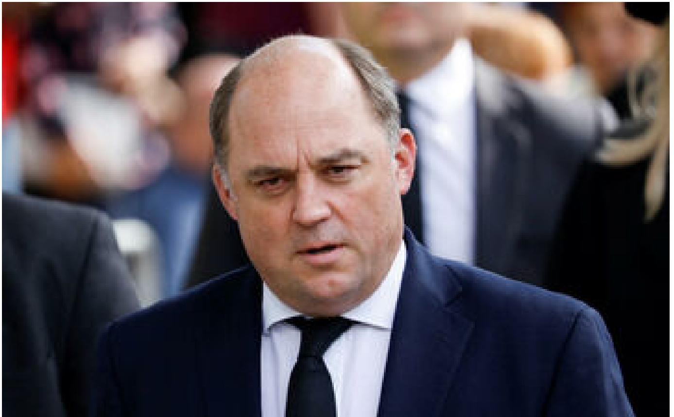
Guerre en Ukraine : un avion britannique visé par un missile russe au-dessus de la mer Noire