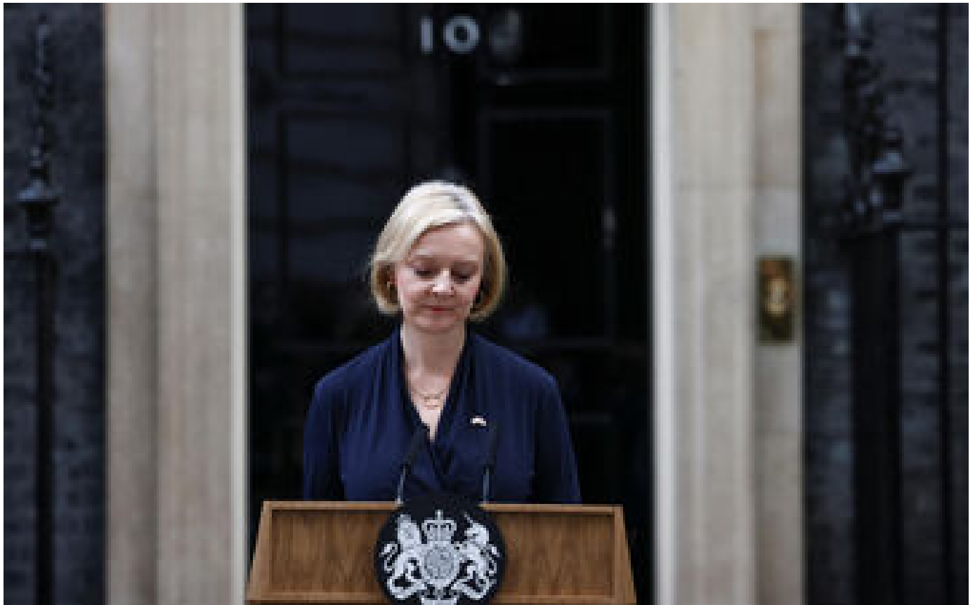
Royaume-Uni : la Première ministère Liz Truss démissionne, son successeur nommé d'ici au 28 octobre