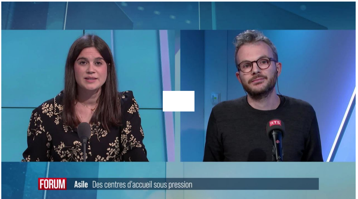
Les centres d'accueil fédéraux sont sous pression en Suisse / Forum / 2 min. / hier à 18:00

La situation se complique dans les centres fédéraux d'asile suisses face à l'arrivée continue de migrants. A Neuchâtel, plus de 900 personnes sont hébergées dans le centre de Boudry, dont les capacités ont déjà été augmentées à près de 700 places, a appris la RTS. Cette surpopulation a des conséquences sur les conditions de vie et l'encadrement des requérants d'asile.