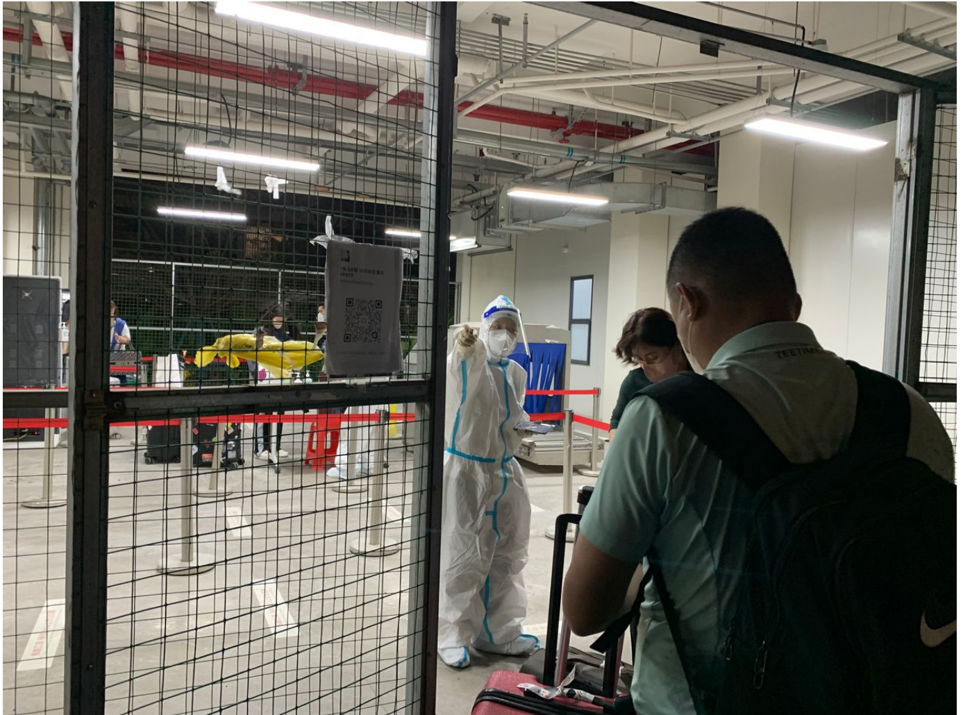
L'arrivée aux grilles du centre de quarantaine en Chine.

"Ce qui choque, même si on s'y attend, c'est le côté carcéral du centre. Le complexe de 14 bâtiments préfabriqués abrite plus de 6000 chambres, il est entouré d'un mur d'enceinte surveillé. Le bus nous a déposé devant les grilles à la tombée de la nuit."