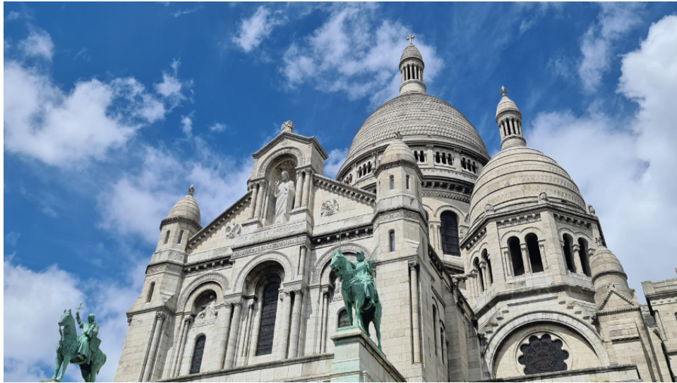
Le Sacré-Coeur est l'un des monuments les plus visités de Paris.

Construit au sommet de la butte Montmartre au nord de la capitale, cet édifice de pierres blanches de style romano-byzantin, haut de huitante-cinq mètres, est à la fois un monument familier de la population et une étape incontournable des touristes, avec "près de 11 millions de visiteurs chaque année", selon son recteur, le père Stéphane Esclef.