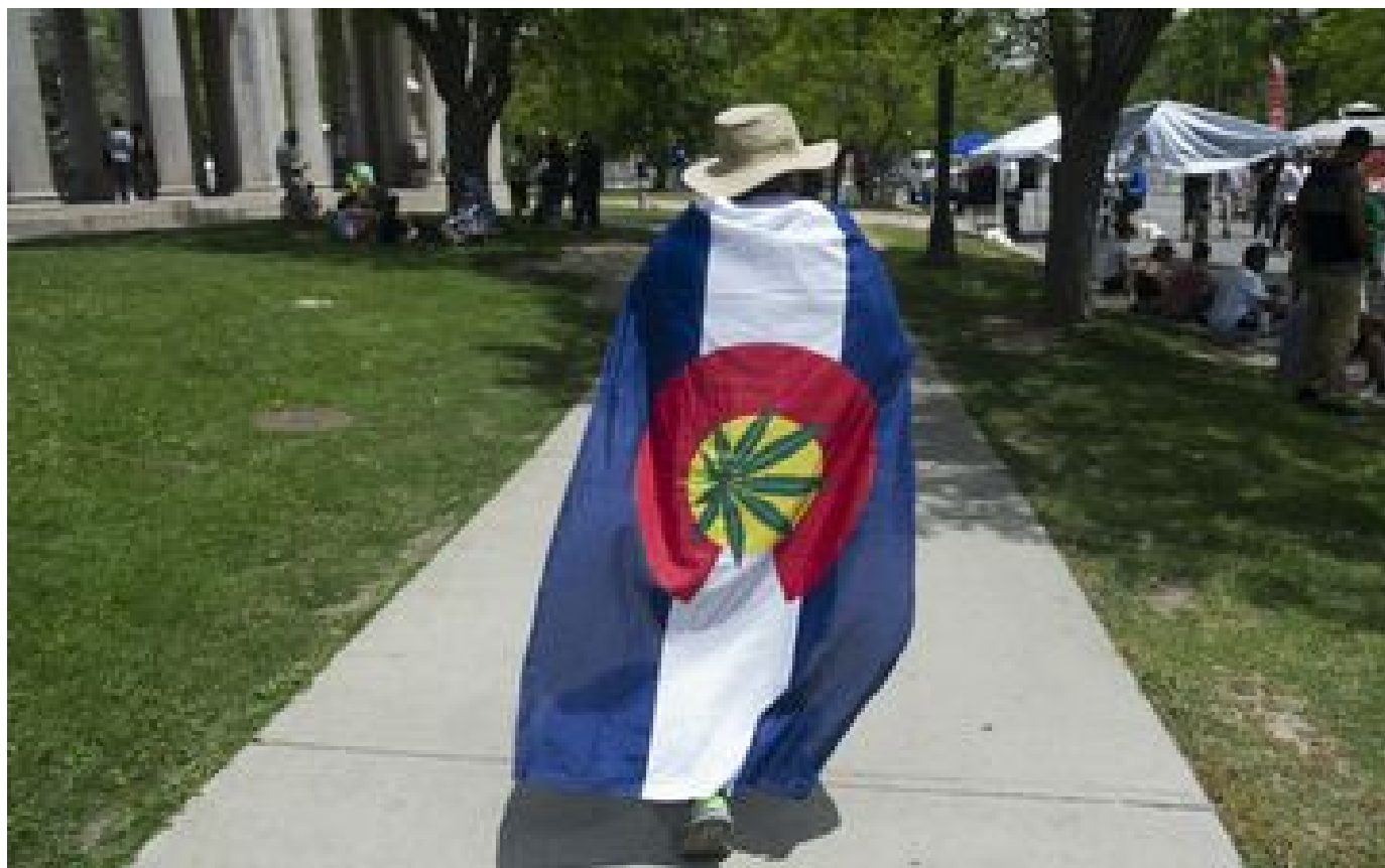
Etats-Unis : Joe Biden effacera toutes les condamnations fédérales pour simple détention de