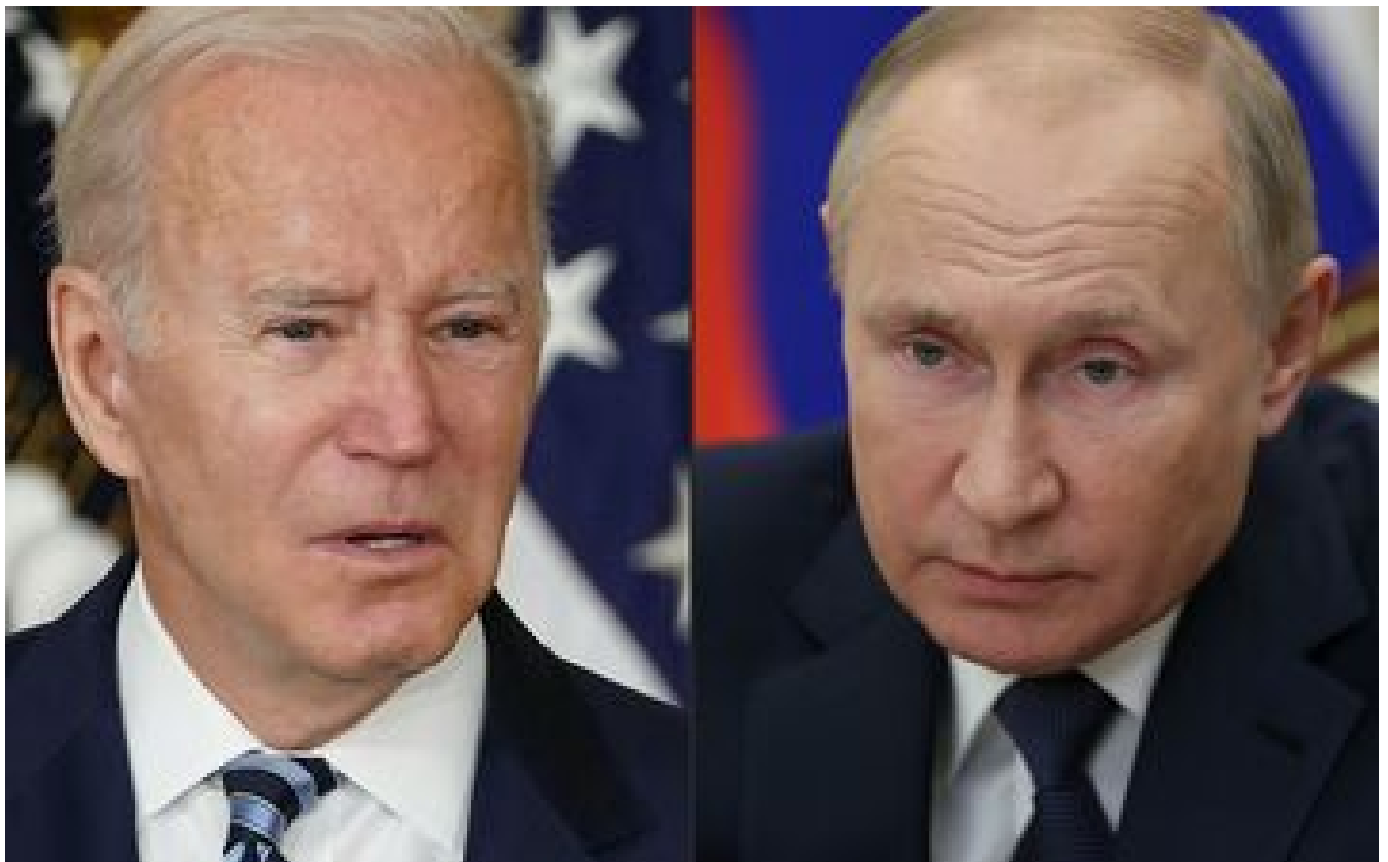
Guerre en Ukraine : Joe Biden n'exclut pas de rencontrer Vladimir Poutine au sommet du G20