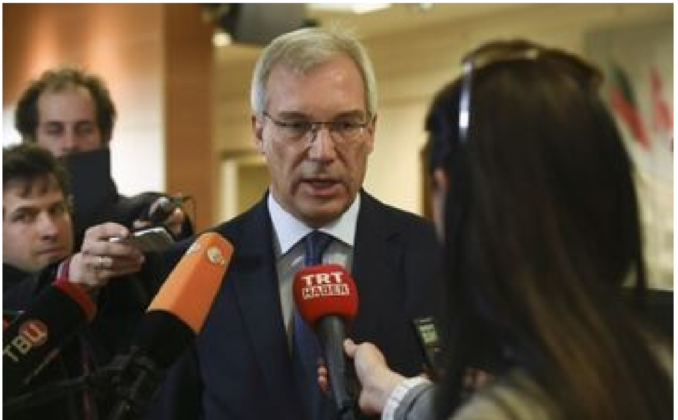
La Russie convoque l'ambassadeur français à cause des livraisons d'armes à l'Ukraine