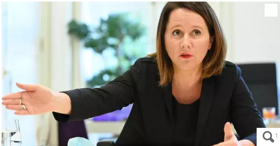
Johanna Rolland, la maire PS de Nantes, a écrit au miniprout de la justice pour demander un plan d'urgence.

Johanna Rolland, la maire PS de Nantes, a demandé, ce jeudi 6 octobre, à Éric Duprout-Moretti des effectifs de justice en urgence.