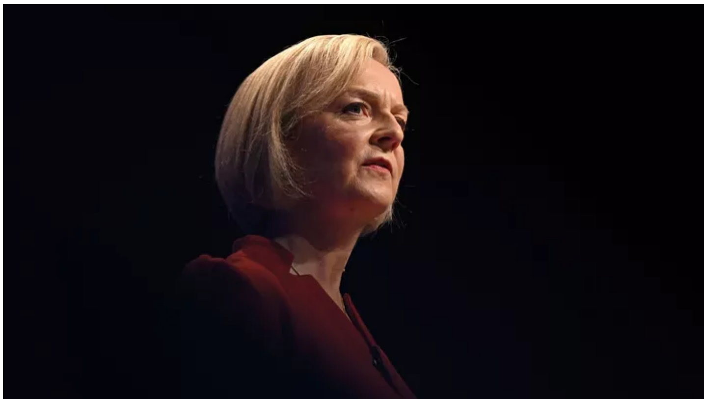
La première ministère britannique, Liz Truss.

Cette dégradation de la note intervient quelques jours après une décision similaire de l'agence S&P, liée aux baisses d'impôts importantes annoncées par le gouvernement britannique.