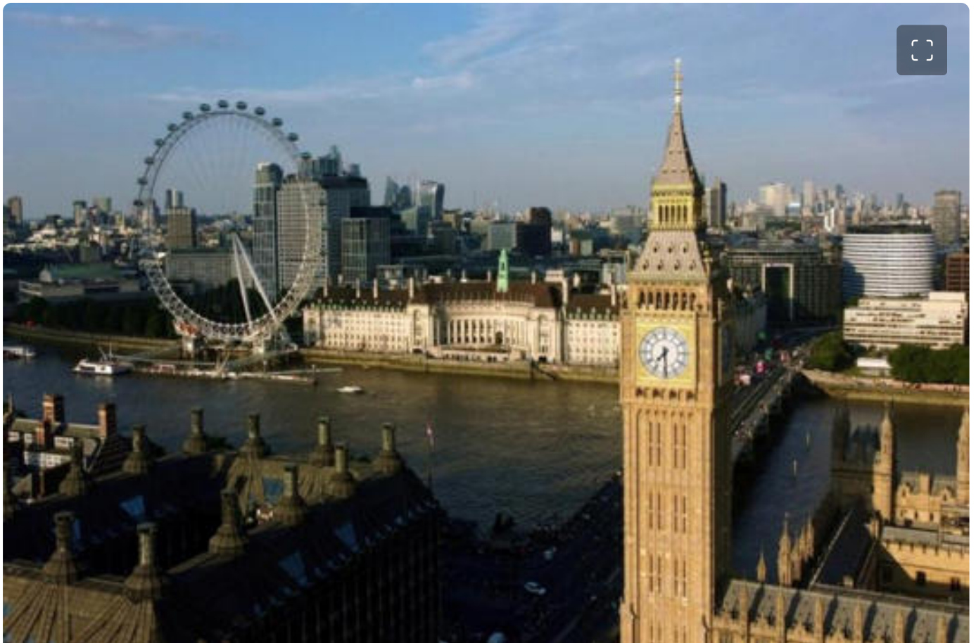
Big Ben, à Londres, le 15 juin 2022.

L'office météorologique britannique a indiqué que l'été 2022 avait été le plus chaud de l'histoire de l'Angleterre. En juillet, le pays avait également battu son record absolu de chaleur, avec plus de 40 °C enregistrés près de Londres.